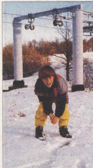
SNEG - Nedavna snega je bilo v nižinah resda samo za pokušnjo, zato pa so ga hribi prejeli kar precej. Mnogi iz Posavja so na prvi sneg tokratne zime pohiteli na smučišče na Planini v Podbočju, od koder je tudi posnetek.