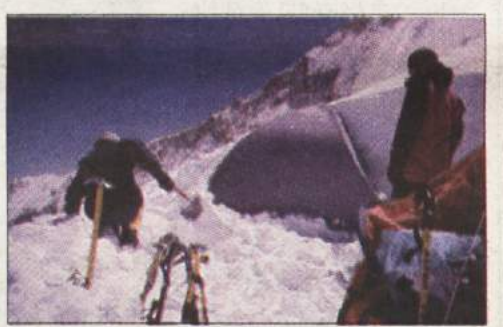
Zjutraj je bilo treba odmetati šotor, ki ga je ponoči zasul snežni vihar.

Vse močnejše je naletaval sneg. Ledeni drobci so se mi kot igle zarivali v obraz. S skrajnimi močmi smo dosegli šotor, ki so ga pred nami postavili Baski. Namesto da bi legli k počitku, smo morali na smrt utrujeni začeti kopati ploščad, na katero bomo postavili šotor. Le nekajkrat sem zamahnil z lopato in od utrujenosti je nisem mogel več niti dvigniti. Podal sem jo tovarišu, sam pa sem hlastal za redkim zrakom in si masiral premrzle, že skoraj otrple ude.