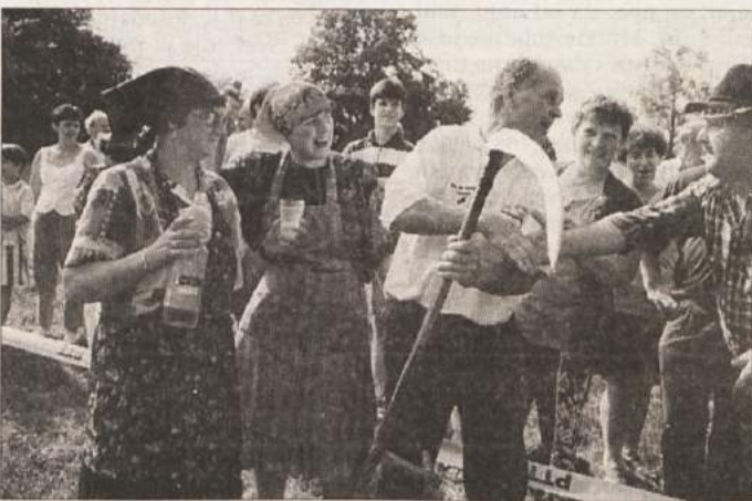
IGRE POD DEDOVO LIPO - Na jubilejnih 10. igrah pod dedovo lipo, ki jih v Šmarjeških Toplicah pripravljata tamkajšnje turistično društvo in zdravilišče, so se v soboto popoldne ekipe iz Bele Cerkev, Gabrja, z Otočca, iz Mokrega Polja, Zloganja in Šmarjete pomerile v desetih igrah: oranje, setev, košnja, žetev, spravilo pridelka, trgatve, spravilo lesa, z venčkom na mlaj, vasovanje in svatba. Geslo letošnjih iger je bilo: Kdor seje, ta žanje. Zmagala je ekipa Zloganja, ki je zbrala 400 točk, 55 več kot drugouvrščeni tekmovalci iz Gabrja. Na fotografiji: čestitke gabrskemu koscu in grabljici, ki sta bila najboljša pri košnji in grabljenju sena.