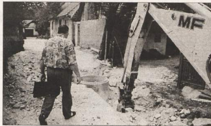
STOPIŠKA KANALIZACIJA - Gradnja kanalizacije za 5 vasi v KS Stopiče je eno največjih in najpomembnejših del v tej podgorski krajevni skupnosti.

NOVO MESTO - Planinsko društvo Novo mesto vabi v soboto, 1. avgusta, na planinski izlet na Debeli vrh (2390 m) in Ograde (2087 m), vrhova v triglavski skupini Julijskih Alp. Večji del poti je zahtevno brezpotje, zato je tura primerna le za izurjene in ustrezno fizično pripravljene planince. Odhod bo z lastnimi avtomobili ob 4.30 izpred avtobusne postaje v Novem mestu. Cena izleta je 1.300 tolarjev.