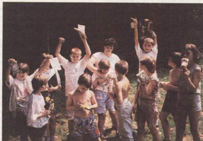
POČITNICE - Počitniške aktivnosti, ki jih je pripravil krški center za socialno delo, so se končale pri kostanjeviški jami, kjer je razigrane otroke našel tudi reporterjev fotografski aparat. Otroke, ki so preživeli 14 dni med številnimi novimi vrstniki, so vozili vsak dan dopoldne v Krško in naprej, popoldne pa domov, kjer so preživeli preostali del dneva.