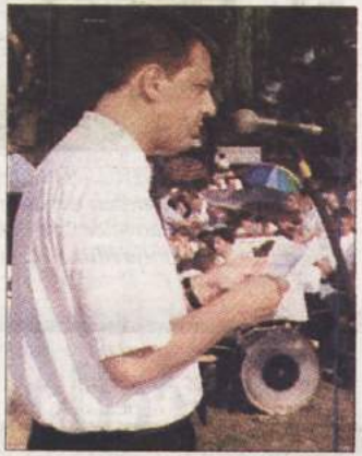
Minister Tone Rop

predloge dopolnil k zakonu o žrtvah vojnega nasilja niso združili v eno celoto, ampak jih namerava državni zbor obravnavati v več delih, kar bo zadevo še zavleklo.