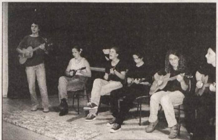
PRVI NASTOP - V kulturnem programu ob gradaškem krajevnem prazniku so nastopili recitatorji, frajtonarica, kitaristka ter znova oživljena gradaška tamburaška skupina (na fotografiji), ki se je tokrat prvič predstavila javnosti.