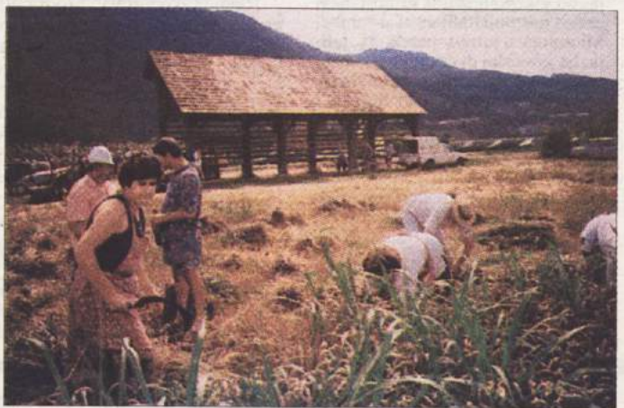
KOZOLEC - V obnovljeni Zadnikov kozolec so takoj v soboto nadevali pšenične snope. Na bližnji njivi, s katere je tudi posnetek, so jih našle domačinke, za katerimi so pridno vezali, peli in godli možakarji, ki še znajo prijeti za taka dela.