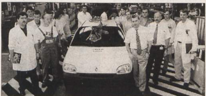
ZADNJI STARI CLIO - Zadnji, 299.831. stari Clio, ki je prejšnji ponedeljek prišel z Revozovega montažnega traku, bodo prodali v Franciji. Ob tej priložnosti so pripravili majhno slovesnost, potem pa s polno paro začeli delati naprej, kajti Clio 2 gre tako dobro v prodajo, da ga morajo izdelovati tudi ponoči.