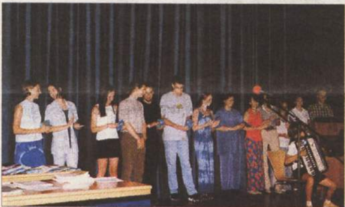
13 NAJBOLJŠIH DIJAKOV - Kar 13 novomeških gimnazijcev (na sliki) je doseglo več kot 30 točk na maturitetnem izpitu. Zdaj jih čakajo zaslužene počitnice, zatem pa verjetno uspešen študij na različnih fakultetah.

NOVO MESTO - Skupščina delničarjev Zavarovalnice Tilie v petek ni sprejela predloga za dokapitalizacijo te zavarovalnice, po katerem naj bi Zavarovalnica Sava in Dolenjska banka dokapitalizirali Zavarovalnico Tilio z 1,5 milijarde tolarjev. Za ta sklep je bilo 74,14 odst. glasov, za sprejetje pa bi bilo potrebnih 75 odst. Iz razprave je bilo razbrati, da tudi večina tistih delničarjev, ki so nasprotovali predlaganemu načinu dokapitalizacije, ni proti dokapitalizaciji zavarovalnice nasploh, da pa naj bi do nje prišli na drugačen način in po drugačni poti. Sedaj upravo Tilie čaka usklajevanje različnih interesov in pogledov na nadaljnjo pot te novomeške zavarovalnice ter iskanje za vse sprejemljive rešitve.