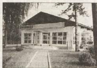
DEL PREMOŽENJA - Delavci Avtoservisa iz Brežic so sicer dosegli sodno priznanje svojega vložnega denarja. Čeprav je bila sodba izdana že leta 1994, denarja še niso dobili, so pa v začetku julija letos na okrajnem sodišču v Brežicah uspeli z izbrisno tožbo podjetja ITG.