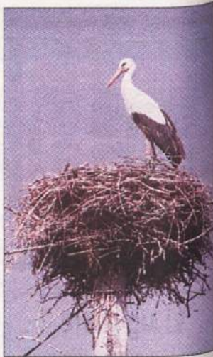
ŠTORKLIJA - Štokrlja na gnezdu pri Šentjerneju.