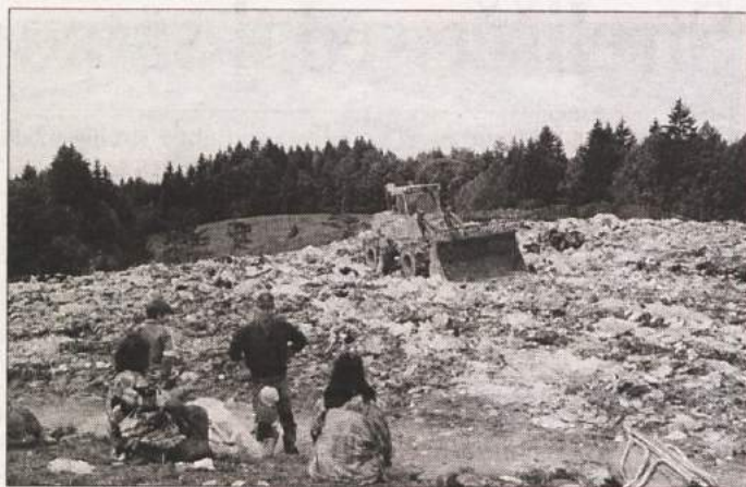
SAMO ŠE DO JUTRI - Jutrišnji dan, petek, 31. julij, je zadnji dan, ko bo še možen odvoz smeti na medobčinsko deponijo komunalnih odpadkov na Stehanu, katere stalni obiskovalci so bližnji Romi (na sliki). Takšen je dogovor JKP Grosuplje in vseh treh občin - Dobrepolje, Grosuplje in Ivančna Gorica ter bližnjih prebivalcev. Ker novo odlagališče v Špaji dolini še ni gotovo, je komunalno podjetje moralo poskrbeti za novočasno odlagalno polje odpadkov ravno tako v Špaji dolini, ki bo zadoščalo za približno leto dni, ko bo predvidoma nared nova deponija. Ureditevčasne deponije je stala okrog 20 milijonov tolarjev. Na deponijo na Stehan so vozili smeti iz bivše grosupeljske občine od leta 1978, dnevno od 120 do 140 kubikov.