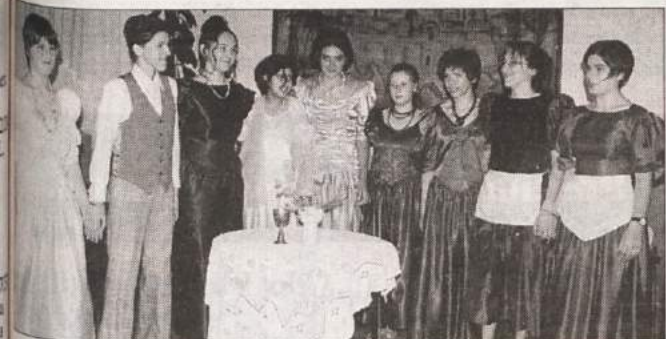
NEVESTA IZ AMERIKE - Kulturno društvo Hinje je v nedeljo v župnišču Hinje odigralo komedijo v treh dejanjih Nevesta iz Amerike . Tokrat so se predstavili že tretjič, dve predstavi pa so pripravili za mlade, ki so gostovale na Raglji v Prevolah. Predstava je bila lepo obiskana, igralka pa se že pogovarjajo za nastope v drugih krajih. Na sliki: mlade igralko KD Hinje ob zaključku predstave.