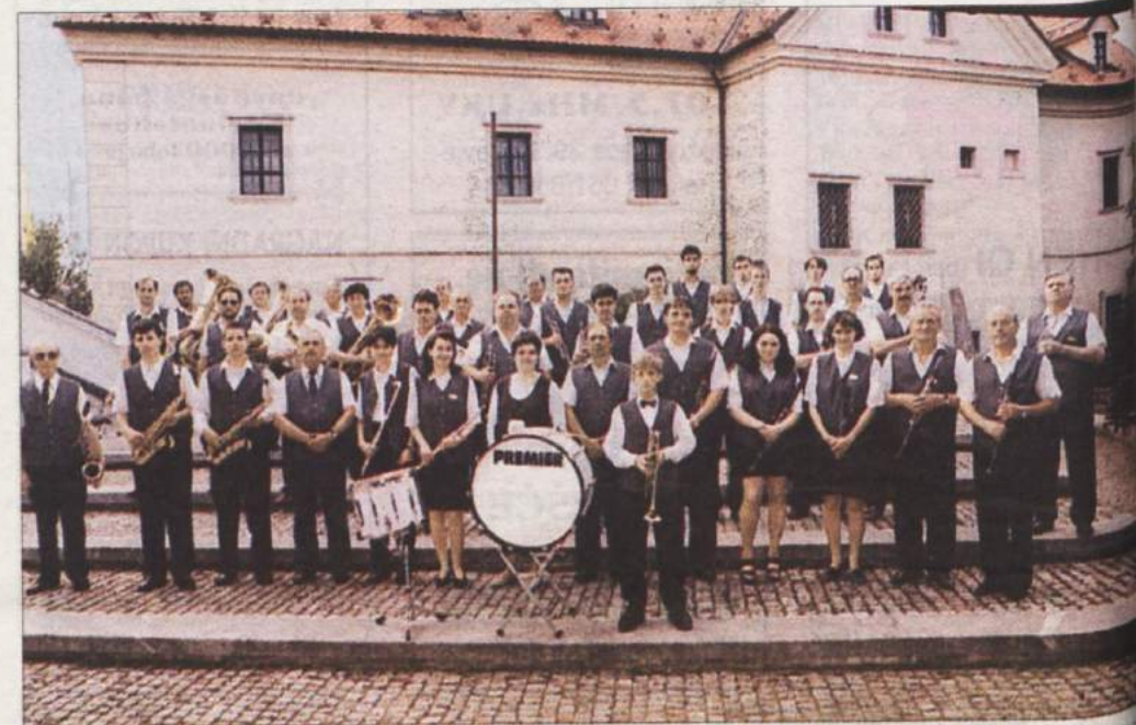
MESTNA GODBA V SEDANJI SESTAVI - Okrepjena z novimi, mladimi godbeniki, novomeška godba bodre zve v prihodnost in pričakuje vzpon med kakovostnejše pihalne orkestre.