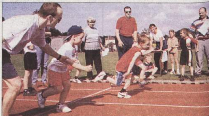
PRVIČ NA ŠTARTU - Novomeška agencija za šport je v iztekaajočem se šolskem letu precej pozornosti namenila tudi redni športni vadbi predšolskih otrok. Tako so za okoli sto otrok pripravili program redne vadbe v vrteh, zelo obiskana pa je bila tudi populatanska rekreativna vadba otrok, od dojenčkov do sedemletnikov. Za zaključek so se zbrali na novomeškem stadionu, kjer so svoje znanje in spretnosti preizkusili v 12 igrah. Nekateri so se takole ob pomoči očkov prvič v življenju postavili na štart pravega tekaškega sprinta.

RIBNICA - Klub za športno gimnastiko Šiška bo v soboto, 21. junija, v ribniški športni dvorani pripravil mednarodni turnir v športnoritmiki gimnastiki. Dopolodne bodo nastopile pionirke, kadetinke in mladinke, med katerimi bodo tudi Ribničanke. Tekmovalje članice se bo začelo ob 15. uri. Nastopile bodo najboljše tekmovalke iz Belgije, Češke, Italije, Nemčije, San Marina, Slovaške in Slovenije. (M. G.)