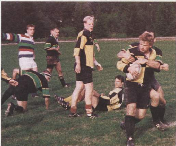
RAGBIJAŠI V RIBNICI - Konec minulega tedna so v Ribnici pripravili tradicionalni turnir sedmic v ragbiju. Nastopilo je sedem moštev iz Francije, Italije, Nemčije, Hrvaške in Slovenije. Igralci Ribnice so bili najmlajši in so osvojili zadnje mesto, a z igro niso razočarali. Prvo mesto so tudi letos osvojili igralci Kolinske iz Ljubljane, ki so vseh šestkrat zmagali, druga je bila zagrebška Lokomotiva in tretje nemško moštvo RBW.