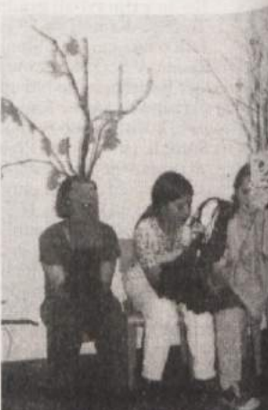
ŽUPANČIČ IN MLADI - Zavod za izobraževanje in kulturo iz Črnomlja je že osmič pripravil ob obletnici smrti Otona Župančiča ob pesnikovi rojstni hiši v Vinici srečanje mladih recitatorjev. Letošnjega 11. junija so se otroci predstavili z dramatisacijami Župančičevih pesmi, njihov gost pa je bil igralec Vojko Zidar. Na fotografiji: učenca OŠ Loka z uprizoritvijo pesmi Breza in hrast.

Za vse, kar nam je dala, za njeno toplino in srčnost, za njeno pokončno držo ji ostanemo hvaležni, bila je izjemna ženska. Ponosni smo, da smo jo imeli. R. F.