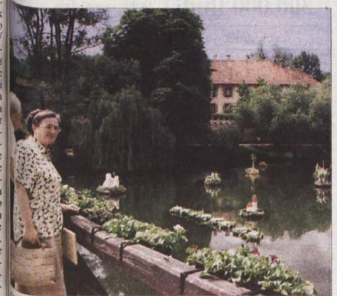
OTOŠKI PRAZNIK CVETJA - Tridnevne prireditve Praznik cvetja na otoku se je konec prejšnjega tedna udeležilo na tisoče ljudi iz cele Slovenije. In imeli so kaj videti. Krka, most čez reko in grad so bili okrašeni z različnimi in domiselnimi cvetličnimi aranžmaji, pred gradom so pripravili zelenjavno tržnico, nastopile so kulturno-umetniške skupine. Prireditve so pripravili Krka Zdravilišča, Turistično društvo Otočec in novomeška občina kmetijska šola Grm, je uspela v vseh pogledih, kar je lep obet za nadaljnjo pot.