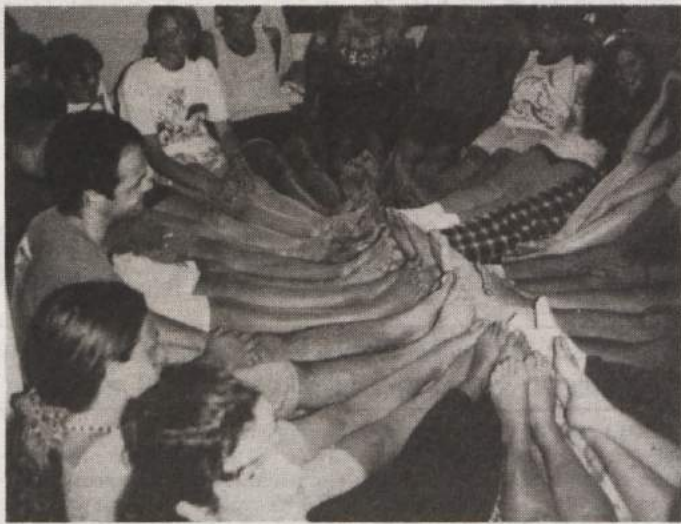
TABOR V LUCIJI - Med 23. in 31. avgustom je v Počitniškem domu Rdečega križa Novo mesto v Luciji potekal 3. mednarodni mladinski tabor, ki so ga pripravili novomeško društvo za razvijanje prostovoljnega dela, mestna občina Novo mesto in območna organizacija RK Novo mesto. Jedro tabora, ki se ga je letos udeležilo 57 mladih, je skupina Lastovke, v kateri se družijo mladi iz Novega mesta in BiH, ki začasno bivajo v Novem mestu, lani in letos pa so se jim pridružili tudi mladi iz španske občine Vilafranca del Penedes in bosanskega Bihaća, s katerima ima Novo mesto razvito prijateljsko sodelovanje.