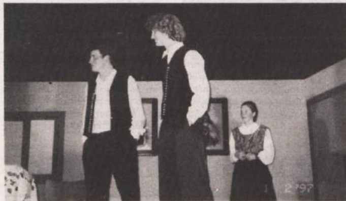
ODLIČNA PREDSTAVA, REKORDEN OBISK - Kar 430 gledalcev je pred kratkim napolnilo Jakličev dom na Vidmu v Dobrepolju. To je rekorden obisk predstave v tej gledališki sezoni. Domača mladinska skupina je uprizorila veseloigro "Na ogledih", delo Antona Medveda. Igralci so bili odlični, posebnost pa je bila, da so igro izvedli v domačem dobrepoljskem narečju. Na fotografiji: prizor iz predstave.