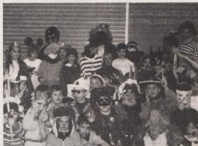
PUSTNO RAJANJE V OŠ ŠMIHEL - Že dopoldne so se učenci za pusta našemili v pikapolonice, čarovnice, gusarje, kavboje, indijance, Rdečo kapico itd. Potem pa so z rajanjem nadaljevali tudi v podaljšanem bivanju. Našemile smo se tudi učiteljice. Vse skupine smo se zbrale v učilnici, prepevale pustne in druge pesmi, plesale, poskakovale in zganjale trušč. Pripravili smo tudi karaoke v maskah. Pokazali smo se sodelavcem šole in se prehodili po ulicah v bližnji okolici ter se pokazali krajanom. S seboj smo imeli piščalke, raglje. Na pustni torek je bilo pri nas veselo in zabavno. (Foto in tekst: Helena Murgelj, OŠ Šmihel, Novo mesto)