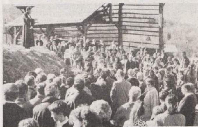
KRIŽEV POT - Že 16 let zapored v času pred veliko nočjo prirejajo križev pot, ki se vije od podgorske vasice Pangrč Grm do podružnične cerkve sv. Miklavža na vinogradnem griču v gorjanskem pobočju. Iz leta v leto se tega podgorskega križevga pota udeležuje več ljudi in procesija je vse daljša. Na sliki: začetek križevga pota je pri kozolcu nad vasjo.