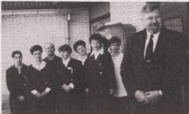
STAVBA SEMENARNE OMOGOČA ŠIRITEV DEJAVNOSTI - Podjetje VINO Brežice je v soboto poleg marketa "Tržnica" prevzelo tudi diskont "Semenarna" z okrepčevalnico. Z najemom so prevzeli vse nepremičnine na lokaciji Semenarne. Tako so v ponedeljek prevzeli tudi Avto trgovino, Semenarni Ljubljana pa poteče najemna pogodba junija, vendar bo ta, če bo želela, ostala v teh prostorih. Sicer pa direktor VINO Brežice v precej veliki stavbi, ki se je prej imenovala Semenarna, vidi možnost za nove programe, saj sam center Brežice nima celotne trgovinske ponudbe na enem mestu.