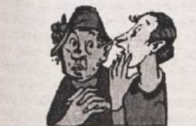
Ena gospa je rekla, da je bila avtomobilna razstava za mnoge enkratna priložnost, da so sedli v nov avto.