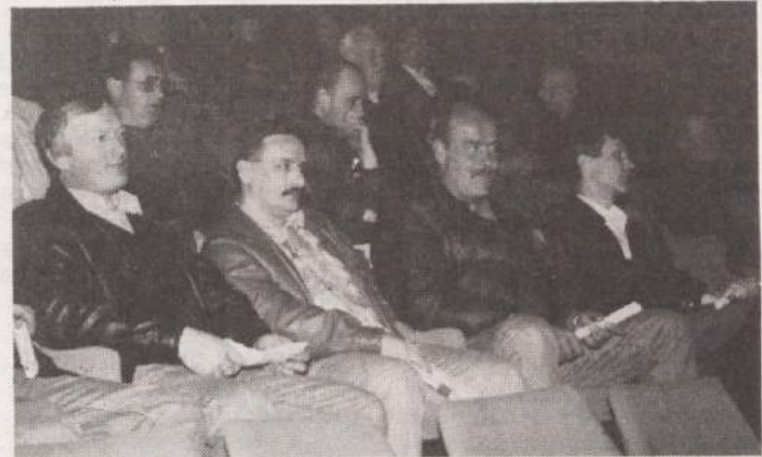
TUDI NA SENOVEM ZELENA LUČ ZA NOVO OBČINO - Po sedmih zborih krajanov po vaseh krajevne skupnosti Senovo je bil zbor v četrtki tudi na Senovem. Tudi tu so bili krajanji soglasni, da se aktivnosti za odcepitev od krške občine nadaljujejo. Seveda bodo imeli krajanji po odločitvah občinskega sveta in državnega zbora zadnjo besedo na referendumu.