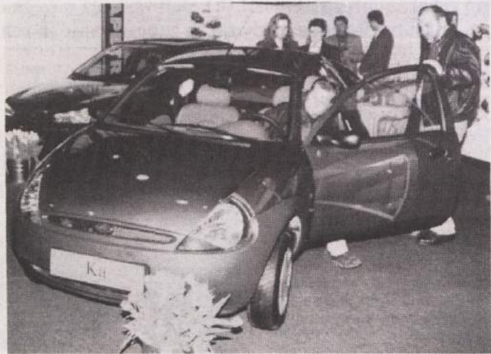
AVTO PO MERI - Veliko zanimanje je med obiskovalci vzbudila Fordova svetovna novost, njihov mali posebež z nenavadnim imenom Ka.

v državni zbor 5. februarja, sedaj dopolnil tako, da se glasi: "Ali ste za to, da državni zbor RS z zakonom o spremembah in dopolnitvah zakona o denacionalizaciji uredi: 1. da se gozdna veleposestva fevdalnega izvora ne glede na obseg ne vračajo niti zanje ne plačuje odškodnina? 2. da se pri drugih upravičencih z vračanjem gozdov ne more ustvarjati veleposest gozdov nad 800 hektarjev (razen v javni lasti) in da za presežek nad 800 hektarjev ne pripada upravičencem nikakršna odškodnina ali kvečjemu po regresivni lestvici? 3. da je pri cerkvenih pravnih osebah omogočeno vračanje do tisoč hektarjev gozdov, za presežek pa primerna odškodnina, upoštevajoč cerkvene potrebe pri vzdrževanju kulturnih spomenikov in drugih splošno koristnih cerkvenih dejavnosti? 4. da vsi ti gozdovi ostanejo v javni lasti (da je kasnejša privatizacija prepovedana)?"