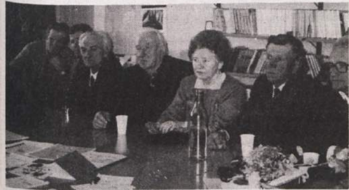
SREČANJE BORCEV 15. UDARNE DIVIZIJE - Na fotografiji je del udeležencev spominske svečanosti ob 53. obletnici osvoboditve sovražne postojanke v Zdenski vasi. Svečanost je bila v osnovni šoli na Vidmu.

"Znamenje na tem križpotju je rodovom pred nami moralo nekaj pomeniti, sicer ga ne bi postavili," je v svojem govoru dejal Hrovatič. "Zavezani ohranjanju zapuščine preteklih rodov, zavedajoč se, da naj bi vsak rod staknil niti preteklosti s prihodnostjo, smo se odločili za obnovo. Žal smo pri tem našli tudi na odpor in nerazumevanje, zlasti pri prizadevanjih za obnovo poti, ki vodi v te naše gorice in do podružnične cerkvice. Ta pot bi bila že urejena, če bi bili ljudje bolj složnejši in pripravljeni narediti kaj za skupno korist. Žal pa se zaradi pednja zemlje skrha še tako dober namen, nesložnost pa se še poglablja." A. B.