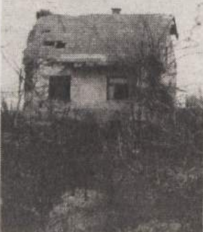
PODOBA PRELOKE - Razpadajoče domovanje nekdanjih preloških učiteljev