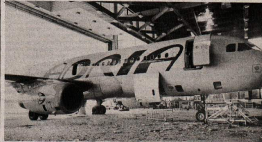
28. junija so letala jugoslovanskega vojnega letalstva napadla hangar Adria Airways in z dvema izstrelkoma preluknjala hangar, poškodovano letalo A320 in popolnoma uničila letali dash 7. Vsa letala so zavarovana, in prav zaradi visokih zavarovalnih, ki se dnevno spreminjajo, so bili v Adrii prisiljeni ustaviti nekatere polete, posebej v Beograd in nadaljnje povezave prek njega. Na sliki: Airbus A320; to in druga poškodovana in uničena letala čakajo na mednarodne strokovnjake, ki bodo ocenili škodo.