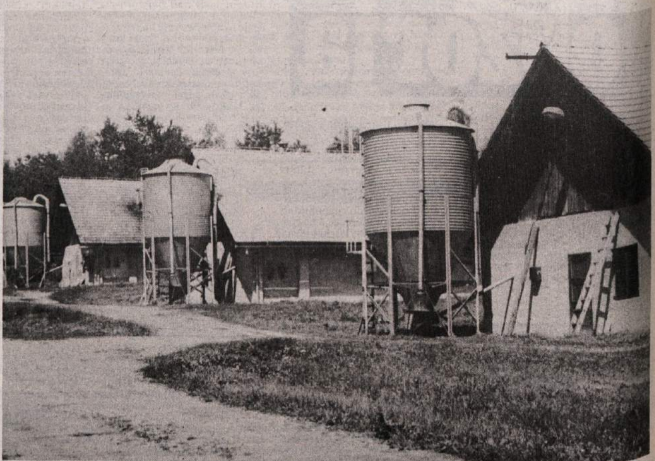
Del piščanje farne črnomaljske kmetijske zadruge na Krasincu.

Prva melioracija se je pri nas pričela leta 1948. S črnomaljskega okraja so prišli na Krasinec ter nas seznanili, da bodo meliorirali stelnike ter tako naredili rodovitna polja. Zemljo so dali v najem posestvu Vinomer, ki jo je nekaj let obdeloval. Leta 1952 pa so pričeli meliorirati v večjem obsegu. Lastniki zemlje takrat nismo dobili niti odločb, pripoveduje Pezdirc, »ko pa so leta 1956 pričeli graditi hleve, v katerih danes redijo piščance, so se odgovorni spomnili, da bi bilo potrebno urediti lastninske odnose. Toda