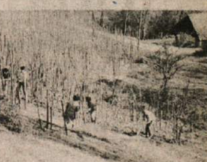
Lepo vreme, zgodnja pomlad in vinogradi so klicali po motiki. V dolenjskih vinskih gorah je bilo tako ob koncu tedna delovno.