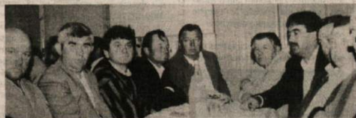
ZADRUGA ZA SEDEM SUHIH LET — Posnetek je z ustanovnega sestanka Kmečke zadruga Agraria Brežice v Dečnem selu.

še zdaleč ni tako onesnažena z ostanki, kot se včasih v javnosti sumi. Strah ima pač velike oči, četudi je treba takoj pristaviti, da je upravičen, saj gre za zdravje in življenje. Skoraj vsi vzorci razen nekaj redkih izjem — so imeli mnogo manj bioloških ostankov, kot dovoljuje jugoslovanski standardi, zaostreni leta 1987, ki so strožji od standardov Svetovne zdravstvene organizacije in ki predpisujejo približno take maksimalne dovoljene količine (tolerance) ostan-