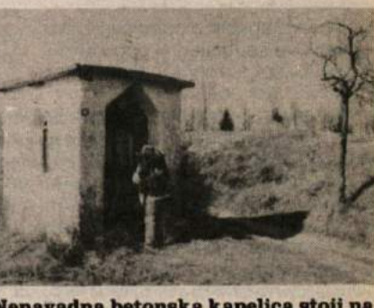
Nenavadna betonska kapelica stoji na kraju, kjer je med zadnjo vojno tekla meja med tretjim rajhom in Italijo.