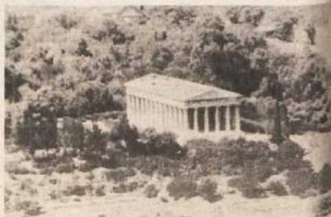
Antika v Atenah ni samo Akropola. Kamor stopi človek, naleti na njene ostanke.

Ko poslušava vse to, ugotoviva, da sva ravnala pravzaprav zelo pametno, ko sva pustila avtomod na pirejskem pristanišču in se v Atene pripeljala s podzemno železnico. Iz nje sva stopila skoraj tik pod