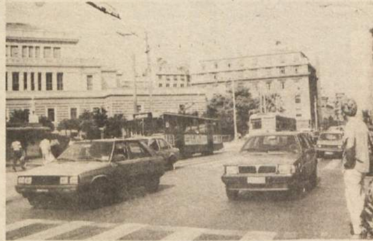
Promet je v Atenah strahovito narasel in predstavlja nevarnost za zdravje ljudi pa tudi za številne kulturnozgodovinske spomenike v mestu. Proti škodljivemu vplivu se borijo z uvedbo sistema parnepar in tudi z drugimi ukrepi.