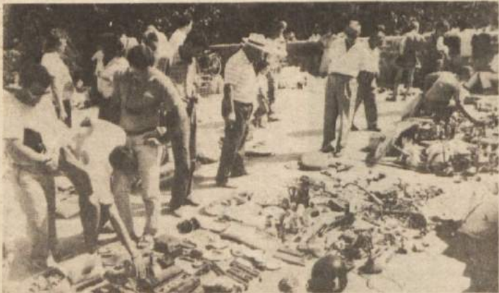
Grki so podjetni in spretni trgovci. Biti samostojen — to je želja vsakega Grka. Prične se z malimi stvarmi na boljšem trgu, nadaljuje s kioski ali malimi lokali, želja vsakega pa je, postati ladijski magnat. Ambicij jim vsekakor ne manjka. Čeprav se želje vsem ne morejo uresničiti, pa je čutiti v vsakdanjem življenju dinamiko, ki jo pri nas pogrešamo.