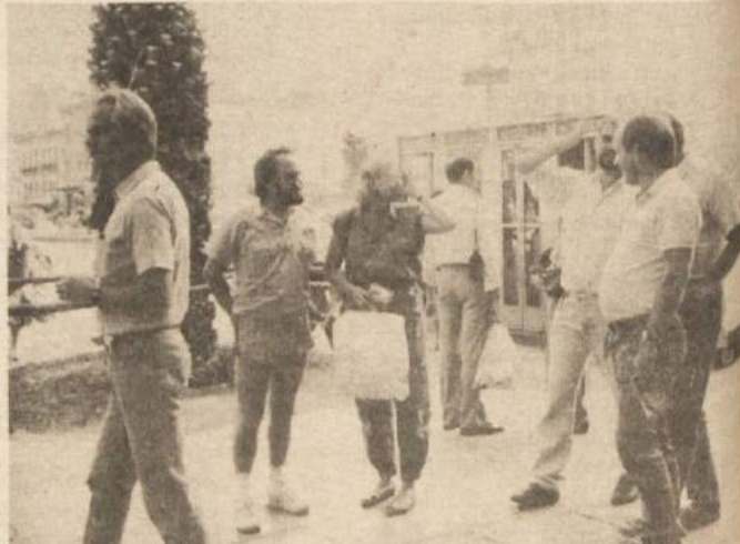
Od Olge se posloviva kar na ulici. Dopoldne je v Atenah že precej vroče, vendar ne boste videli Grka v kratkih hlačah. To kaže na to, da se že malo spodbodi.