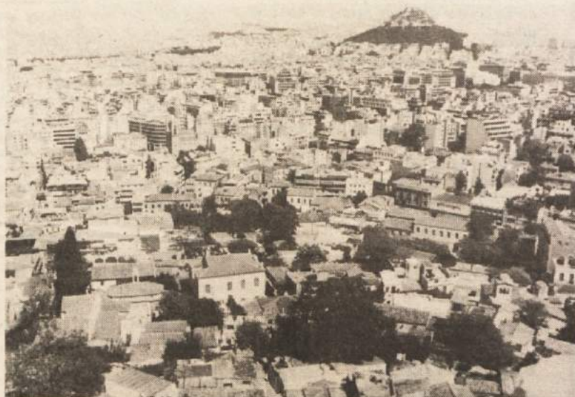
Z Akropole so Atene videti kot neskončno morje hiš, ki se izgubljajo tja za obzorje. Mesto se je zlasti po drugi svetovni vojni strahotno razširilo in se spojilo s Pirejem, ki je bil včasih samostojno pristaniško mesto.