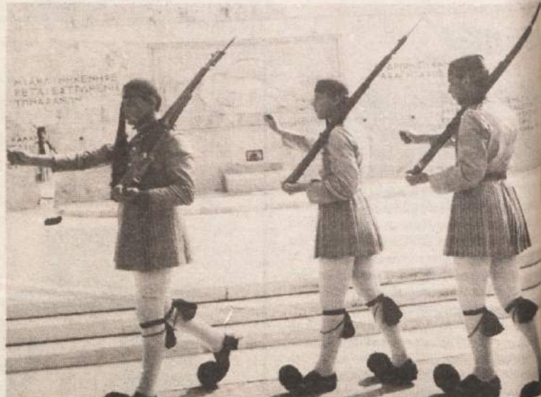
Menjava straže pred spomenikom neznanemu junaku je prava atrakcija za številne turiste. Grkom pomeni predvsem opomin, da so bile za hovo svobodo potrebne številne žrtve.

No, to je le ena od teorij o nastanku grškega smolastega vina. Druga, bolj banalna razlaga, zakaj je Grkom tako vino všeč, je ta, da so včasih sode tesnili s smolo, ta pa je vinu hočeš ali ne, dala svoj okus, na katerega so se potem navadili. Tujec, ki se hoče izogniti temu okusu, se mora pač naučiti, da je treba