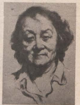
Pisateljica Ilka Vašte, kakor jo je leta 1956 portretiral Božidar Jakac.

Ilka Vašte je bila pisateljica posvetila predvsem popularni zgodovinski povesti oziroma romanu in na tem področju nadaljevala romantično domačo (npr. Jurčič, Lea Fatur) in tujo tradicijo. Upodabljala je slovensko zgodovino od naselelitve prek reformacije do lirskih provinc.