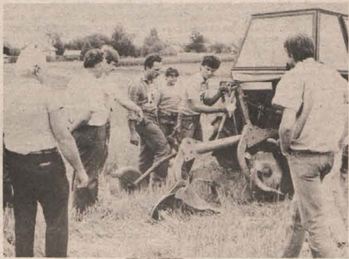
V NEDELJO V BUKOŠKU — Priprave na start

Za pozno trgatve laškega rizlinga, za katerega so na mednarodnem vinemskem sejmu Vino 87 v Ljubljani prejeli častno listino z veliko zlato medaljo, so se prvič odločili 1985 v lastnih vinogradih na Sremiču. Takrat so ga pridelali