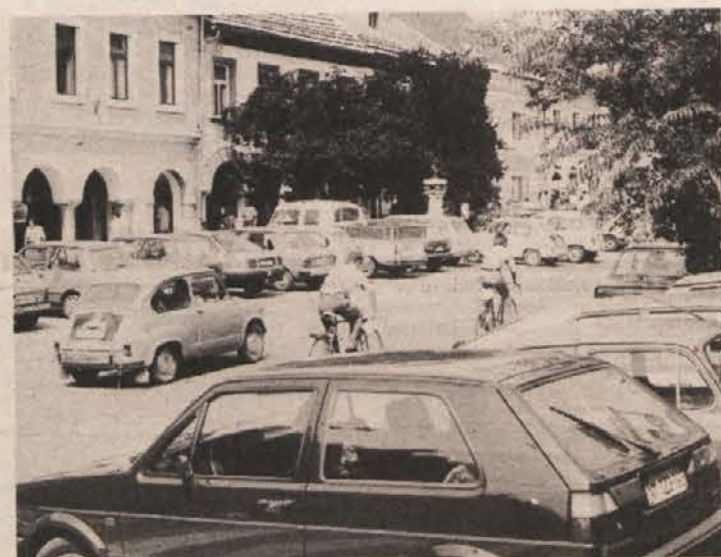
PARKIRNINA NI VEČ »BAVBAV« — Kako prijetno je bilo pred meseci na novomeškem Glavnem trgu, ko je Komunala uvedla pristojbino za parkiranje, je le še bled spomin. Novomeščani so se plačevanju parkirnine privadili, svoj delež je prispevala poskočna inflacija in parkirišča so bila kmalu spet zatrpna. Niti zadnja 66-odstotna podražitev voznikov ne odvrne od parkiranja vozil v središču mesta.

OTOČEC — V kratkem bodo zaprli močno načeti most čez Krko v vasi Otočec. Do prenove, katere naj bi se začela prihodnje leto, bo na tem mostu možen prehod prek Krke le peš, medtem ko bo voznja prepovedana. Soferji so se močno ogibali že doslej, kar je zgostilo lokalni promet pri otoškem gradu, nad čimer negotujejo turistični delavci.