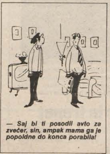
— Saj bi ti posodil avto za večer, sin, ampak mama ga je popoldne do konca porabila!

Na Tajvanu imajo namreč velik presežek riža, zato razmišljajo, kako bi ga porabili. Lojalni državljani morajo vsak dan pojedeti skledico riža več kot doslej. Izumitelj pa se je domislil še nečesa, kar je z rižem mogoče narediti. Delal je poskuse in ugotovil, da se da iz riža narediti prav lepa in dokaj trajna skodela. V nji je mogoče hraniti vročo hrano več kot tri ure, na koncu pa jo lačni lahko kar pojedjo, saj je užitna. Lahko pa jo tudi pokrmijo živini.