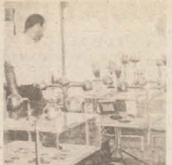
DOKAZI USPEHOV — Razstavljena zbirka medalj in pokalov priča o moči dolenske atletike. Na sliki: obiskovalci zavijejo od bančnih okenc mimogrede še k pokalom.