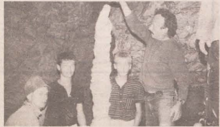
BLEŠČEČE BELA LEPOTA V ČRNEM PODZEMLJU — Odlomljeni kapniški steber, s katerim so se jamarji slikali ob svojem prvem spustu v jamo na Koritnem, so že dva dni zatem privlekli na površino. Visok je 208 cm, ima 26 cm v premeru, tehta pa okoli 200 kg.