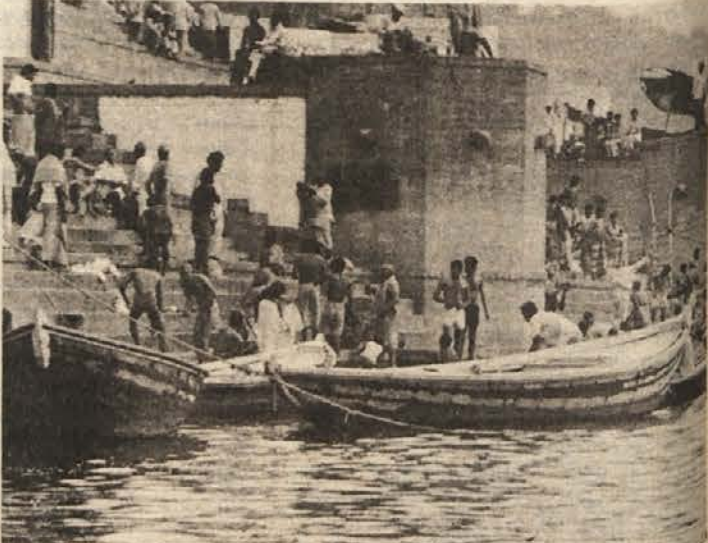
Obredno jutranje umivanje v Gangesu na slovitom stopnišču v Varanasiju