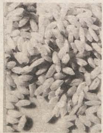
Vsakdanji kruh za več kot polovico človeštva.

izvor riža, temveč so spletla okoli njega celo vrsto mitov. Na Javi pravi ljudsko izročilo, da je boginja Devi Sri darovala ljudem riž kot dragoceno darilo, zato še vedno tudi verjamejo, da ima riž dušo in da se ga lahko ogovori kot sorodnika. Na Japonskem pa izročilo pripoveduje, da je sončna