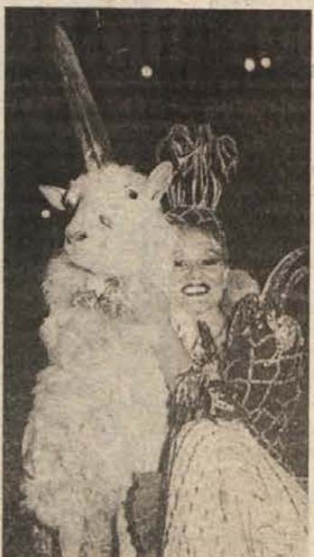
Prizor kot iz srednjeveškega mita: dekle in samorog. Oba sta resnična.

Do nenavadnega pojava je prišlo s pomočjo domiselnih cirkusantov, ki so mladi kozi združili oba mala rožička na sredo čela. Z rasto se je krepil rog, ki je tako združen zrasel do sedanje velikosti. Postopek je bil neboleč.