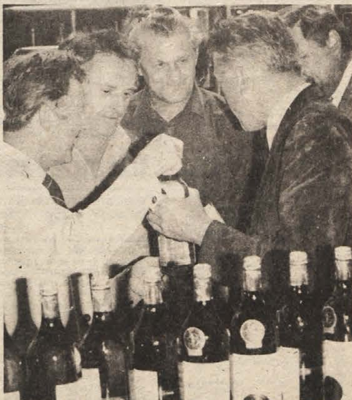
LETOS 2500 VAGONOV PIJAČ? – Lani so v delovni organizaciji Slovin Bizeljsko-Brežice izdelali za 2200 vagonov brezalkoholnih pijač in vin. Predsedniku Bulcu so povedali, da tudi letošnji plan doslej uresničujejo. Tako naj bi izdelali 1200 vagonov vin in 1300 vagonov brezalkoholnih pijač. Po prodaji vin doma so v sozdu na prvem mestu.

Med v Jutranjki zbranimi tekstilci se je predsednik Bulc zanimal predvsem za menjavo s svetom. Jutranjka ima tja do leta 1984 zastavljen pogumen načrt stopnjevanja izvoza.