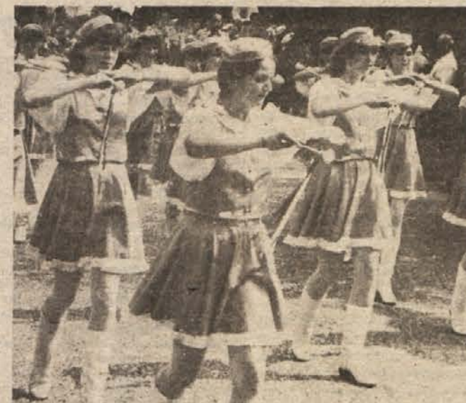
PAŠA ZA UŠESA IN OČI – Zakaj prihajajo ljudje v tolikšnem številu na prireditve? Verjetno je najbolj zadel v črno iskren odgovor: „Rad poslušam godbe, opazujem brhke in spretno majoretke ter se poveseim...“

Najštevilnejši so bili tokrat Radečani, saj so poleg papirniških godbenikov prišli še bobnarji in majoretke. Že na dopoldanskem koncertu v artiškem svetnem domu pa so nastopili orkestri iz Trebnjega, Loč, Ljubov, Kapel, Krškega in Hrastnika. Vsi ti godbeniki so se v popoldanskem sporedu skupaj z majoretkami Logatca in Ljubljane ter bobnarji iz Artiče predsta-