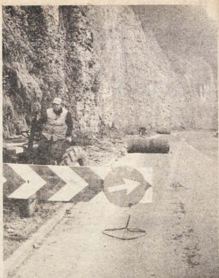
OPASANE PEČINE – Delavci ljubljanskega podjetja za urejanje hudournikov so z jeklenimi mrežami opasali blizu 800 metrov skalnatih bregov vzdolž najpomembnejših cest, kjer je promet pogosto ogrozilo padajoče kamenje. Največ dela je bilo ob Savi pri Artu.

Sodišče je poleg tega ugotovilo, da novomeški šolski center za gostinstvo v času, ko je bila podpisana omenjena pogodba, vprašanih v zvezi s štipendiranjem ni imel urejenih z nobenim samoupravnim splo-