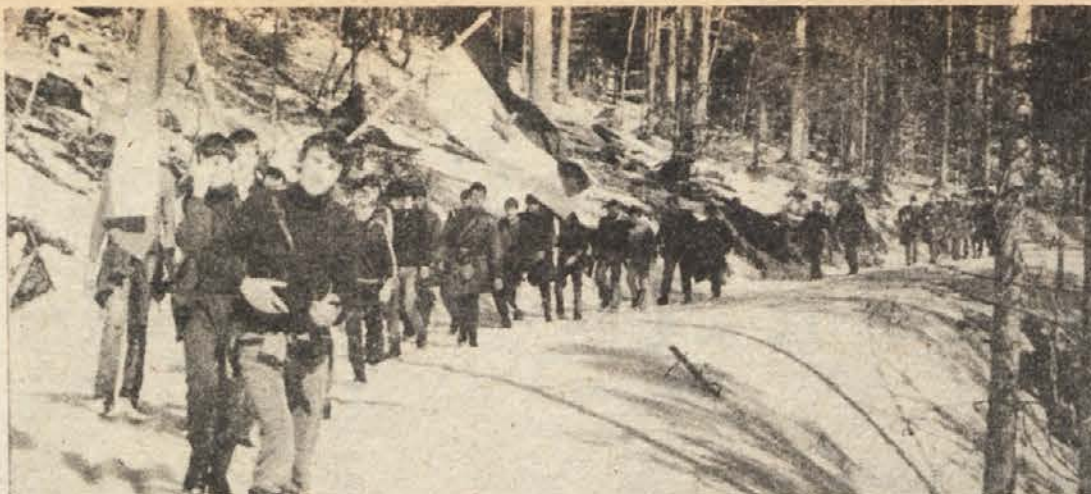
POHOD V JELENOV ZLEB – 27. marca je bila ob prazniku občine Ribnica v Jelenovem zlebu spominska slovesnost, ki so se je udeležile pohodne brigade iz Sodražice (na fotografiji), Ribnice, Dolenje vasi in Loškega potoka.