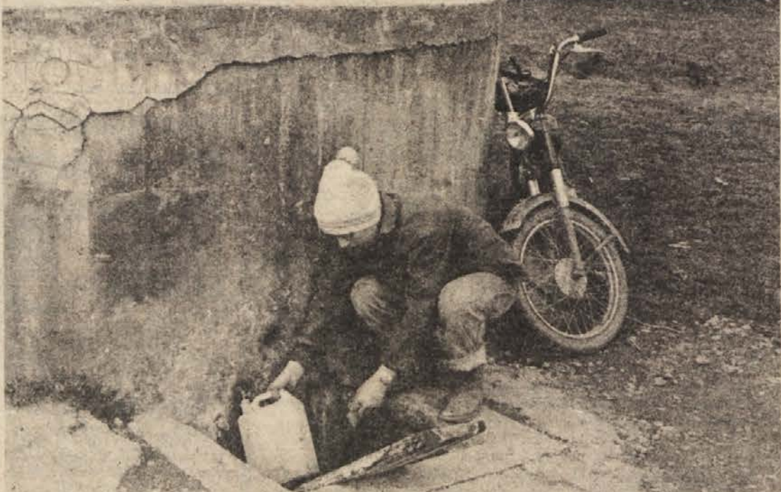
Mineralni vrelc pri Očeslavcih

Spomenik častitljivi, na desetine milijonov let stari vodi, ki se osvobaja zemeljskih skladov in spreminja življenje tam, kjer privre na površje.