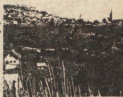
Ureja: Tit Doberšek