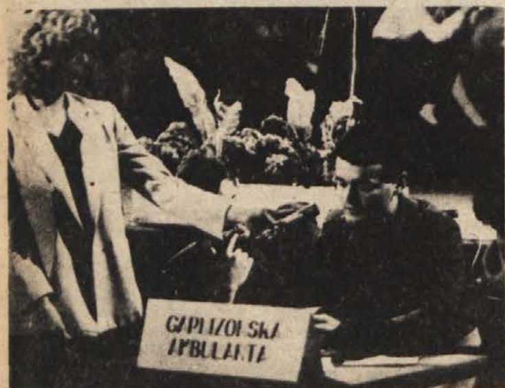
VOJAKI POKAZALI NAJVEČ — Tričlanska ekipa garnizijske ambulante Novo mesto je na kvizu najbolj točno odgovarjala strokovni žiriji v novomeškem Domu JLA.

Upokojenci, ki jim po dosedanjih predpisih varstveni dodatek ni pripadal, sedaj pa bi imeli pravico do njega, morajo vložiti zahtevek pri novomeški Skupnosti pokojninskega in invalidskega zavarovanja najkasneje do konca junija, če hočejo dobiti dodatek od začetka leta. Sicer jim gre pravica do dodatka šele z naslednjim mesecem po vložitvi zahtevka. Dodatek pa bodo vsem upravičencem dodelili ali zvišali le na osnovi zahtevka.