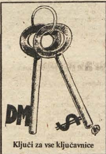
Ključni za vse ključavnice

Lani so na Čatežu izdelali 200 milijonov kovinskih polizdelkov za druge tozde in 2 milijona 12 polnih sponek različnih dimenzij. To jim je prineslo 130 milijonov prihodka, 50 milijonov dohodka in 30 milijonov čistega dohodka. V sklade so vložili 10 milijonov dinarjev. Letos namepravajo ob 10-odstotnem povišanju cen, kar so se dogovorili v skupini proizvajalcev elektromateriala, povečati prihodek na 180 milijonov dinarjev, dohodek na 65 milijonov