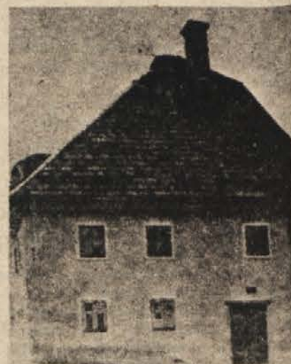
Šola, ki jo je obiskoval France Prešeren