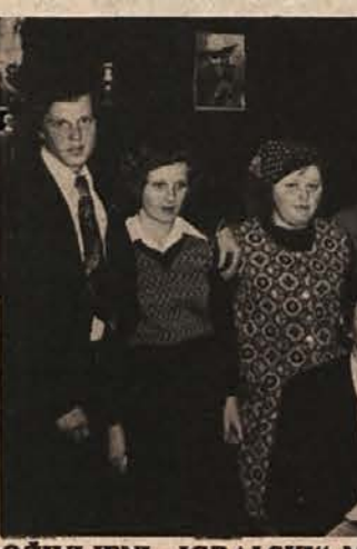
OŽIVLJENI „IGRALSKI“ MALI SLATNIK – Dvorana nižjerazredne osnovne šole na Malem Slatniku je v nedeljo, 25. aprila, spet oživila, tokrat zaradi Marinčeve komedije „Poročil se bom s svojo ženo“, ki jo je uprizorila dramska skupina slatniškega mladinskega aktiva.

Zato je zidava novega muzejskega paviljona za oddelek NOB, ki je v načrtu in tudi denar zanj že doteka, tem bolj nujna in opravljiva. Ne nazadnje je treba to zidavo čimprej omogočiti, ker gre v tem primeru tudi za spomenik revolucionarnim obdobjem na Dolenjskem. Sam Dolenjski muzej pa bi s preselitvijo gradiva o NOB v nove prostore pridobil v Ropasovi hiši (seveda temeljito popravljeno) sobe za etnografsko gradivo, ki se mu je v letih obstoja nabralo.