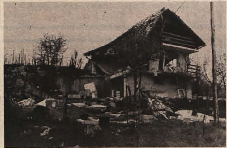
PRAVO RAZDEJANJE – Samo dvokilogramska plinska bomba je eksplodirala v vikendu pri Karteljevem, pa je nastalo tako razdejanje.