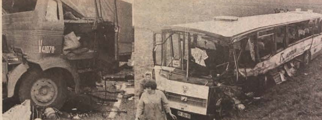
TRK PRI RADOHOVI VASI – V četrtek, 29. aprila, se je avtobus, poln otrok iz Cerkelj na Gorenjskem, vračal z obiska pri vrtnikih v istoimenskem kraju pri Brezicah. Med potjo je blizu Radohove vasi prišel do silovitega trčenja s kamionom. Več otrok je bilo ranjenih in prepeljanih v ljubljansko bolnišnico.