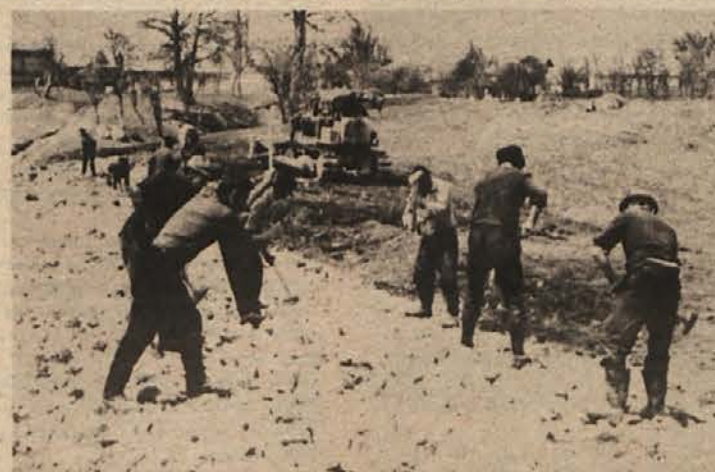
ROJEVA SE CESTA — Krajanji iz Velikega Lipovca in Sel pri Ajdovcu že tlakujejo cestišče nove krajevne ceste.

Krajanji Velikega Lipovca in Brezove reber, ki so se obvezali, da bo vsako gospodinjstvo opravilo po 120 ur prostovoljnega dela, so v večini že opravili svojo dolžnost, zato je zdaj na nas, da jim pomagamo priti do spodobne ceste. O zbirnem mestu in času odhoda na akcijo bodo udeleženci pravočasno obveščeni v osnovnih organizacijah SZDL in ZSMS.