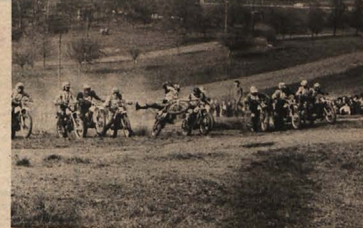
NEVAREN ŠTART – Prvi štart v kategoriji 125-kubičnih motorjev je prinesel tudi prve poškodbe. V želji, da bi se čim hitreje pognal po progi, je tekmovalac s štartno številko 23, Rajko Čuš iz Ptujja, preveč pritisnil na plin; motor se je vzpel na zadnje kolo, dirkač je lovil ravnotežje, vtem pa se je vanj zaletel drug tekmovalac.