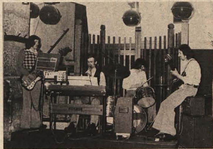
Ansambel Samorastniki na enem od svojih nastopov

Vsako soboto ob dvajseti uri zadonijo v kleti črnomaljskega gradu začetni akordi, znak, da se je začel ples. Mladi se zgrnejo na plesišče in uživajo ob lahki glasbi. Nihče od njih pa ne pomisli, koliko truda je vložena, da lahko ansambel igra cele štiri ure, nihče ne ve, koliko popoldnevo v tednu je porabljenih za vaje. O, pač, fantje, ki sedijo ali stojijo za svojimi instrumenti, vedo, da