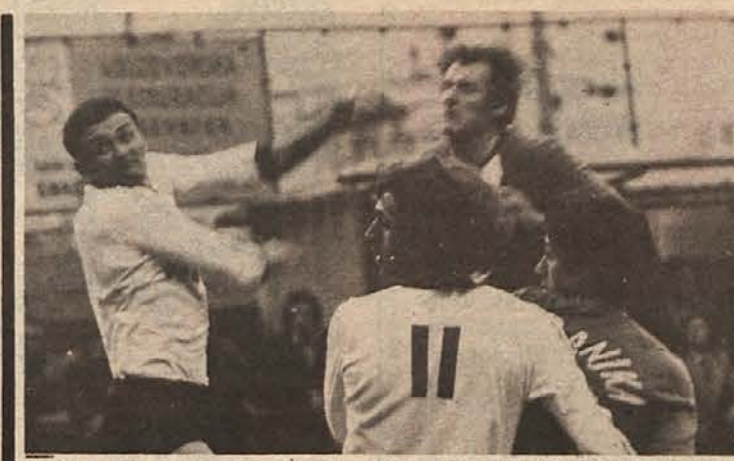
NOVA ZMAGA – Sevnici so v 18. kolu v Senju dvakrat presenetili domače igralce in gledalce. Kazalo je že, da bodo domači zmagali, saj so vodili s sedmimi zadetki prednosti, ob zadnjem sodnikovem žvižgu pa so bili gostje boljši za zadetek.