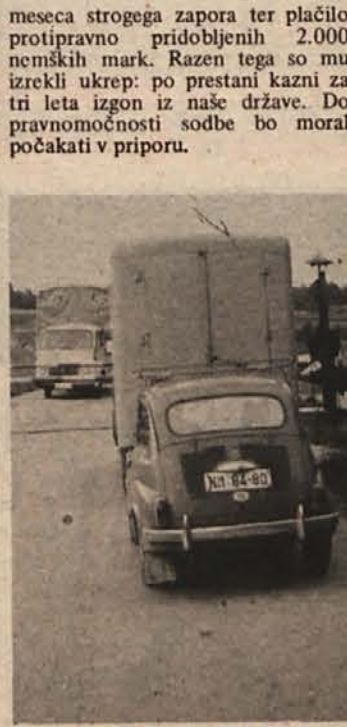
BOLJE POČAKATI, KOT... – Pri železniških zapornicah v Gradcu (na sliki) je na obeh straneh večkrat več vozil. Neučakanci trobijo in dajejo znake, naj bi jih spustili dalje, ampak pravila so pravila. Za varnost odgovarja čuvaj, kdor pa bi smuknil čez progo, ko se zapornici že spuščata, je lahko ob vozniško dovoljenje.