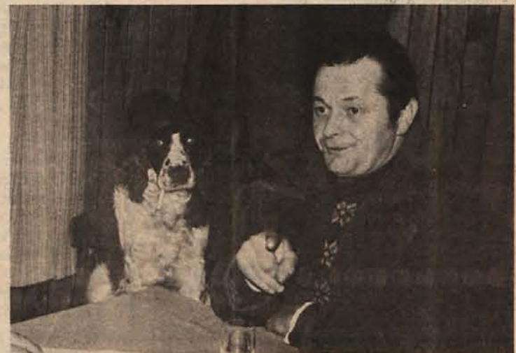
Takole včasih našemu Vučajnu svojega psa: klobuk na glavo, cigareto v usta in na stol za gostilniško mizo. Če se natakario preveč obira, jo gre Aro hitro iskat za šank.