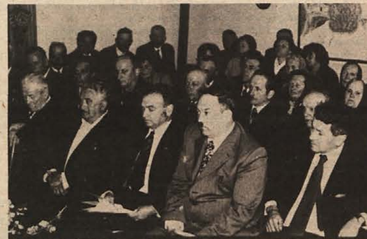
S KONFERENCE BORCEV NA DVORU — Zavzemajo se za širše in poglobljeno delo.