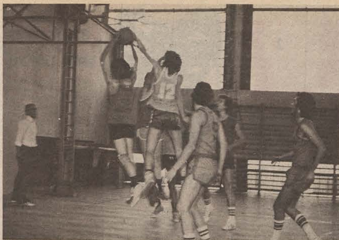
Sobotni košarkarski turnir v počastitev dneva republike in 30-letnice osvoboditve si je ogledalo okoli 300 Novomeščanov. Organizirali so ga košarkarji NK Obutev, pokrovitelj turnirja pa je bila novomeška Industrija obutve.