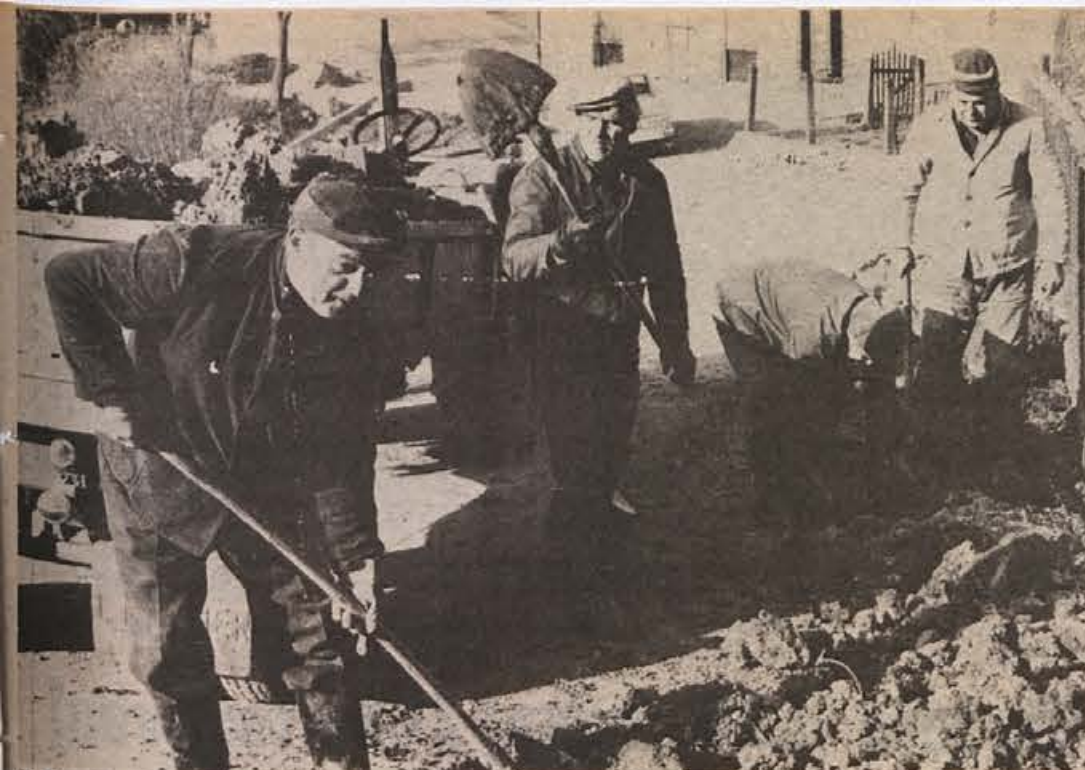
V Krmelju storijo marsikaj brez kumunalnih in drugih podjetij. Enostavno se v kraju dogovorijo za kakšno stvar in jo izpeljejo. Tako tudi dobro poteka odvoz smeti. Skupina štirih upokojencev (na sliki) je bila uspešna pri raznih delih, nazadnje pri urejanju kanalizacije na Hinjce in v novem naselju.