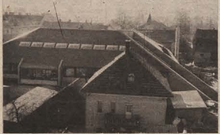
Novi dom JLA v Ribnici pospešeno dokončujejo, saj je že napovedano, da bo otvoritev v petek, 19. decembra, dopoldne. Na fotografiji: pogled na dom iz osnovne šole.

Na proslavah so razen govornikov nastopili še recitatorji, pevci in kulturne skupine, ki delujejo na teh območjih. Te svečanosti so izkoristili ponekod tudi za svečan sprejem cicibanov v pionirsko organizacijo.