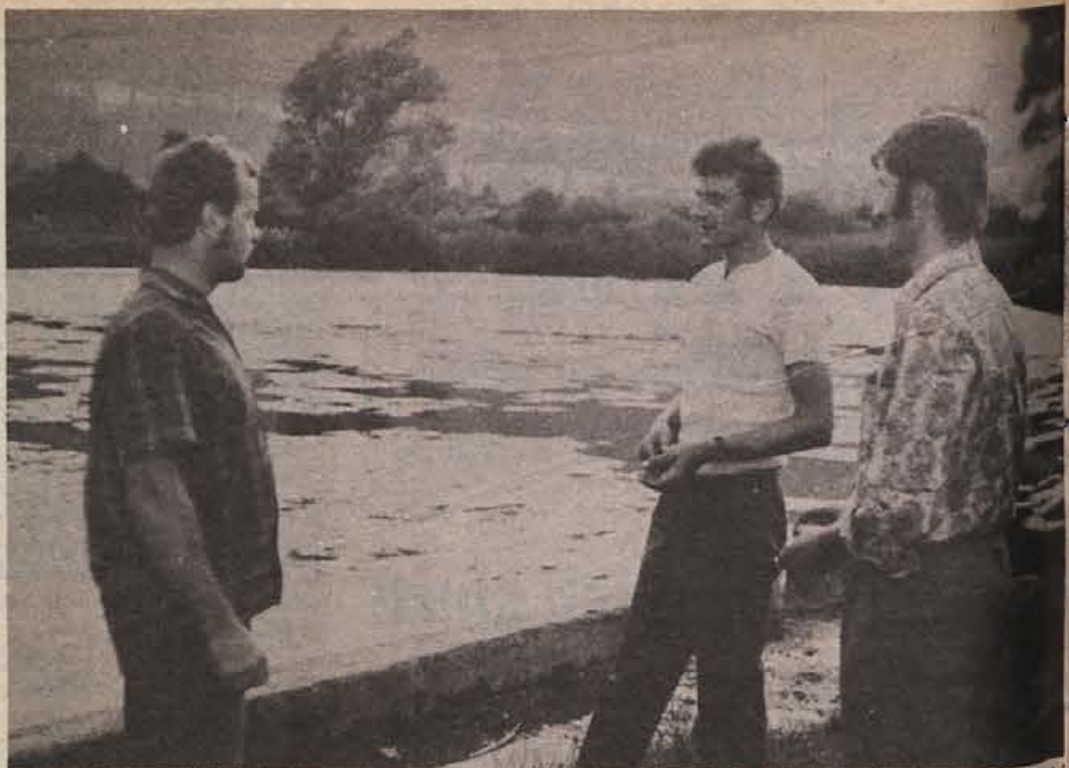
Voda v bazenu v Črnem potoku je bila še pred dobrim letom (od takrat je ta slika) onesnažena, zdaj pa je že popolnoma čista. Zato bodo del tega velikega bazena že prohodnje leto še pregradili in uredili pravo kopališče.