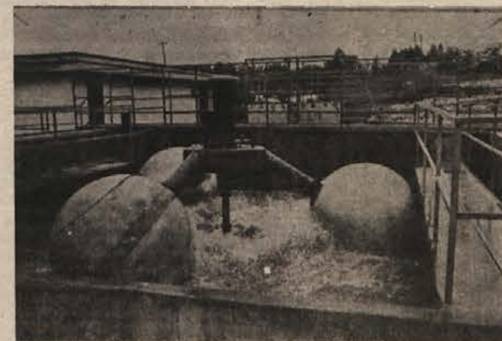
„KRKA“ ZA ČISTEJŠO KRKO. Del čistilnega bazena in naprave za mehansko razbijanje večjih delcev v odpadnih vodah. Trije „plavači“ vzbujajo posebno pozornost obiskovalcev...

TOZD hitreje znebili zastojkarjev, malomarnežev in lenuhov. O tem je pred kratkim govoril tudi tovariš Stane Dolanc, ko je dejal, da je veliko naših problemov nastalo in še nastaja zaradi tega, ker se pri nas premalo dela, ker je še vedno precej neodgovornega vedenja, nedisciplinane ipd. To velja tako za tovarne kot za vse vrste