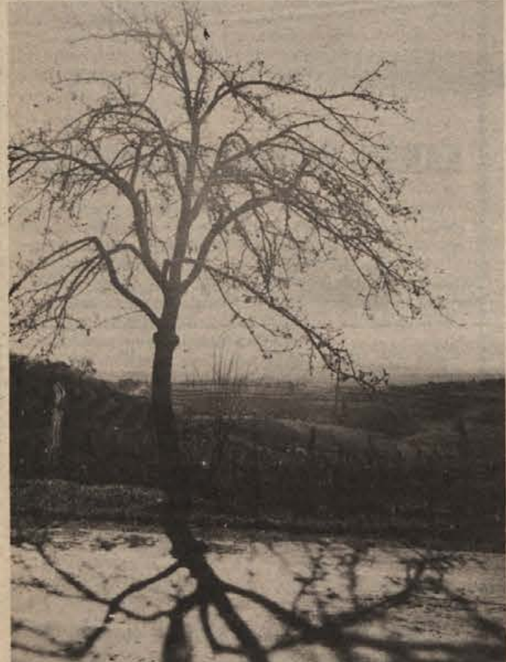
Sončni žarki imajo iz dneva v dan manj moči in ko poskušajo obuditi v življenje že zaspale korenine dreves, jim ne uspe več. Vse, kar ustvarijo v mrzlih dneh, so neponovljive senčne risbe. Na sliki: jesenski motiv z belokranjskega Suhorja.