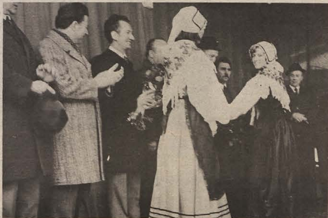
S četrtkove slovesnosti pred novo vinsko kletjo Slovina v Brežicah.

VREME Jutri bo oblačno, predvsem v zahodni in srednji Sloveniji so možne padavine. Nad Sredozemjem nastaja območje nizkega zračnega pritiska, ki bo v naslednjih dneh še zadrževal oblačno in razmeroma toplo vreme z občasnimi padavinami.