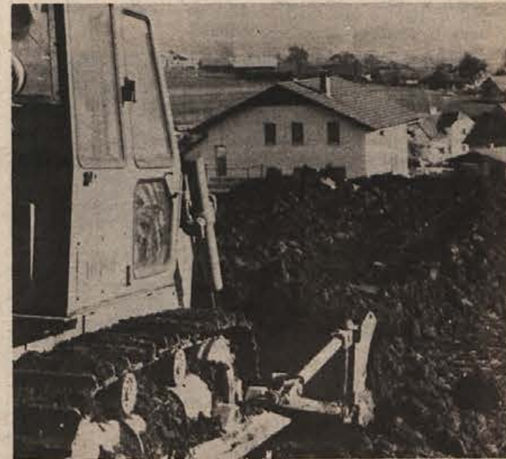
Pavlinov hrib v Trebnjem bo slej ko prej še temeljiteje spremenil videz. Grosupeljsko gradbeno podjetje je namreč zastavilo gradnjo štirih blokov za stanovanjsko skupnost. V njih bo 42 stanovanj. V tej soseski so predvideni še drugi bloki.