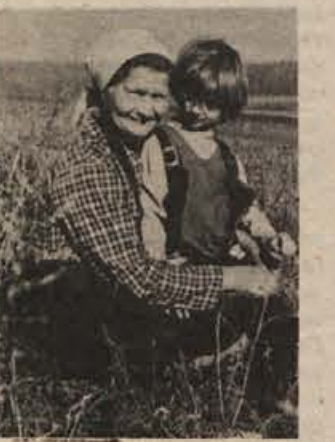
Flekova Lojzka z vnучko