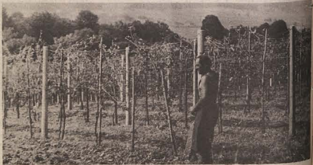
TRTA NA ŠKARJAH RODI: sodoben vinograd na Dolenjskem