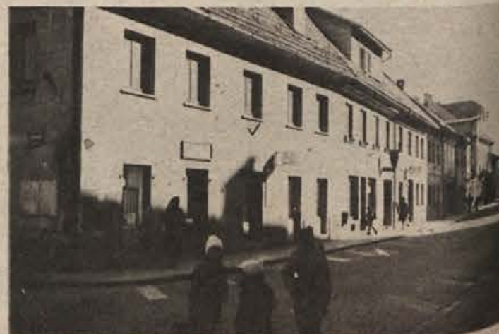
K razvoju Ribnice in ribniške občine po svojih močeh prispevajo obrtniki, ki imajo v glavnem enake dajatve kot delovne organizacije. Največ obrtnikov je ob glavni ribniški ulici.