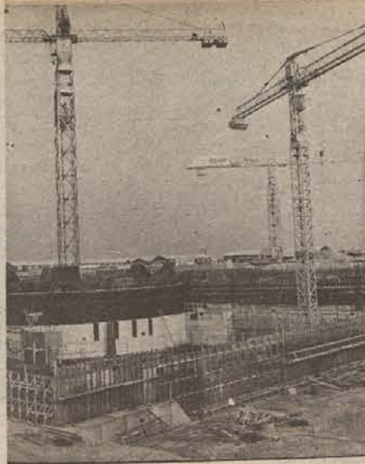
Pogled na gradbišče jedrske elektrarne v Krškem leto dni po položitvi temeljnega kamna. Gradbena jama je globoka skoraj dvajset metrov. Vsi temelji so končani in iz jame se dvigata reaktor-ska zgradba in varovalni hram. Gradbišče meri dvajset hektarov.