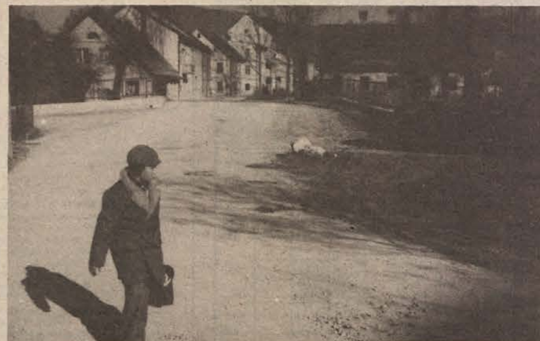
Okolica novega Čevljarkega mostu v Ribnici je pripravljena za asfaltiranje. Padla je tudi že Češarkova hiša. Denar je zagotovljen, dela pa lahko zavre, oziroma odloži le slabo vreme.