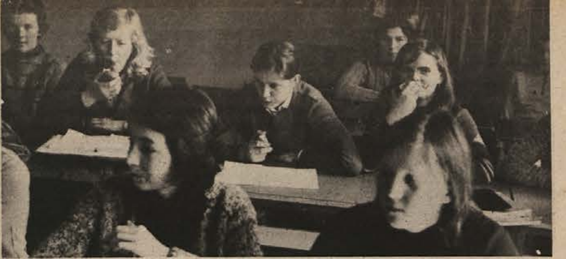
V osnovni šoli Sodražica imajo premajhno jedilnico, da bi bila primerna za celodnevno šolo. Že zdaj malicajo šolarji tudi v razredih. Seveda pa je premajhna tudi kuhinja.