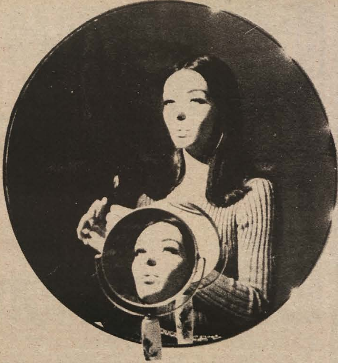
Spretno postavljena kamera ameriškega fotografa Henryja Grossmana je podobi neznane lepotic pridihnila starodavno „resnico“ o ženski dvoličnosti, ki ji rado botruje tudi spogledovanje. Komu velja izraz obraza? Ugledani lepoti ali prikriti resnici?