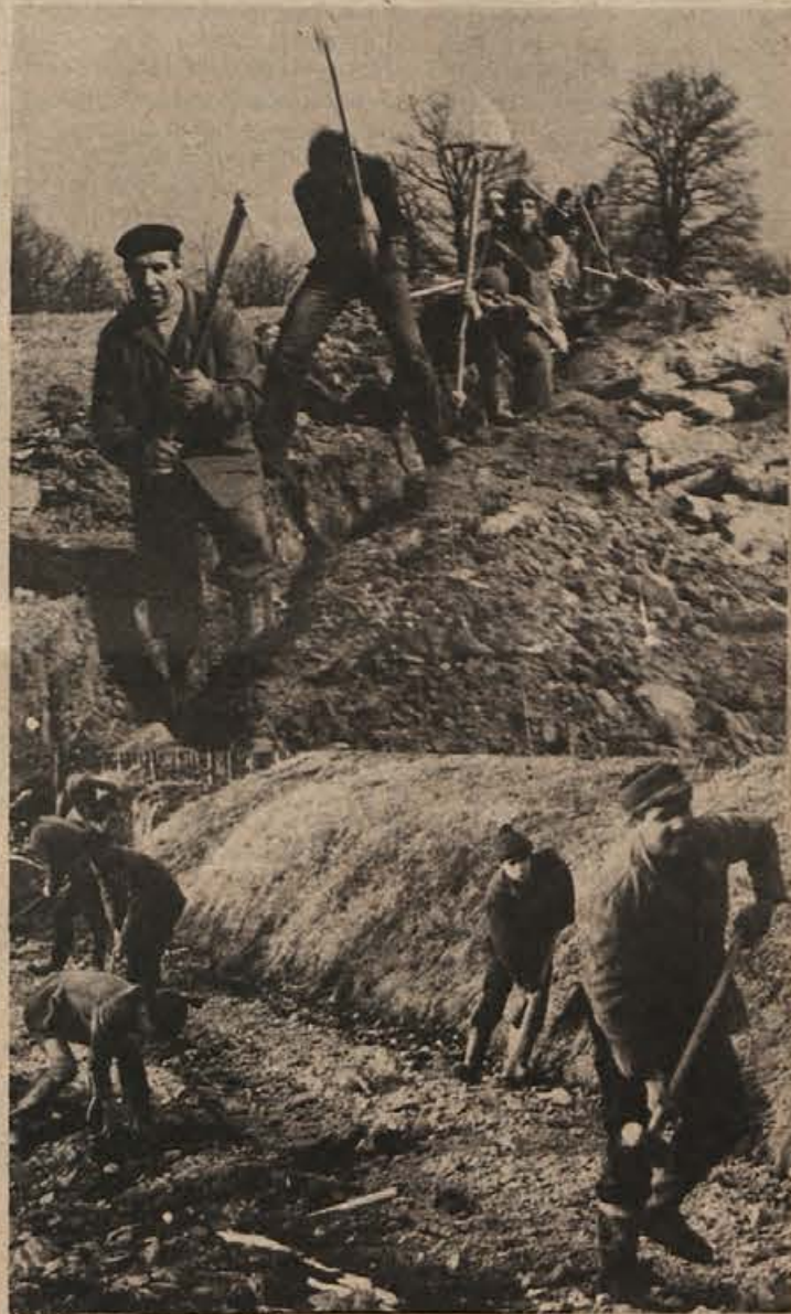
V Gornjem Mokronogu se bodo sami dokopali do vodovoda (prva slika), za delo na cesti Češnjice-Bogneča vas-Vinski vrh je prijelo staro in mlado.