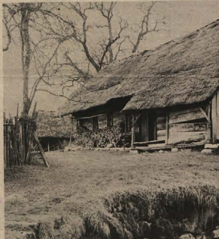
Tu in tam je še videti v odročnih vaseh leseno hišo s slamnato streho, kakršna je ta v Fučkovih. Danes je taka hiša že zanimivost, ob kateri se ustavlja nedeljski turist, a še ni tako dolgo, ko je bilo vse belokranjsko podeželje slamnato. Razen tega tudi ni več ljudi, ki bi znali prekrivati strehe s slamo.

ške, ker za njimi niso stali delavci, tisti, ki so delegata poslani na zasedanje. Tako so prosvetni delavci očitali, da delegati iz delovnih organizacij neobjektivno ocenjujejo njihovo delo in položaj šolstva, izkazalo pa se je, da tudi delegati iz prosvetnih vrst niso bili usposobljeni za enakopravno dogovarjanje in razpravljanje z delegati iz podjetij. To pomanjkljivost bo potrebno v bodoče odpraviti s seminarji in predavanji za delegate iz vrst prosvetnih delavcev, za kar bosta poskrbela sindikat in SZDL.