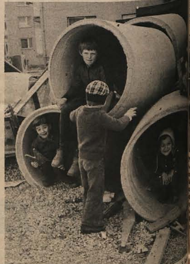
Ko delavci zapustijo gradbišče: - Zdaj smo pa mi gospodarji slikajte nas!