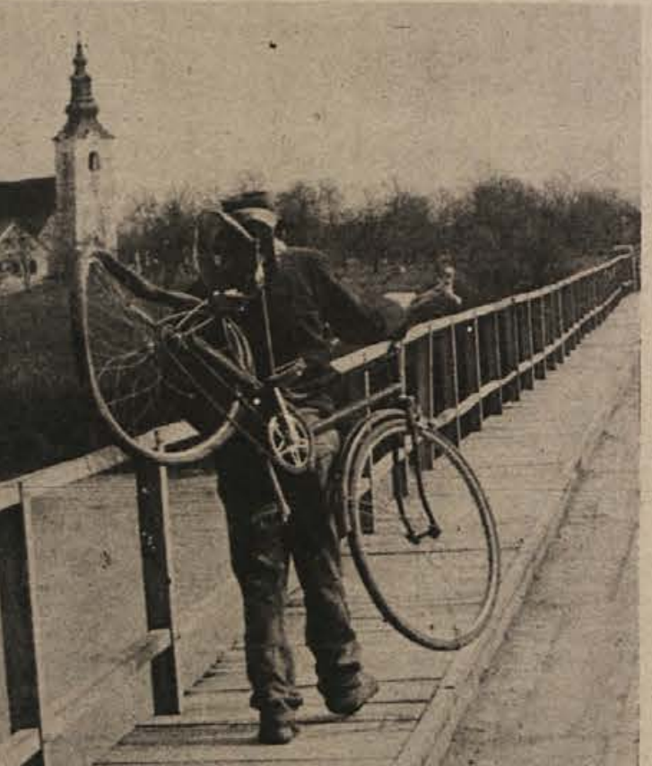
Kot Martin Krpan svojo kobilico, tako je ondan možakar naložil svoje kolo na ramena in se napotil proti domu. Posnetek je z mosta čez Krko v Dobravi. Povejmo pa še, da so kolesarji med pogostnimi povzročitelji prometnih nesreč, posebno na podeželju in zlasti če malo preveč pogledajo v kozarec.

V dnevnem časopisu večkrat beremo, da so bili najdeni pri izvajanju gradbenih del ali pri oranju ali v morju raznovrstni arheološki predmeti (kipi, stare posode, okrasni predmeti, novci), prav tako tudi bere mo v milih oglasih, da so občani izgubili določene vrednostne ali posebno priljubljene predmete in prosijo poštene najditelje, da jih vrnejo proti dobri nagradi. Karko je s temi najdbami, kdo je lastnik teh predmetov, kakšne so pravice in dolžnosti občanov, ki hote ali po naključju pridejo do takih predmetov? Stara pravno in moralno pravilo, izraženo v ljudskem pregovoru „Kar najdeš - ni tvoje“, velja tudi v našem pravnem redu.