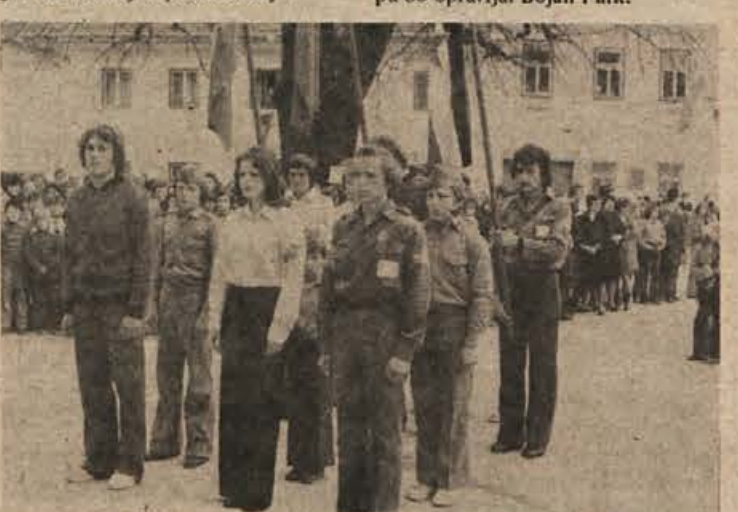
V Žužemberku je pričakalo zvezno in krajevni štafeti mladosti več kot 500 ljudi.