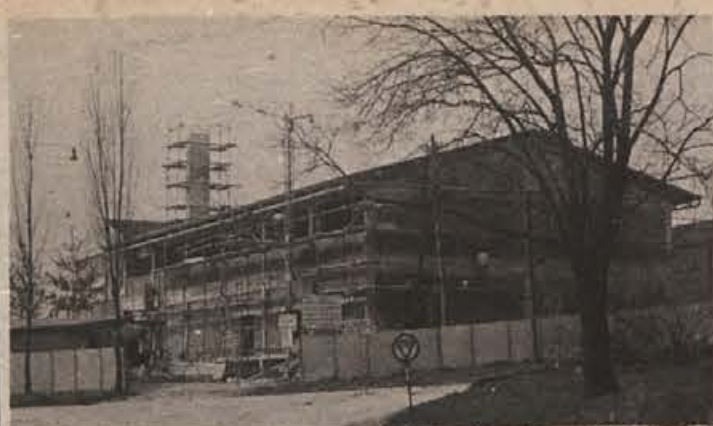
Na sliki sta nova polnilnica in skladišče stekleničenih vin pri Vinski kleti v Metliki. Gradnja objekta se bo zaključila v maju, otvoritev pa bo po vsej verjetnosti v drugi polovici maja. Z novo polnilnico je klet pridobila tudi obrat družbene prehrane in prostor za družbeno dejavnost kolektiva in članstva.