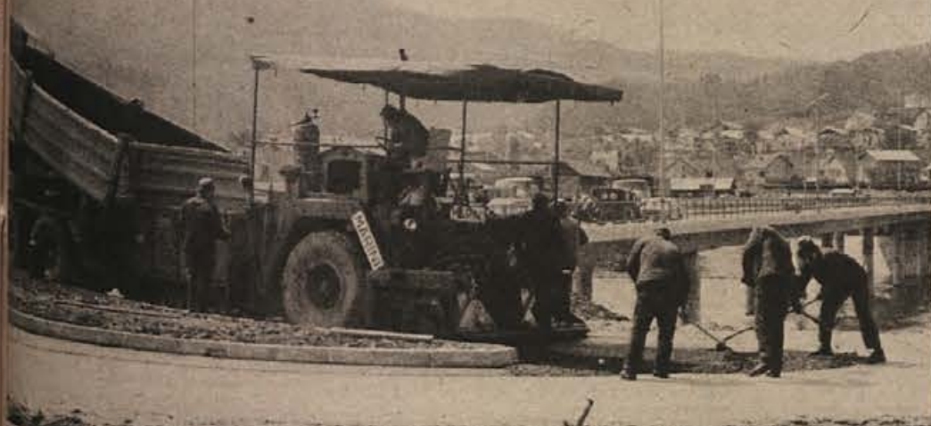
Na novem mostu čez Savo potekajo zaključna dela. Brž ko so bile odprte asfaltne baze, so delavci deljanskega Cestnega podjetja pričeli asfaltirati priključke. Kot pravijo izvajalci del, bo most nared za promet pred 1. majem.