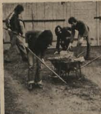
Suhorski otroci so se pred kratkim izkazali z akcijo, ki naj bi zavarovala že tako zamazano okolje. Prav bi bilo, ko bi tudi ostale osnovne šole organizirale očiščevalne akcije, ki naj bi bile stalne. Na sliki: z ene izmed redkih mladinskih očiščevalnih akcij.