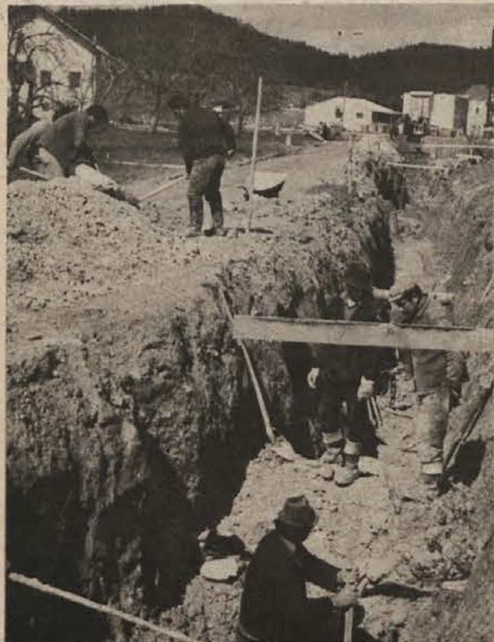
Kanalizacijo za območje od Galanterije do Miheliča oziroma izliva v Bistrico v Sodražici ureja Cestno podjetje Ljubljana. Dolga bo 780 m, veljala pa bo 700.000 din. Krajevna skupnost, ki je sklenila pogodbo za delo, bo ta denar zagotovila iz samoprisevka, prispevka za urejanje mestnega zemljišča, razen tega pa je prispevala še TOZD INLES.