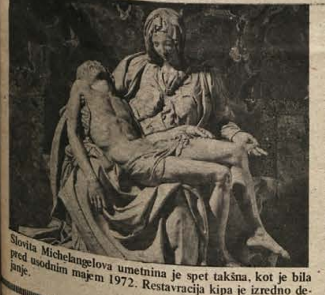
Slovlva Michelangelova umetnina je spet takšna, kot je bila pred usodnim majem 1972. Restavracija kipa je izredno de- janje.

nekaj koščkov še vedno manjkalo. Glavni del posla je bil opravljen v laboratorijih. Najprej so morali odkriti snov, ki bi lahko nadomestila manjkajoče dele kipa, odkriti pa so morali tudi postopek, kako odpraviti modrikaste sledove od barve kladiva, ki je na kipu ostala. Rešitev je bila zelo preprosta. Potem ko je odpovedalo skoraj vsako kemično čistilno sredstvo, je svoje prednosti pokazal navaden selotejp. Za zapolnilno maso pa so vzeli mešanico poliesterke smole in prahu kararskega marmorja. Restavratsko delo je vodil Morresi. Z injekcijsko iglo je ubrizgaval v poprej narejeni kalup manjkajoče dele, ki so jih potem z največjo pazljivostjo zleplili z originalom v kapeli. Celotna ekipa je delala kot dobro izučena skupina kirurgov. Rezultat njihovega dela je bil začudujoč. Prav nič na kipu ni kazalo, da je popravljen. Edino ultravijolična fotografija lahko pokaže, kateri deli so popravljeni in zlepljeni. Za spomin in opomin na barbarsko dejanje so pustili manjšo udrtino na pajčolanu.