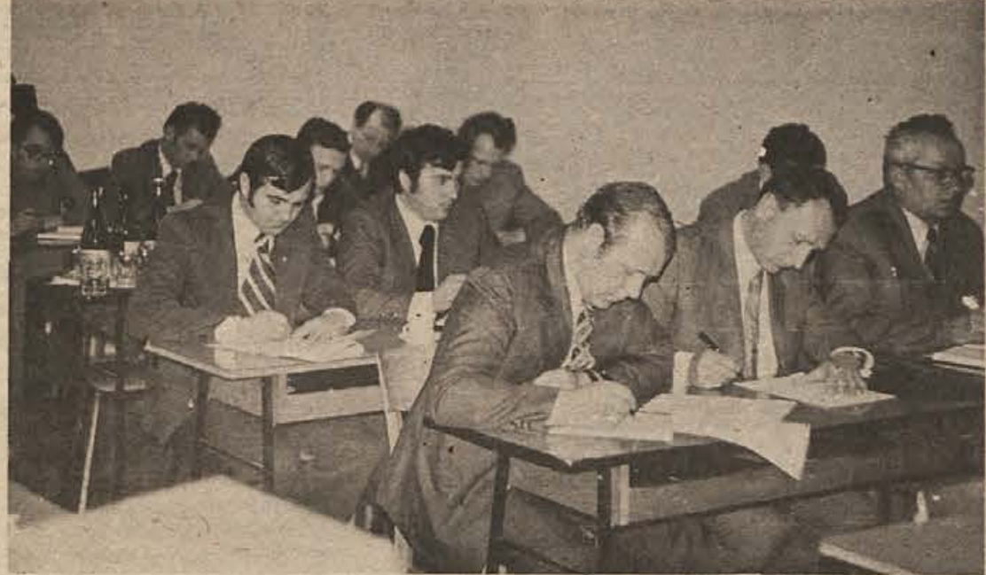
Minuli teden je bil v Novem mestu seminar, na katerem se je več kot 100 predavateljev seznanilo z vsebino seminarjev za usposabljanje poverjenikov sindikalnih skupin in drugih članov izvršnih odborov osnovnih organizacij sindikata.