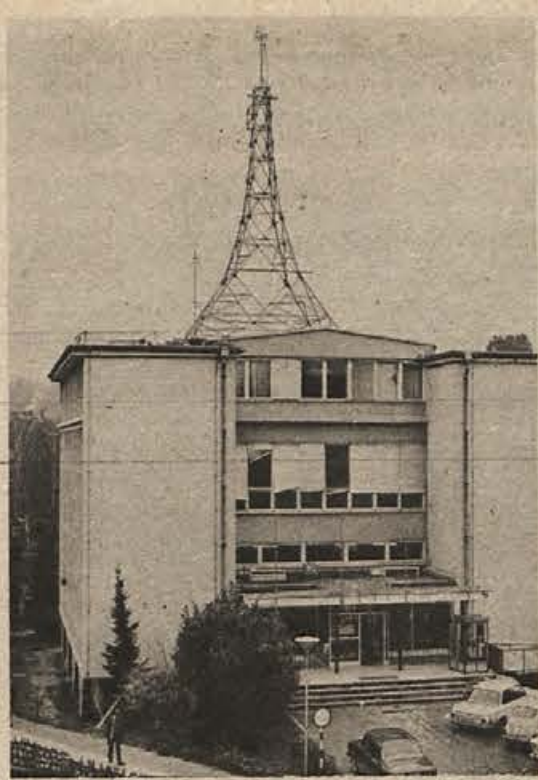
Poslopje PTT podjetja v Novem mestu je višje za 17 metrov: nanj so montirali antenski stolp za UKV telefonske zveze (radio relejne zveze) za medkrajevne telefonske pogovore z Belo krajino. Stolp je izdelalo Ključavničarsko podjetje iz Ljubljane; skupna vrednost investicije znaša 3.450.000 din.