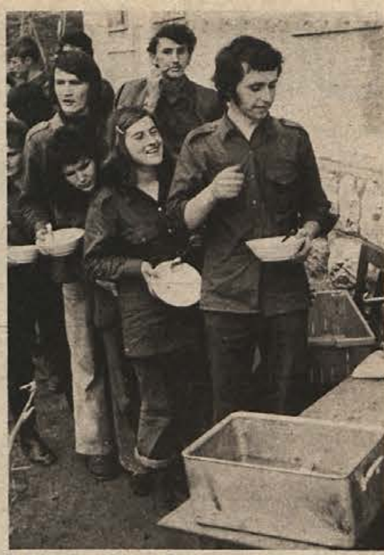
Komisija za mladinske delovne brigade pri OK ZSMS Novo mesto je prejšnjo soboto in nedeljo organizirala na Karteljevem delovno akcijo, ki se je udeležilo 80 mladincev in mladink ter 20 vojakov iz novomeske vojašnice. Na sliki: mladinci čakajo na okusen vojaški pasulj.