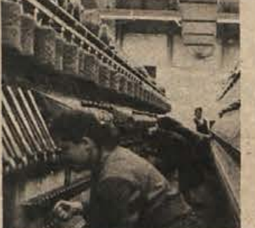
V tekstilni industriji je še največ nočnega dela žensk. Posnetek je iz Novoteksa

Ta prizadevanja so že pripeljala do sprememb. Restriktivna politika pri izdaji dovoljenj za nočno delo žensk in preverjanje 5-letnega programa za postopno ukinitje nočnega dela vsake DO, ki je prošila za to dovoljenje, je prineslo zmanjšanje nočnega dela žensk in popolno ukinitje nočnega dela mladoletnikov.