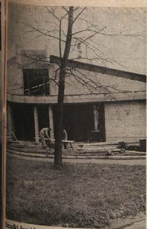
Stradki lesni kombinat Novoles bo, kot zagotavlja zavajalec del Novograd iz Novega mesta, do 1. maja dobil nov obrat družbene prehrane, ki bo imel 800 kvadratnih metrov koristne površine. Predračunska vrednost del je 2,18 milijona dinarjev.