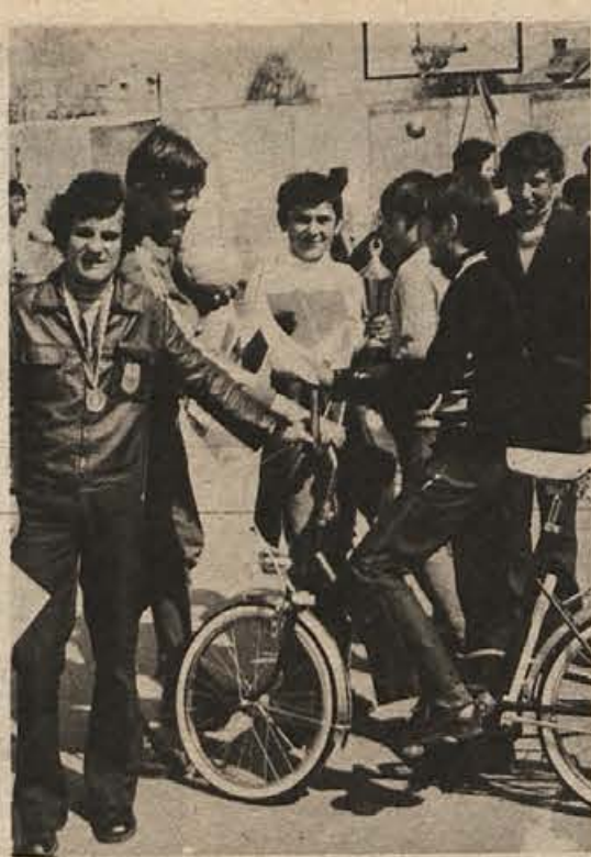
S sobotnega tekmovanja „Kaj veš o prometu“ v Brežicah. Sodelovalo je osem šol in vsaka je prešla za nagrado novo kolo. Največ pozitivnih točk je osvojila ekipa iz Artič, ki jo vidite na sliki. V soboto čaka ekipo brežiške občine preizkušnja v Novem mestu.