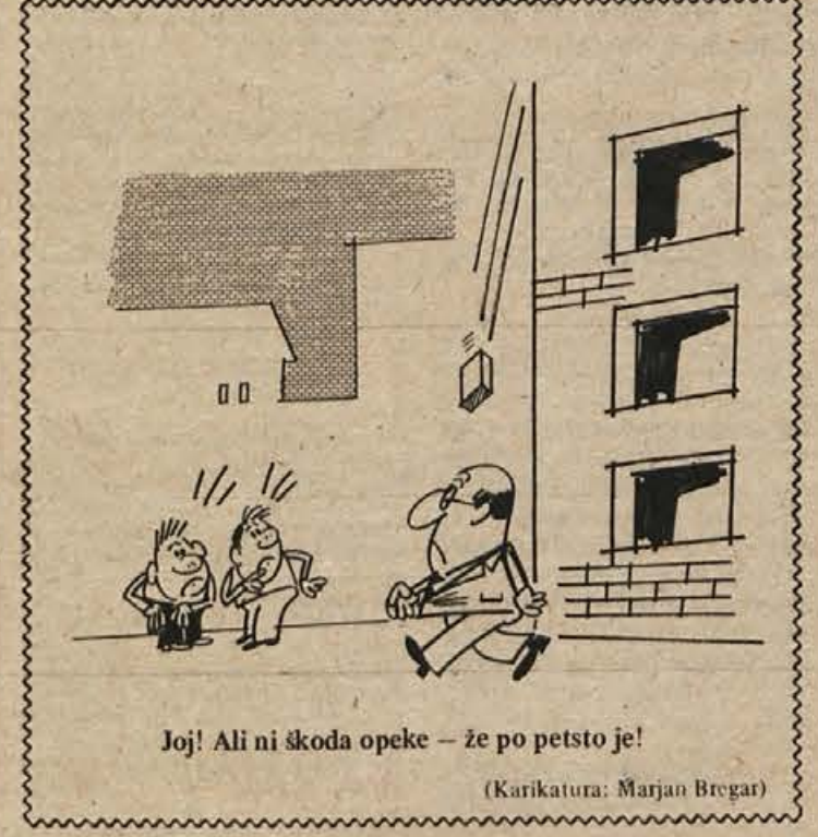
Jo! Ali ni škoda opeke – že po petsto je!