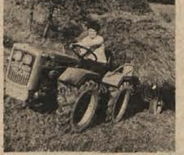
Poudarek na Gorenjskem sejm: kmetijski stroji

Od 11. do 20. aprila bo v Kranju 14. mednarodni spomladanski kine-