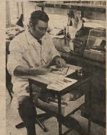
V Krkinem inštitutu: seciranje podgane

Znanstveno-raziskovalna dejavnost inštituta novomeske „Krke“ je dobro znana v Jugoslaviji in v svetu, predvsem v vrsti držav vzhodne in zahodne Evrope. Znanstveniki in raziskovalci te znane tovarne zdravil že daljša sodelujejo z inštituti in laboratoriji v Ljubljani in nekaterih drugih krajih pri nas in z ustreznimi ustanovami v Čehoslovaški, Sovjetski zvezi, na Madžarskem, Nizozemskem in v drugih državah.