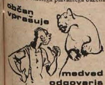
Na Trati se nekateri jezijo, da povzročajo kure veliko skodlo.

BAZEN IN TELOVADNICA - Gradnja pokritega plavalnega bazena