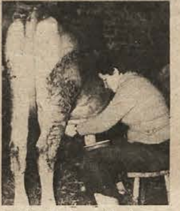
Izboljšanje domačih krav z ameriško „krvjo“

zelo izboljšali. Razen že naštetih ima ameriško rjavo govedo še nekatere, tudi pozornosti vredne lastnosti: lažje porode, večjo rastnost, dolgo rast in veliko končno težo ter trdne noge in parklje.