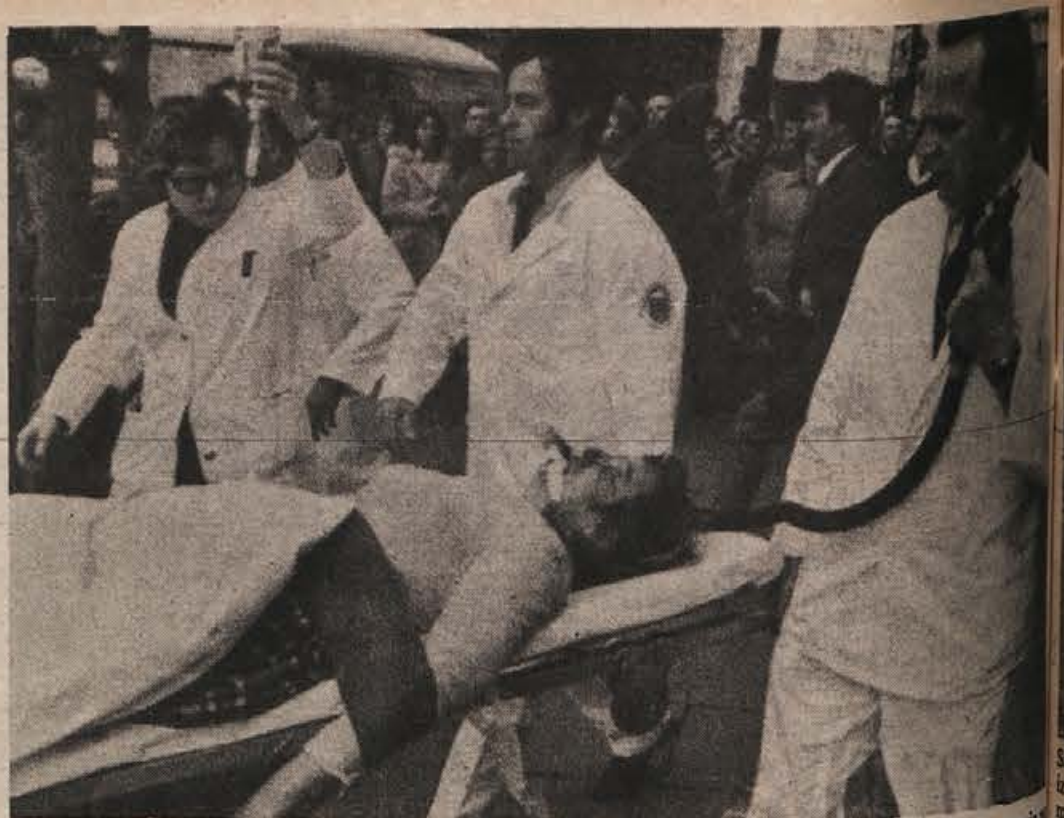
HAMBURG — Tukaj se je nenadoma nekemu moškemu zmešalo, pa je začel streljati iz revolvice. Eni izmed najbolj prometnih mestnih ulic. Šest oseb je bilo ranjenih, ena med njimi pa je ranam podlegla. Na sliki: ena izmed žrtev napada blazneža.

Vseh kmetijskih zemljišč ni moč zaščititi le tako, da se večje kmetije, na katerih gospodarji že imajo naslednike, obvaruje pred delitvijo. Načrtovati bo treba obdelavo kmetijske zemlje tudi manjših, opuščanih kmetij. Neobdelano bi bilo treba dodeljevati drugim kmetom, če je kmetijska organizacija ne bo marala obdelovati sama. Predvideti je treba, koliko kmetij bi bilo potrebnih v naselju ali vasi, da bi lahko prevzemale v obdelovanje vso zemljo, ki bi z leti ostala neobdelana. To pa je veliko