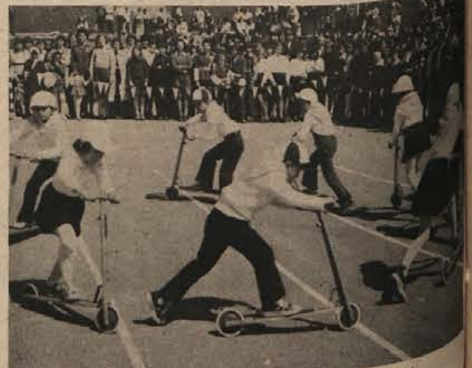
Prometna vzgoja se začne v otroškem vrtcu.

Elektrarna v Brestanici nima urejenega pretakališča. Dovož goriva po cesti je problematičen, zato si prizadevajo, da bi našli za zgraditev pretakališča tehnološko najprimernejšo in ne predrago varianto. Menijo, da bi jim najbolj ustrezalo pretakališče ob elektrarni z železniškim priključkom. To bi omogočalo dovoz vseh vrst goriva.