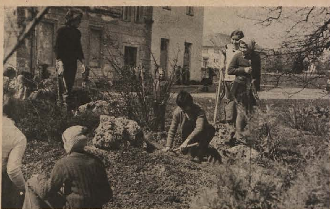
Člani hortikulturnega krožka v osnovni šoli v Artičah prizadevno urejajo nasade cvetja in okrasnega grmičja ob šoli.

V Krškem je bilo v ponedeljek, 7. aprila, občinsko tekmovanje „Kaj veš o prometu“. Boljši mladi kolesarji bodo bolj pokazali znanje in sposobnost na področnem tekmovanju v Novem mestu. Pripravljeno je dobro, zato upajo, da se jim bo težko uvrstiti na vrh lestvice.