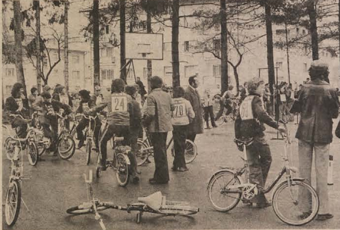
Na novomeškem občinskem šolskem prometnem tekmovanju so se najbolje izkazali Sentjernečani, ki so dobili pokal v trajno last. Posnetek je z igrišča za grmsko šolo, kjer so kolesarji nabirali spretnostne točke.

Pogojno se lahko odloži le izvršitev kazni zapora in denarne kazni, torej kazni za lažja kazniv dejanja. Če pa sodišče obsodi storilca na kazen zapora in na denarno kazn, sme pogojno odložiti izvršitev obeh kazni ali