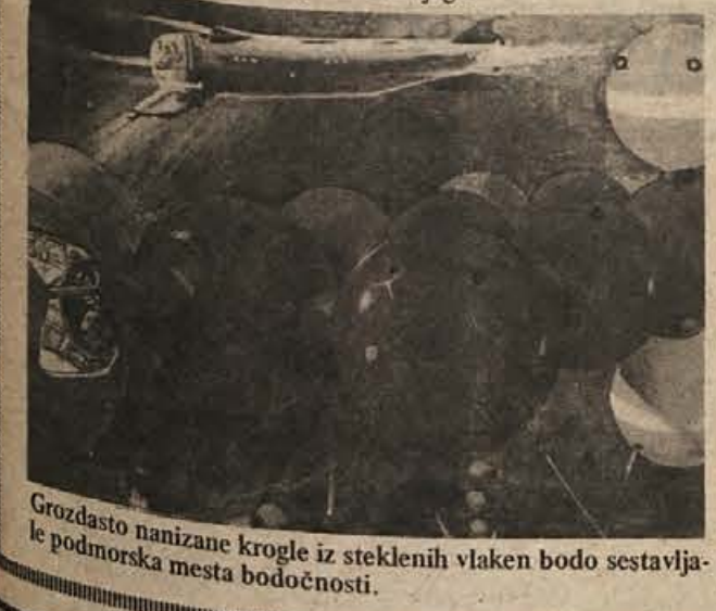
Grozdasto nanizane krogle iz steklenih vlaken bodo sestavljale podmorska mesta bodočnosti.

Fturologi menijo, da bo človek pričel intenzivno naseljevati morskno dno že v sedanjem stoletju. Svoje trditve opirajo na celo vrsto uspešnih poskusov, ki so jih opravile številne države. Izdelan je celo prototip različnih podmorskih baz, podmorskih prevoznih sredstev, strojev za kopanje rud in transportne naprave, ki naj bi izkoristile moč vodnega vzgona.