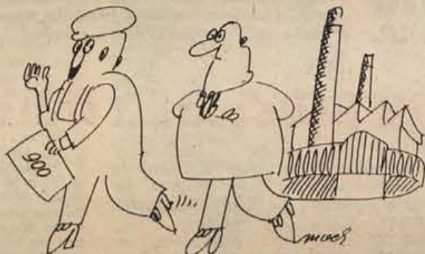
– Morda imam res zgodovinsko vlogo, toda s temi dohodki si lahko ogledam le zgodovinski muzej.