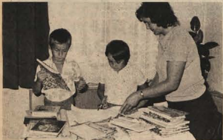
Samo še letos bo mamica pomagala.

Fotoreportažo pripravila in uredila: SANDI MIKULAN IN MILAN MARKELJ