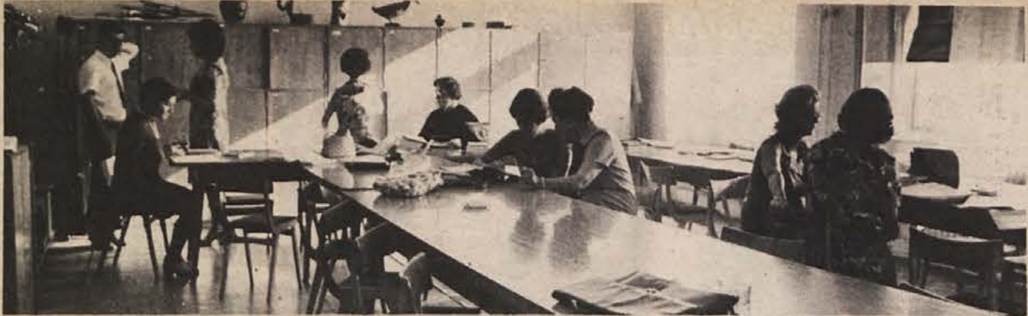
Kar precej se nas je zbralo, učiteljev in profesorjev, ampak nekaj stolov je še praznih. Ne bo nikogar, da sede nanje?