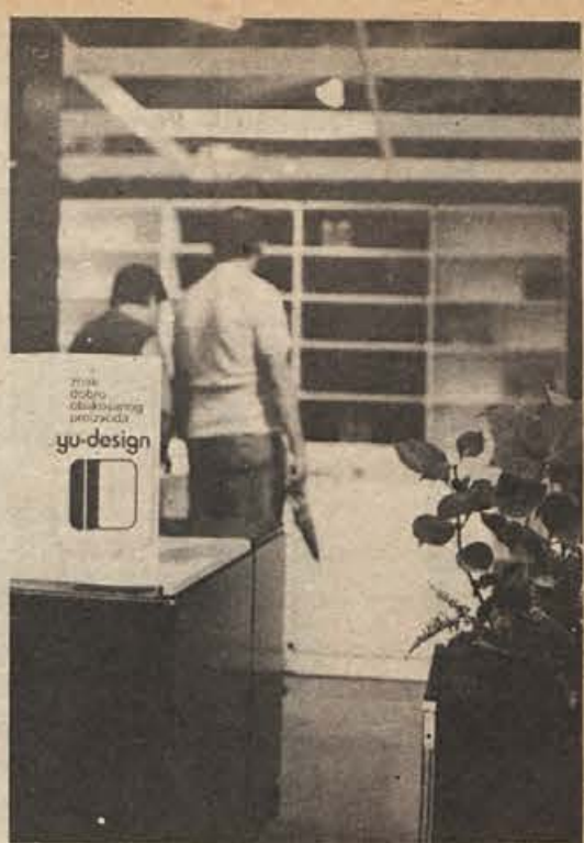
Za bližnji praznik sevnjske občine bodo v Krme-lju odprli nove proizvodne prostore obrata LISCE. Delavke LISCE so torej po 10 letih prišle do strehe, kovinarji pa še ne. Na sliki: v teku so zadnja obrtniška dela.