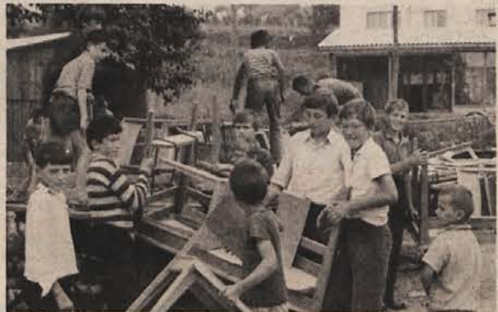
Pri opremljanju šole pridejo prav tudi pridne roke učencev.