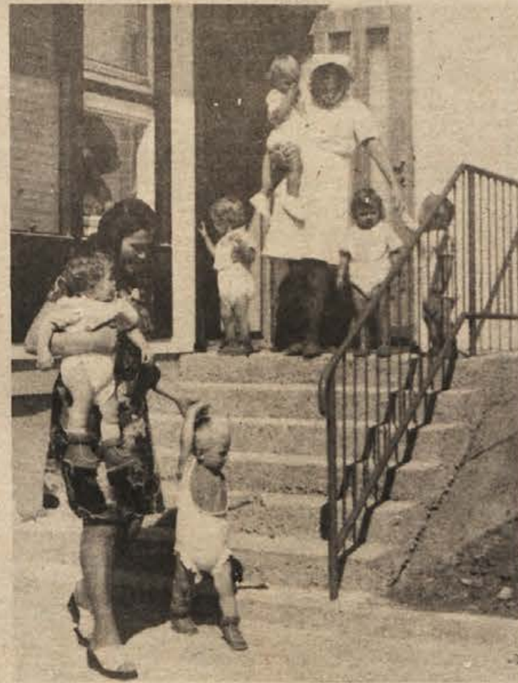
Za njihovo brezskrbnost morajo poskrbeti odrasli. Na sliki: otroci v novem vrtcu na Ljubljanski cesti.

gamo samo z eno garsonjeto, ki smo jo kupili iz lastnih sredstev. Upamo,