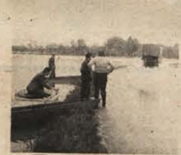
Prej poplava, zdaj suša: kriza ni le trenutna

Republiški izvršni svet je, kot pravi sporočilo, ki smo ga prejeli, ugotovil, da manjka električne energije predvsem zaradi manjše proizvodnje. Energije je manj zaradi daljše