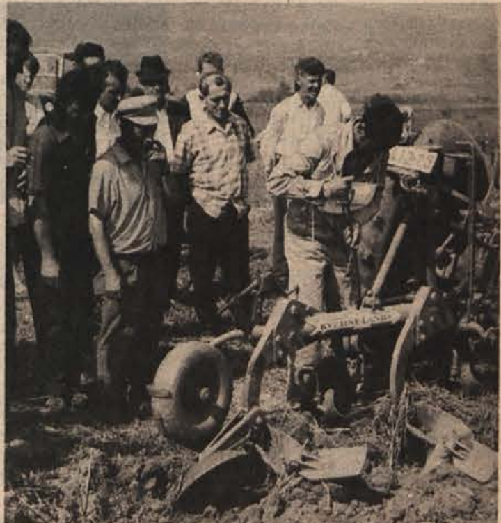
Traktoristi so se pomerili v spretnostni vožnji, oranju ter v teoretičnem znanju. Tekmovanje je priredila kmetijska tehniška komisija pri Zvezi organizacij za tehnično kulturo Slovenije.

Do konca tedna pričakujemo deloma sončno, postopoma toplejšje vreme. Večjih padavin ne bo.