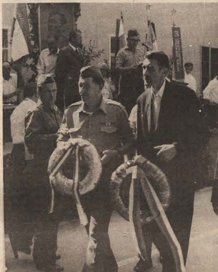
Po izmenjavi listin o pobratenju sta predstavnika krajevnih organizacij ZB Dolenjske Toplice in Hrastnika skupno položila venca na spomenik padlih borcev.

Govorec o TOZD, je gost podčrtal, da gre pri tem za integracijo sredstev in dela. Brez tega v našem tržnem gospodarstvu ni možen napredek. Uvajanje TOZD ni dezintegracija, Zveza komunistov ima pri odpravljanju takega mišljenja veliko dela. TOZD je pravica in dolžnost delavcev, dolžnost zato, ker bi sicer ne mogel delovati sistem, ki ga usta-