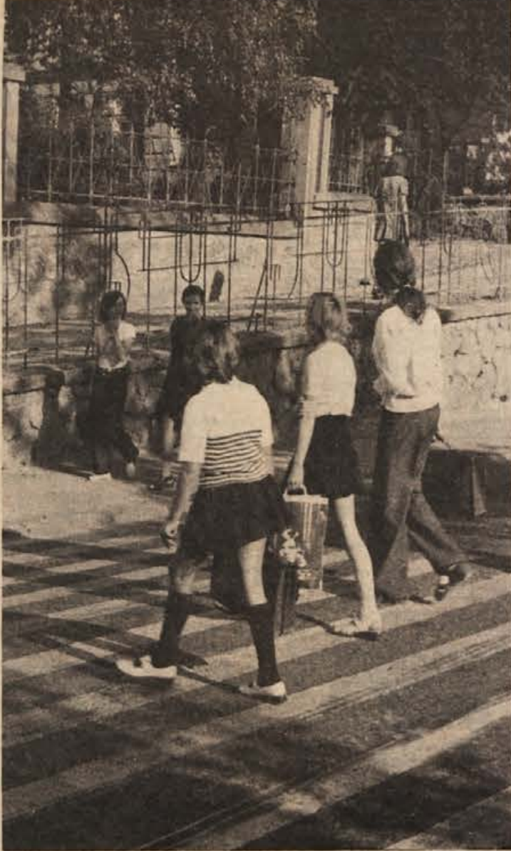
Sole so odprle vrata in otroci so spet izpostavljeni novim nevarnostim. Ni odveč, če jim v šoli in doma vsak dan ponavljamo, kako morajo čez cesto in kako naj se vedejo na poti domov. Ne pozabimo, da je običajno september mesec „črnih rekordov“, v katerem na cesti tonejo otroška življenja.