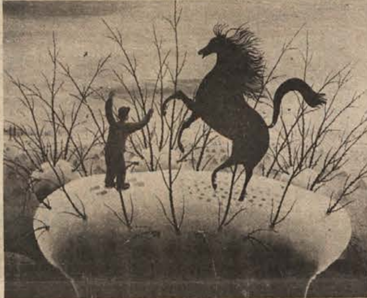
Petar Grgec: DEČEK IN KONJ, olje na steklu (40x50 cm), 1973