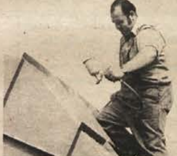
V Ribnici manj izgubljenih delovnih dni kot v sosednjem Kočevju.

delavnikov je zaradi nesreč pri delu in zaradi poklicnih bolezni. Kočevska in ribniška občina sta na tem področju presegli republiško povprečje, kar pa ima, kot ugotavlja tudi bilten, korenine v manjši razvitosti ter slabši socialni in gospodarski strukturi območij.