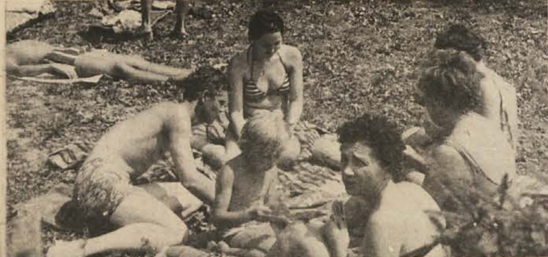
Ob Krki in v Čateških Toplicah je bilo drugo nedeljo v septembru malone več kopalcev kot sredi poletja. Kako tudi ne, saj je živo srebro poskočilo na 30 stpjin C. V čateških bazenih vodo že drugi teden močneje klorirajo. Ta varnostni ukrep so vpeljali, ko se je v Italiji pojavila kolera.