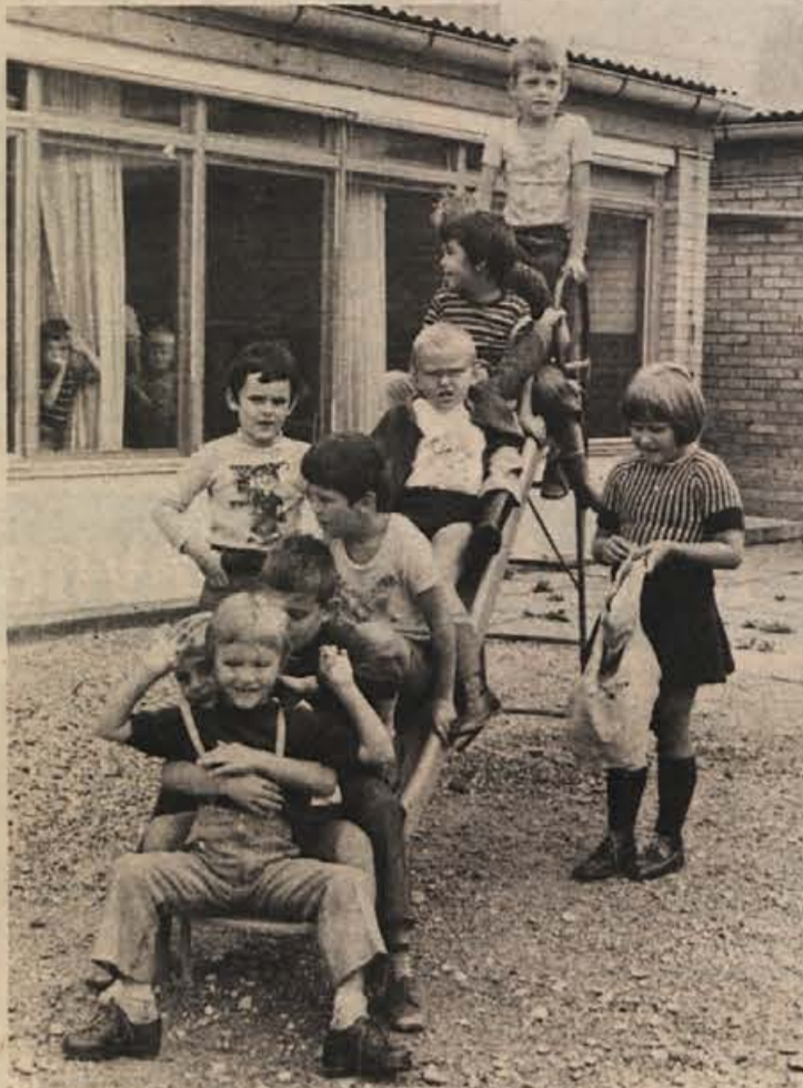
Nič več igranja! Čaka nas mala šola, ki, čeravno ni „ta prava“, že zahteva resne ljudi.

Eden med njimi je preizkušanje zrelosti šolskih novincev. Ta ukrep vsekakor do neke mere pove, ali so otroci za osnovno šolo dovolj zreli ali ne. Spoznanje o otrokovih zmognostih pa nam omogoči lahko nekatere druge ukrepe: za osnovno šolo nesposobne otroke lahko usmerimo po dodatnih preizkušnjah v posebne šole, na drugi strani pa lahko odložimo vpis v prvi razred otroku, katerega zrelost še ni dosegla tiste stopnje, ki jo zahtevamo za uspešno sodelovanje v šoli. Oba ukrepa imata predvsem namen olajšati delo učencem. Pa vendar usmerjanje otrok v posebne šole, kjer otroka poučujejo za to posebej usposobljeni učitelji, ne gre tako gladko. Posebnih šol nimamo veliko, tudi še ni dovolj specializiranih učiteljev, primanjkuje tudi denarja za vzdrževanje otroka v posebni šoli, če je otrok oddaljen od take šole. Vendar pa tudi tam, kjer take šole obstajajo, nekateri starši ne dajo svojih otrok vanje, temveč vztrajajo, naj njihov otrok obiskuje normalno osnovno šolo. V njej pa doživlja neuspeh za neuspehom. Prav gotovo to ni ustrežna pot k otrokovi sreči. V času, ko