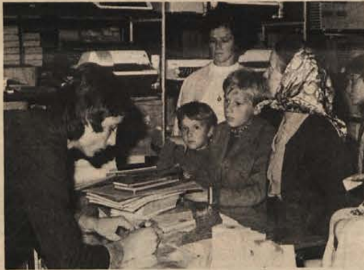
Kup potrebnih zvezkov in knjig raste, z njim pa tudi račun.