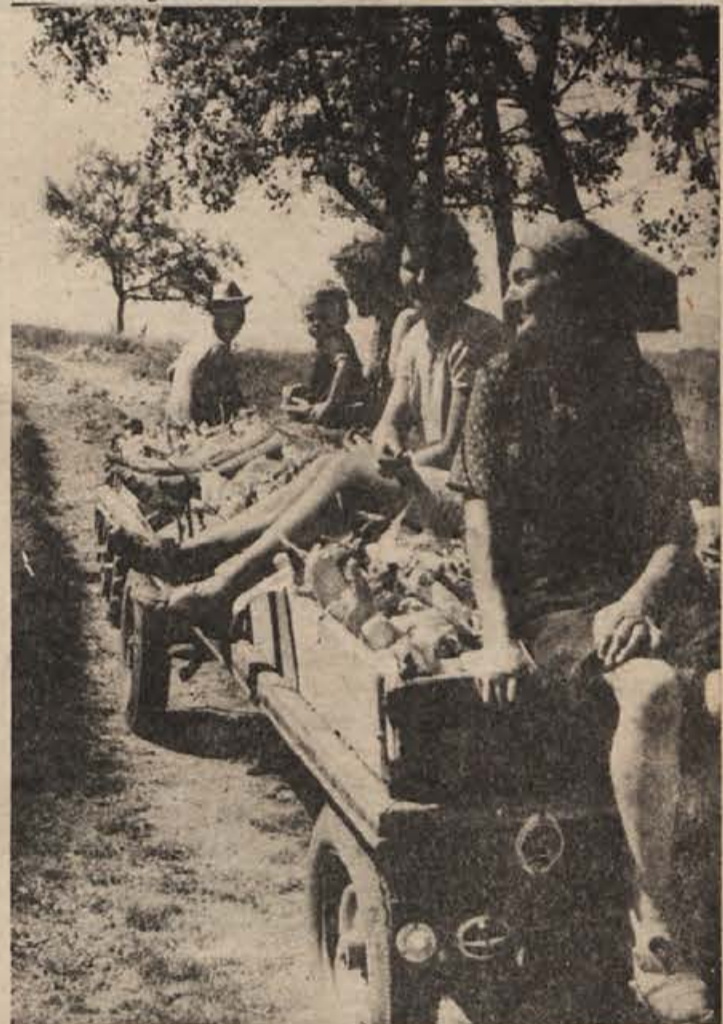
Šukljeto iz Bereče vasi 17. so prejšnji teden z njive pospravljali koruzo. Vsa družina je delala in zadovoljnih obrazov so se peljali domov, kajti letina je letos dobra.

200 din za učence prvih letnikov in 250 din za drugošolce.