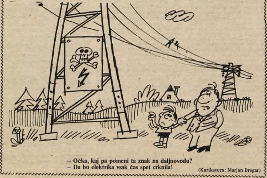
— Očka, kaj pa pomeni ta znak na daljnovodu? — Da bo elektrika vsak čas spet crknila!

splošne suše in nizkega vodnega stanja ter zakasnelih popravil v termoelektrarnah.