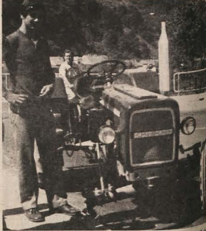
Smola pa taka! Še dobro, da se je vse skupaj srečno končalo. Traktor iz Zalk se je 4. septembra brez skrbi peljal s svojim traktorjem čez savski most v Krškem. Nenadoma je počilo. Odlomilo in odkotalilo se je desno sprednje kolo in vozilo je zaneslo v pločnik. Traktor znamke URSSU je star leto dni, kupili pa so ga v trgovini Agrokombinata v Krškem.