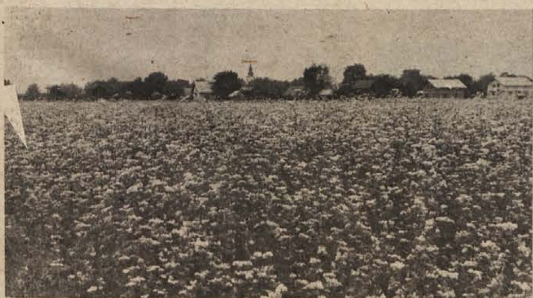
A j d a m e d i — ajdovih žganecv pozimi ne bi smelo manjkati v naših krajih! Po Krškem polju, pa tudi v mnogih vaseh trebanjske občine in v Beli krajini so je precej posejali. Na sliki: prostorni posevki ajde med Sentjernejem in Prekopo.