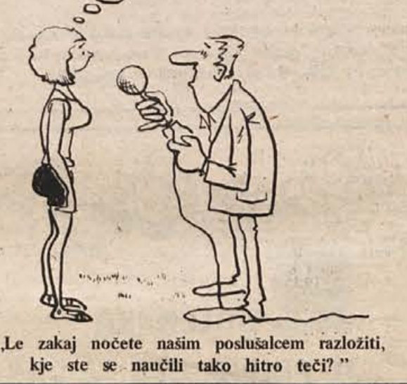
„Le zakaj nočete našim poslušalcem razložiti, kje ste se naučili tako hitro teči?“