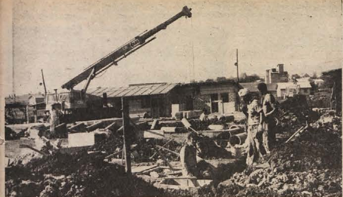
Novi industrijski predel Črnolija nastaja pri vhodu v mesto iz metliške strani. Tu gradi semiška ISKRA svoj obrat, obrtno komunalno podjetje zida poslovni objekt, podjetje VIATOR pa mehanične delavnice. Tako velikega gradbišča doslej v Črnoliju še niso imeli.