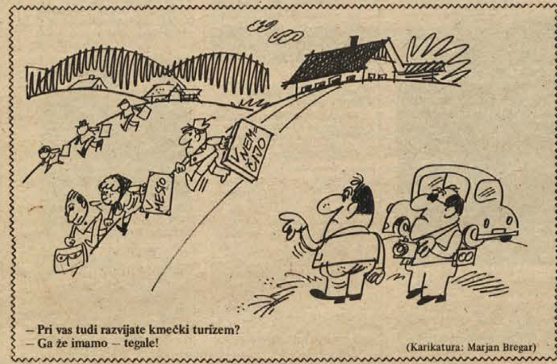
— Pri vas tudi razvijate kmečki turizem? — Ga že imamo — tegale!