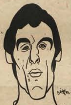
Sevnico čaka trdo delo – Šilc

Ribnica: Lovšin, Abram, Žuk, I. Kersnič 3, Matelič 3, Mikulin 10, Andoljšek, Radič 1, Ponikvar 1, Kersnič 2.