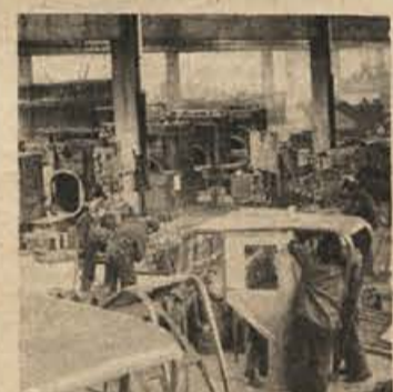
Ribniški RIKO, eden največjih izdelovalcev letalske opreme v Evropi

Kajpak je pomembno, da čimveč ljudi začuti, da s starimi odnosi ne gre več. Tudi izven ZK je vrsta ljudi, ki so prav tako goreči za samoupravljanje — in tudi na te se je potrebno nasloniti. Seveda pri tem ne gre prezreti, da ljudje nočejo biti več samo poslušalci in izvajalci politike, ampak hočejo to politiko sooblikovati.