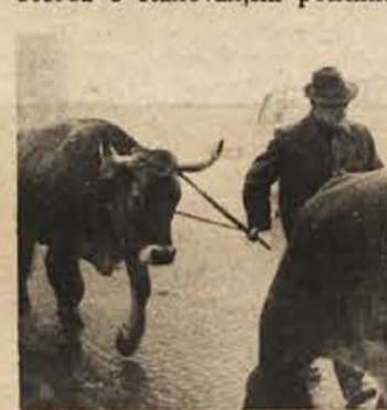
Kmetija s poldrugo glavo goveda?