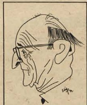
Volja in znanje!

Fizično močnejše domačinke so s prodori že v začetku povedle, potem pa so prednost spretno branile do konca, čeprav je bila tekma od časa do časa groba. Varaždinke so se s to zmago prebile na četrto mesto, Brežičanke pa so ostale na osmem. Brežičanke so vodile le ob začetku – 4:2, od takrat naprej pa so morale loviti zaostanek.