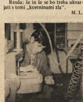
Korak dalje: delavci — sooblikovalci politike