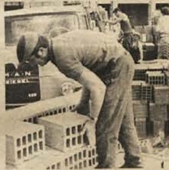
Akcija za graditev stanovanj je obtičala