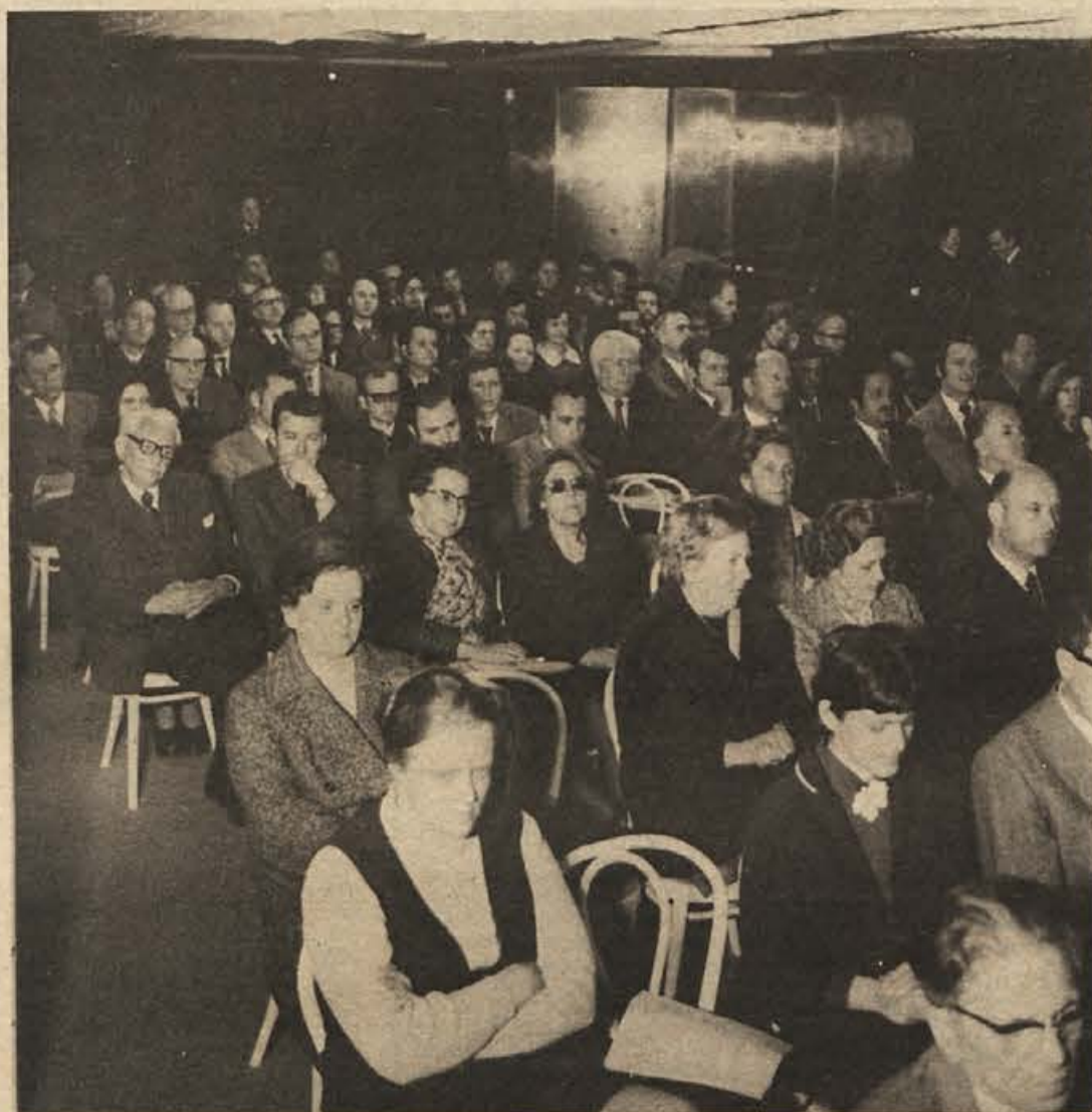
Otočec: slovenski zdravniki zborujejo