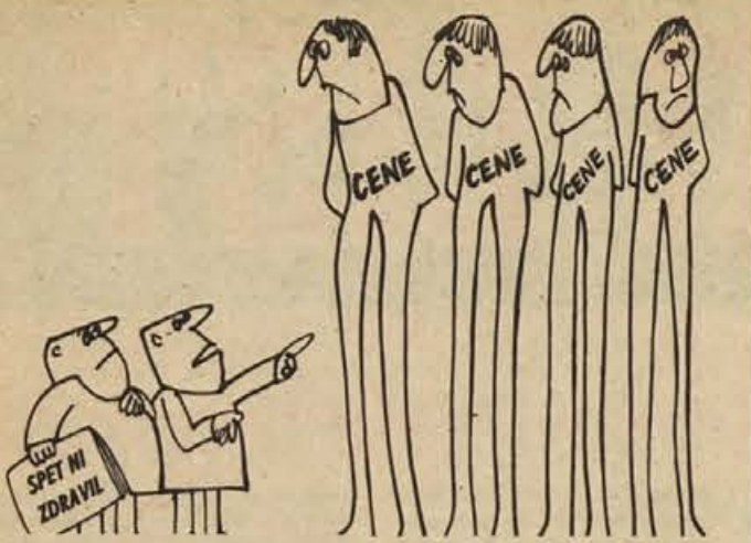
Tudi zdravil proti njihovi pretirani rasti nam primanjkuje...! Karikatura: Ivo Antič (Delavska enotnost)