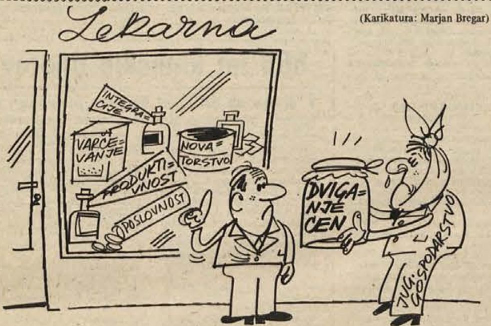
Da, vem za razna zdravila, ampak jaz vse težave zdravim s temle kefirjem ...!