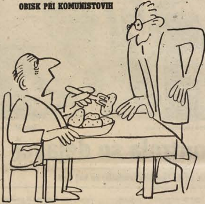
— Ze od vojne dalje sem vsak petek demonstrativno jedel meso, letos me pa še oblast sili k postu!