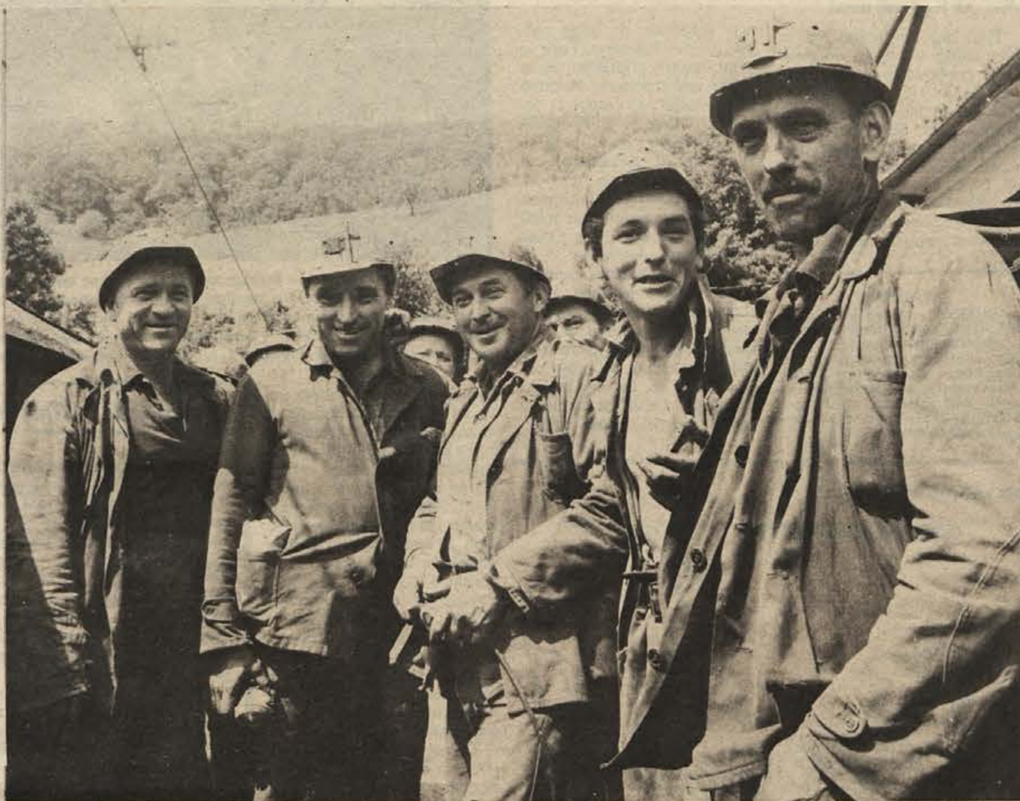
Senovski rudarji pred vhomom v jamo

RIBNICA — Na današnji svečani zaobljubi novih vojakov bo sta prisostvovali tudi delegaciji učencev osnovne šole Kočevje in Ribnica.