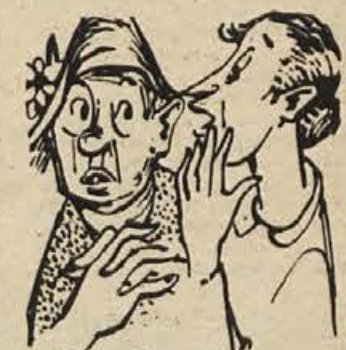
— Ena gospa je rekla, da na pogrebni službi lepo prosijo ljudi, naj umirajo, sicer bodo prišli na boben. Ze dva tedna niso imeli nobenega pogreba...

SPET BREZ POGREBOV — Prejšnji teden pogrebna služba spet