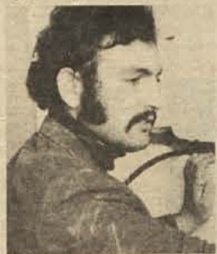
To je že velik napredek, ni pa še dovolj. Prizadevali si bomo, da bo delavce začutili, da on razpolaga z denarjem, ki ga ustvarijo. R. B.

NA RAZSTAVI UČIL — Tudi metliški prosvetni delavci so si ogledali razstavo učil v Ljubljani. Z ogledom so bili zelo zadovoljni in pričakovati je, da se bo marsikatero novo in najsodobnejše učilo znašlo v naših šolah.