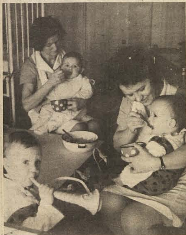
Mali nebogljenčki so v sodobno urejeni varstveni ustanovi v Črnomlju (na sliki) v najboljših rokah med tem, ko so mamice v službi. Lahko trdimo, da je otroško varstvo v mestu zadnje leto izredno napredovalo, obstaja pa tudi trdno upanje, da bo glede tega napredek še na podeželju. Prvi bo na vrsti za gradnjo novega vrta Semič.

Dobravičani bodo tudi letos metliško občino zastopali na republiškem tekmovanju, ki bo tokrat v Murski Soboti. Želimo jim kar največ uspeha!