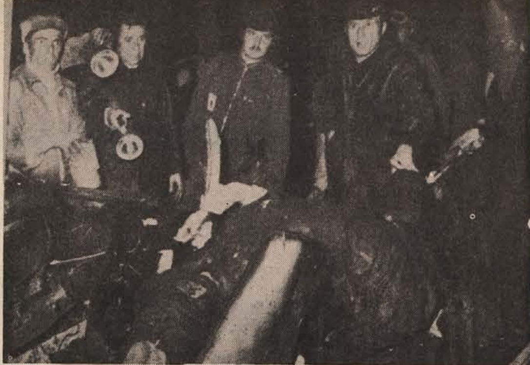
ARLES (Južna Francija) – Pravkar minuli prazniki so terjali malone po vsem svetu hud krvni davek, saj od vsepovsod poročajo o številnih prometnih nesrečah. Menijo, da je izgubilo življenje več kot tisoč ljudi, več kot deset tisoč pa jih je ranjenih. Na sliki: prizor po prometni nesreči blizu južnofrancoskega mesta Arlesa, kjer je v razbitinah dveh vozil našlo smrt devet ljudi, štirje pa se v bolnišnici še vedno borijo za življenje. Previdnosti na cesti ni nikoli odveč!

Zakaj se zastopniki republik in avtonomnih pokrajin, ki se dogovarjajo o usklajitvi razvoja kmetijstva in ureditvi perečih vprašanj tako težko sporazumevajo? Vsi trdijo, da imajo oni prav, drugi pa da tega nočejo upoštevati. Čeprav se ne dogovarjajo kmetje, ampak »zobra-