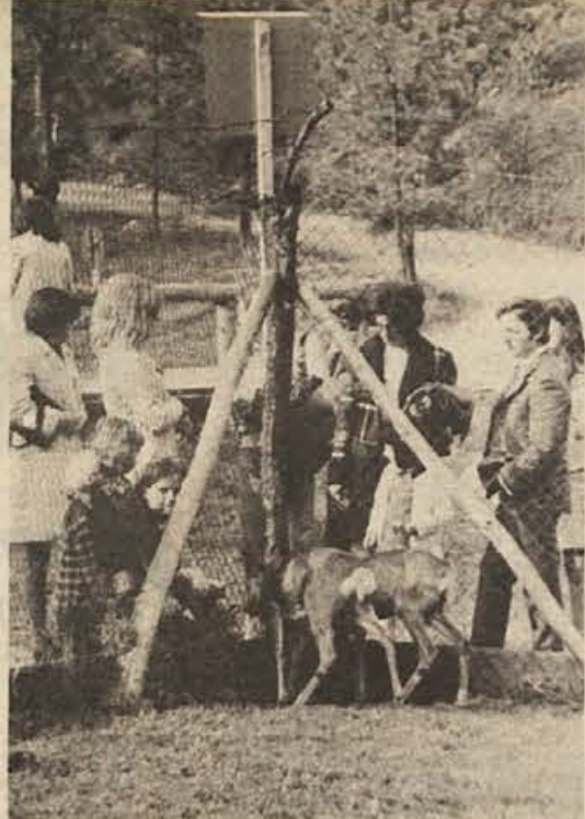
Topli spomladanski dnevi že privabljajo izletnike v Smarješke Toplice. Med tem, ko otroci nabirajo cvetje in se ustavljajo pri ogradi s srnami, pa si odrasli ogledujejo veliki bazen, katerega otvoritev bo za prvi maj. Se ve, za najbolj vroče.