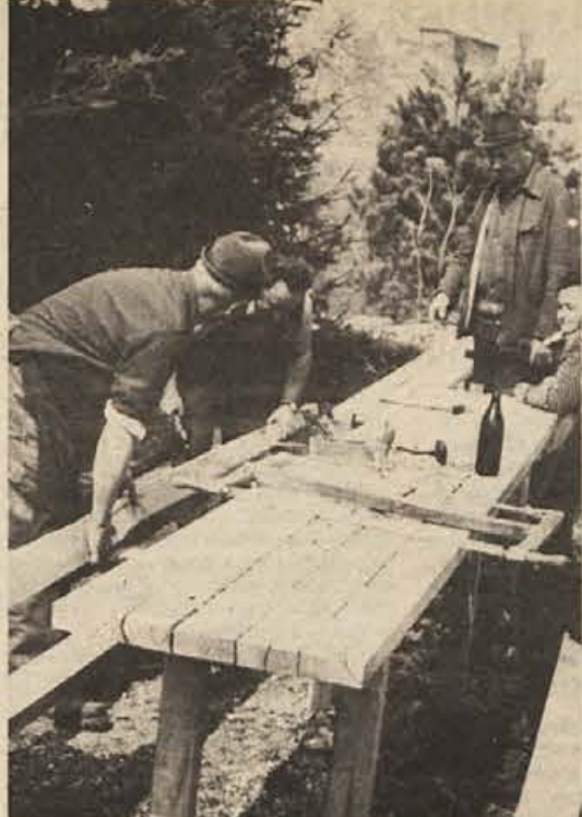
Lovci tudi mizarji! Takole so člani lovske družine Boštjan postavljali lične klopi in mize okrog svojega doma na Brezovici nad Bošnjem. Lovski dom bo odprt tudi za goste 1. maja, poslej pa še vsako nedeljo.