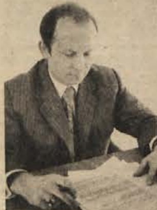
novjšimi teoretičnimi spoznanji. Zato je imel občinski sindikalni svet že v preteklosti lepe uspehe s prirejanjem raznih šol za delovodje in druge.“

„Vsako jesen se zbirajo prijave za večerno osemletko. Zanimanje je, žal, slabo. Je pa zanimanje za izobraževanje na delovnem mestu, npr. za lesno tehniško šolo, sedaj tudi za tekstilno. Marsikdo želi praktične izkušnje z delovnega mesta obogatiti še z