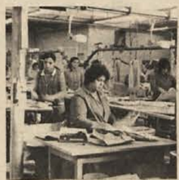
„Labod“: Povrniti „minulo delo“, toda kako?

Predlog novega zakona ne predvideva tovrstnih oprostitev, četudi bi bile za kmetijstvo in narodno gospodarstvo lahko zelo koristne.