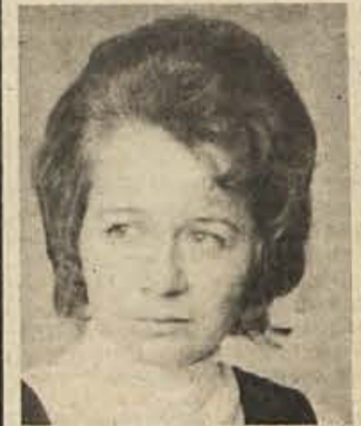
„Mislim, da bomo morali kandidate za nove člane poiskati zlasti med mladino,“ meni namestnica stopiškega sekretarja.

Od jeseni se stopiški komunisti spet redneje sestajajo. Akcijskega načrta še nimajo, vendar vedo, kje bodo poprijeli: v krajevni skupnosti in pri mladini. Tu najprej, žuli pa jih še kup problemov.