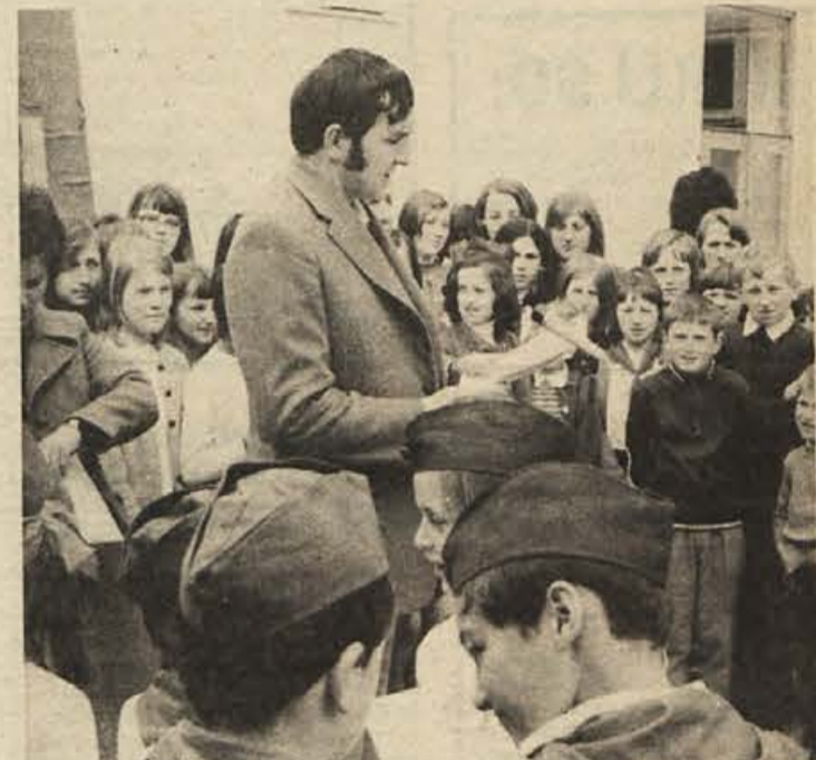
Kurirčkovo pošto so lepo sprejeli v vseh večjih krajih novomeške občine. V Mirni peči, od koder je tale posnetek, so ji pripravili kulturni spored. Hkrati so podelili bralne značke, priznanja za uspehe v veseli šoli in disciplini v razredu.

Na referendumu 6. maja bodo naši prebivalci spet polnili glasovalne skrinjice. Samopriskpevek, ki ga predlagamo, bi plačevali po enakih stopnjah kot do zdaj: za nadaljnje vzdrževanje poti, obnovo oziroma razširitev nekaterih poti ter za vodovode. Računam, da bomo spet vsi složni,“ meni predsednik mirnopske krajevne skupnosti.