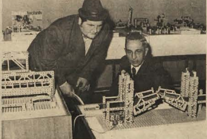
Nekateri učitelji osnovne šole Kočevje so si ogledali nedavno razstavo učil v Ljubljani, posebno se sestavljenko „Fischertechnik“, ki bi jo lahko s pridom uporabljali pri tehničnem pouku in prometni vzgoji. Nanjo je učitelje opozoril svet za preventivo in vzgojo v cestnem prometu pri občinski skupščini, ki je pripravljen pri njenem nakupu šoli denarno pomagati

Ob vsem naštetem moramo razumeti, da ni pametno investirati vsako leto v vseh krajevnih skupnostih ali celo vsakemu lastniku gozda. Nujno je treba kolobariti. Ob zaključku naj poudarim, da lahko trdimo, da take denarne pomoči ne bi lastnikom gozdov na našem območju nudila nobena druga delovna organizacija.“ J. P.