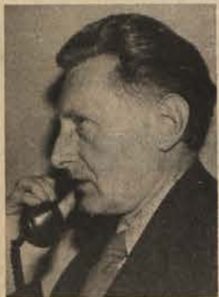
„Veče in srednje delovne organizacije so si uredile svoje počitniške domove. Njihova zmo-

gljivost zadostuje tudi za potrebe tistih manjših delovnih in drugih organizacij, ki nimajo svojih domov. Težave so le, ker želijo izkoristiti vsi dopust od 15. julija do 15. avgusta. Nekatera podjetja so se odločila tudi za nakup kamping prikolic, da niso vezani na dopust vedno v istem kraju.“