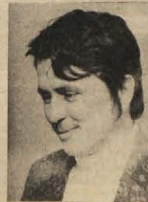
zunanjetrgovinsko poslovanje, PEKO pa komercialne posele (nabava in prodaja) na območju Jugoslavije.“

Nejasno je le še, če je taka skupnost lahko sestavljena iz podjetij, ki imajo tako različne dejavnosti. Vendar naj poudarim, da imamo z njimi precej skupnega, in sicer: EURO-TRANS nam prevaža naše proizvode, TEHNOIMPEX vodi naše