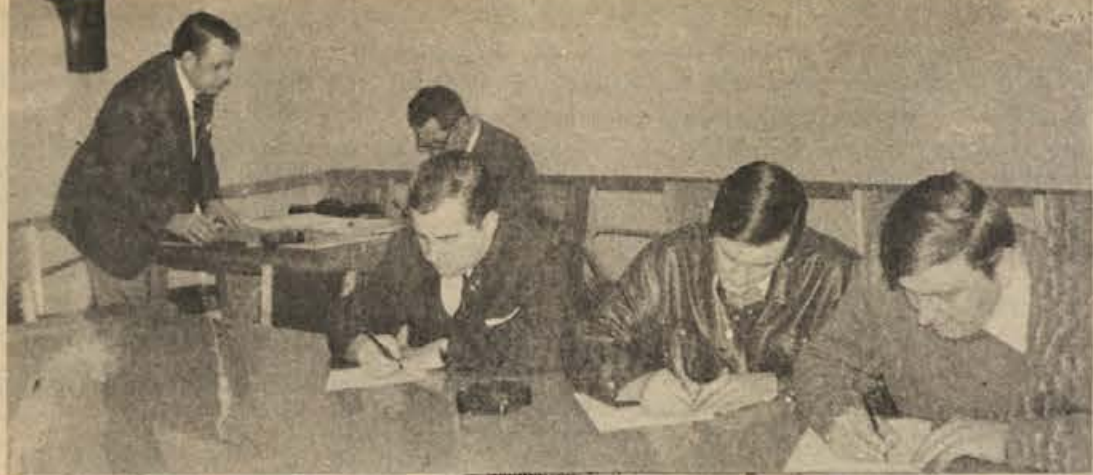
Analiza zadnjega testiranja rezervnih vojaških starešin v kočevski občini je pokazala, da se ga je udeležilo 98,5 odstotka vseh poklicanih starešin. Preizkus znanja je prestalo z odličnim uspehom 15 odstotkov starešin, s prav dobrim 20 odstotkov, dobrim 40 odstotkov, zadostnim 22,5 odstotka, nezadostnih pa je bilo le 2,5 odstotka.