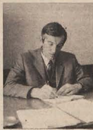
ženega dela že ustanovljena, v se-miški Iskri pa so se tudi že odločili za tako pot. Pogoje za samostojno poslovanje kot TOZD pa ima po našem mnenju še več drugih kolektivov.“

„V letošnjem letu, zlasti v zadnjih dveh mesecih, že lahko govorimo o otipljivih spremembah. Politični akciji komunistov in delu komisije, ki je zbrala potrebno gradivo za analize, smo začrtali drugo obdobje: najprej akcijo obveščanja delovnih ljudi, zatem pa ustanavljanje komisij za samoupravljanje v delovnih organizacijah. Medtem ko prvi del akcije (osveščanje) še teče, pa so komisije ustanovljene v vseh kolektivih, tudi v šolstvu. Nekateri kolektivi imajo tudi že predloge, kako bo v bodoče organizirano samoupravljanje v njihovem podjetju. V enoti Viatorja je temeljna organizacija zdru-