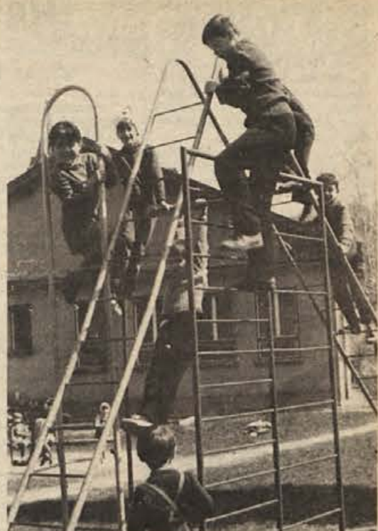
Srečni starši, ki imajo otroke v varstvu. Program otroškega varstva za občino Krško obeta graditev štirih vrtec. Letos ga bodo dobili v Kostanjevici, prihodnje leto v Brestani, nato pa bosta na vrsti Krško-levi breg in Leskovec.