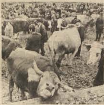
Živinoreja je doma v hribovskih predelih

stvar osebnih stališč, možnost prostovoljnega opredelevanja in ne to, kar samoupravljanje danes v resnici je - temeljni produkcijski odnos.