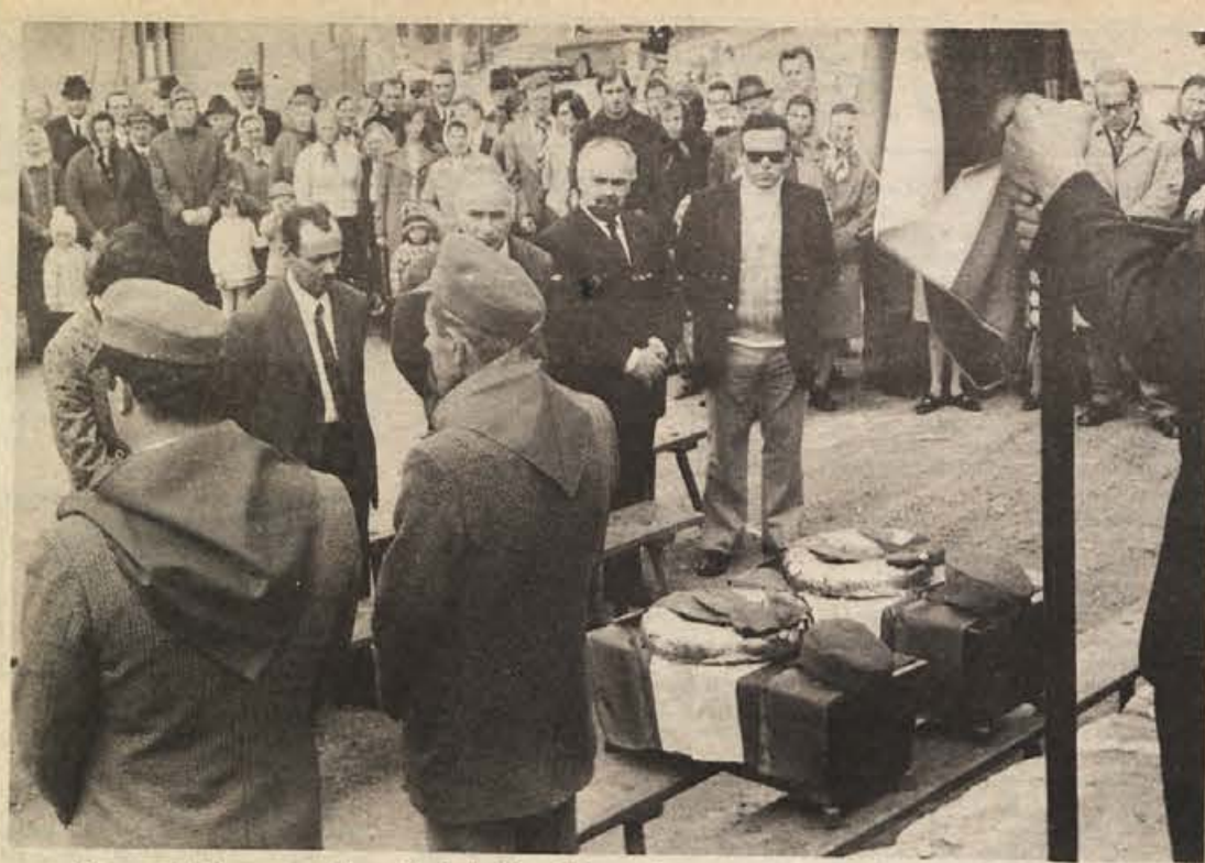
S ponedeljkovega prekopa dveh italijanskih partizanov v Gabrju