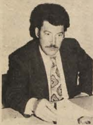
cijski center, kajti to, kar ima občina v Savudriji, je premalo za oddih delavcev. Za ureditev počitniške skupnosti smo lani pripravevali 7 tisoč dinarjev in plačali letovanje 32 otrokom. Toda to ni rešitev, to je krpanje.“

Tudi za splošno počutje zaposlenih ne skrbimo dovolj. To velja za manjše delovne organizacije, ki nimajo svojih obratov družbene prehrane. Razvijata se središči Dobova in Bizeljsko, zato smo sklenili najprej ugotoviti potrebo, da bi potem uresničili pobudo komiteja za ustanovitev delavske kuhinje v Brežicah. Sindikat se zavzema za rekrea-