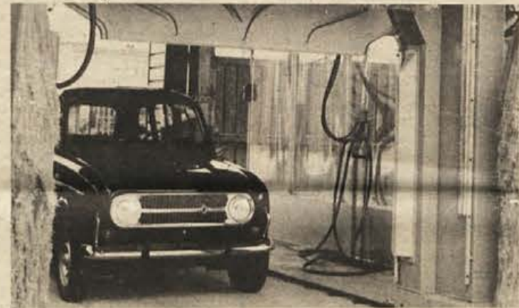
R 4, znana katrca, narejena v Novem mestu, na fotografiji v pralnici, ki jo izdeluje novomeška IMV v Belem Manastiru.