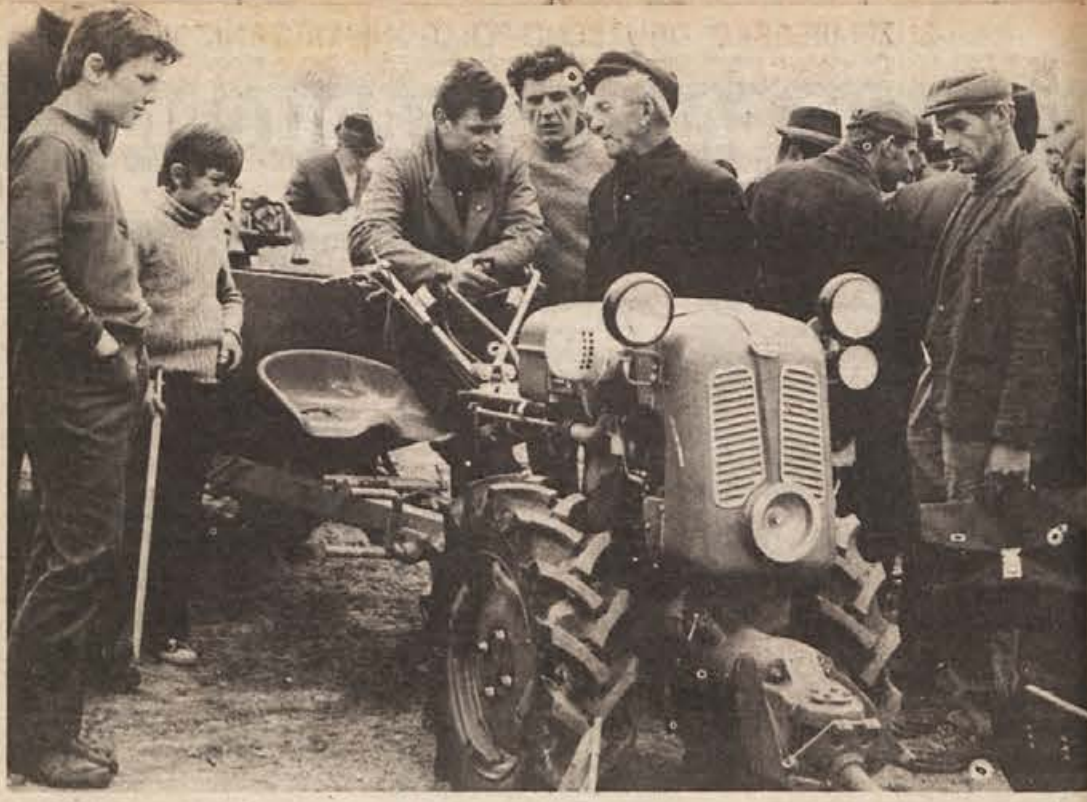
Metličani so se živo zanimali za uporabnost in predvsem za cene malih kmetijskih strojev, ki jih je predstavila JUGOTEHNIKA.