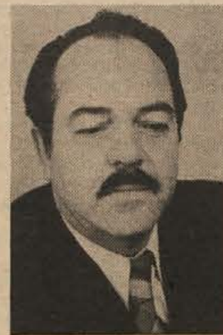
Tovariš Medved, kakšno bo delo novega sveta? - smo vprašali.

Druge dejavnosti? „Vključevali se bomo v občasne akcije, kot npr. skrb za opremo vozil v zimskem času. Izvedli bomo javno tekmovanje, kjer bodo lahko sodelovali vsi občani, pod naslovom „Pokazi, kaj veš in znaš o prometu“. Nič ne skrbel za stalnejše izobraževanje voznikov, čeprav prihaja dosti novih predpisov. Imamo tudi več praktičnih tečajev: novomeško cestno podjetje in republiški cestni sklad ne kažeta pripravljenosti za ureditev prometnih znakov na cestah 2. reda, kot bi bilo treba. Postaja milice nima potrebnih tehničnih sredstev. Predvsem zaradi številnih nesreč v naseljenih krajih je svet na seji v ponedeljek, 4. decembra, sprejel priporočilo občinski skupščini za nabavo radarja.“ A. Z.