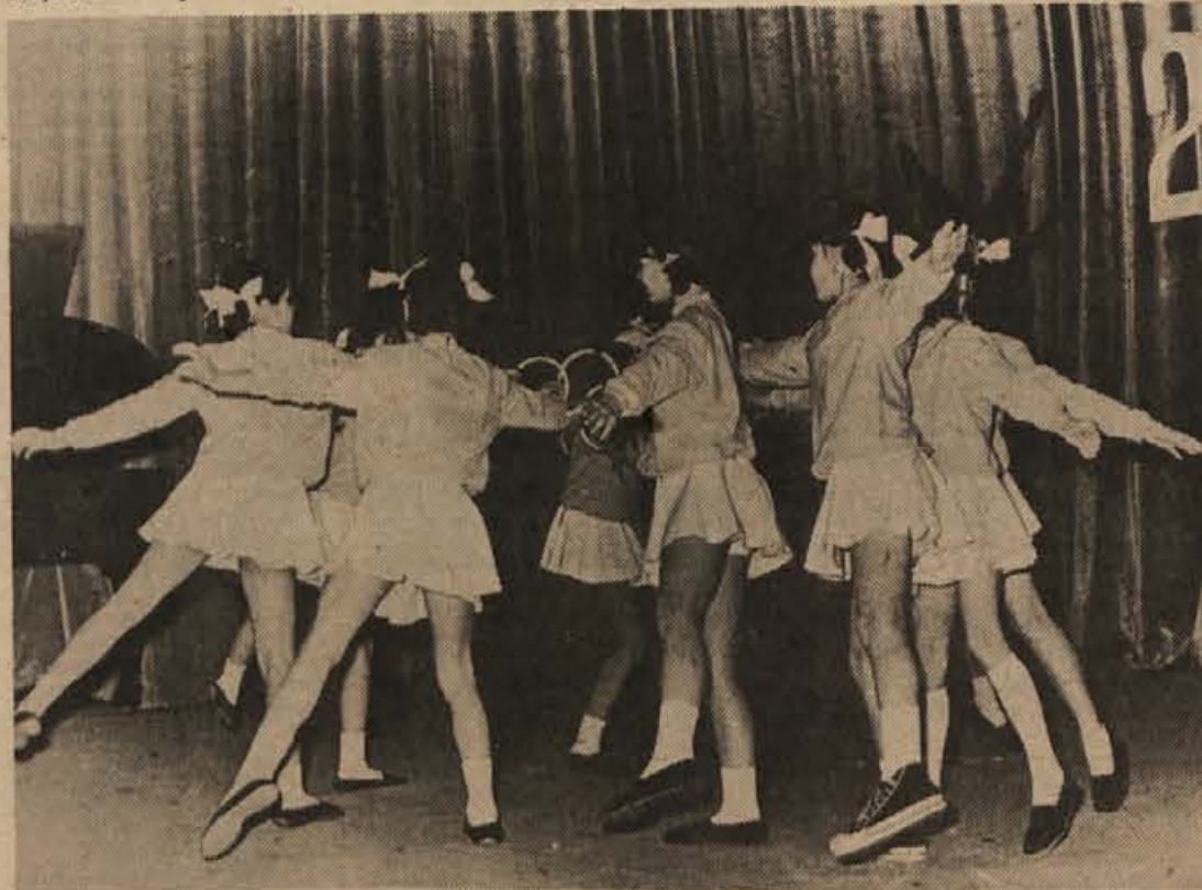
Ob koncu zadnjega tedna sta bila za jugoslovansko in slovensko telesnovzgojno življenje kar dve pomembni konferenci: na tretji konferenci ZKJ so se zavzeli za konec zapostavljenosti v športu, na prvi konferenci Partizana Slovenije pa za večjo osveščenost v naši telesni vzgoji. Bo posej v naši najbolj množični organizaciji še več ljudi? (pionirke Partizana nastopajo)

Novomeščani so končno zaigrali v dobri formi in močno premagali Lesce. Razveseljivo je zlasti dejstvo, da sta zmagali člani, na članskih deskah pa je Sitar skoraj neustavljivo. Rezultati: Roblek – Penko 0:1, Mali – Škerli 1:0, Sterle – Milič remi, Prestrl – Sitar 0:1, Harinski – Istenič 0:1, Butorac – Vene 0:1, Horvatova – Isteničeva remi, Butorčeva – Žičkarjeva 0:1, Hrovat – Komej 1:0, Mencinger – Pucelj 0:1. J. U.