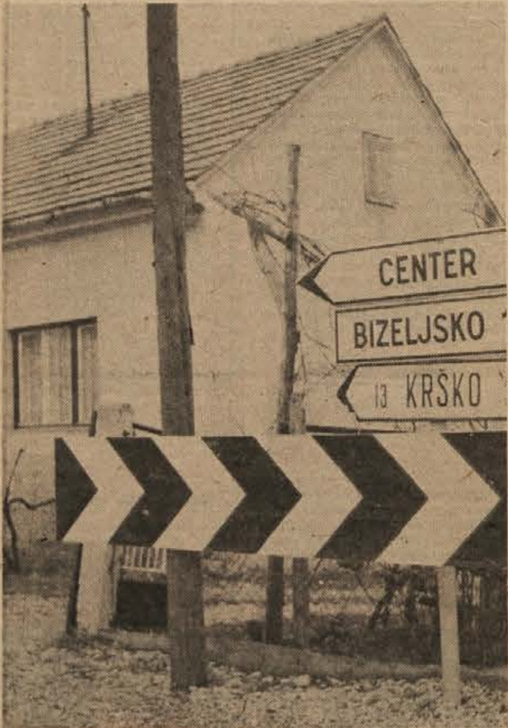
Nevarno križišče bizeljske ceste in priključka na novi savski most v Brežicah. Konec ceste so pred kratkim označili z zebrazno desko, zato že manj voznikov zapelje v ograjo in na vrt pred stanovanjske hiše. Ljudje, ki tam stanujejo, menijo, da bi križišče morali osvetliti

V KRŠKEM JE vsak dan več prosticcev za stanovanje. Če bodo podjetja začela združevati sredstva potrebno za družbeno graditev, čakanje ne bo predolgo. Skupščina in družbenopolitične organizacije se zavzemajo za takšno vlaganje. Le tako lahko upajo na dodelitev stanovanj tudi delavci z majhnimi prejemki, tisti, ki sedaj niso mogli privarčevati deleža za dodelitev posojila za individualno gradnjo.