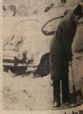
Napoved: tako bo...

10. Stopila sta na ulici in vsake zemeljske očel! V nobotičniki. Jutranja zaja se klene površine. Med nebom zrak — veletok letečih krata in delovno ljudstvo je odhajal. Povejmo takoj v začetku.