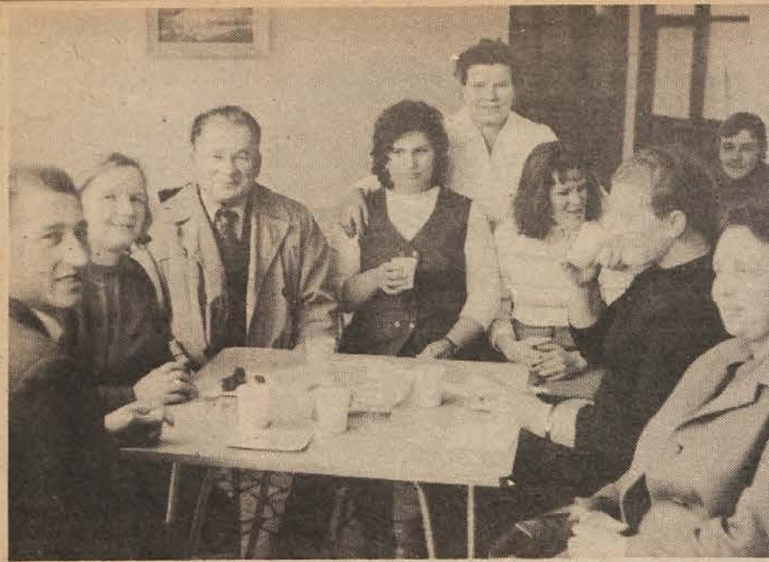
Kočevski krvodajalci so letos nazadnje oddajali kri 5. in 6. decembra. Kot vsako leto, tako so tudi tokrat načrt odvzemov krvi v kočevski občini preseгли. Tokrat smo posneli krvodajalce pri malici, ko so že darovali kri

ti na cesto. Zato naj bi priključek nasipali, da bi bil v isti višini z cestno.