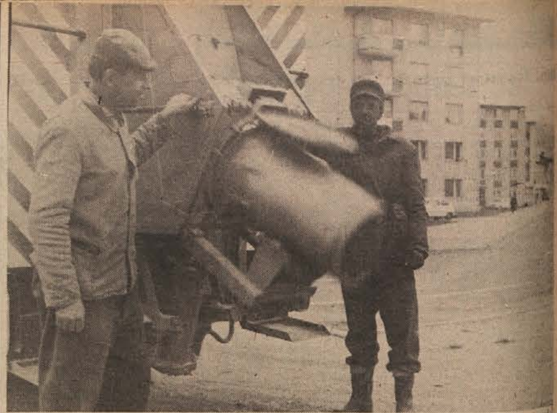
Tudi odvoz smeti se bo v Krškem podražil. Glede smetarske službe občani nimajo pripomb, odkar je stanovanjsko podjetje kupilo specialni avtomobil za higienni prevoz odpadkov

Zdravstva in otroškega varstva v občini. Smrt ga je iztrgala okoli, ko je bil na svojem mestu najbolj potreben. Del sebe je „vgradil“ v novo šolo v Brežicah, ogromno si je prizadeval, da bi otroci v Cerkljah dobili lepše prostore, da bi mladi rod na Bizeljskem čimprej dočakal preureditev šole, in da bi do spomladi postavili v Brežicah nov otroški vrtec. Imel je še toliko načrtov! Nenadoma smo ga izgubili, z njim vrod pa njegovega trinaestletnega sina, ki je komaj začel živeti.