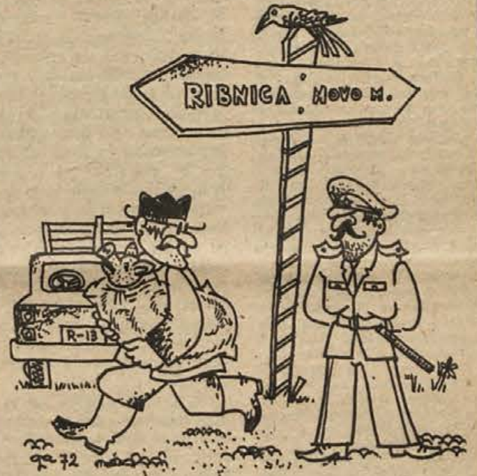
... in nadebudna prašičja glava je začela gledati ...

„Nak, s prašiči se pa že ne bom peljala!“ Končno sta prišla do zadnje gostilne, toda glej ga šmenta – dva prašička sta jima crknila. Nista vedela, kaj storiti.