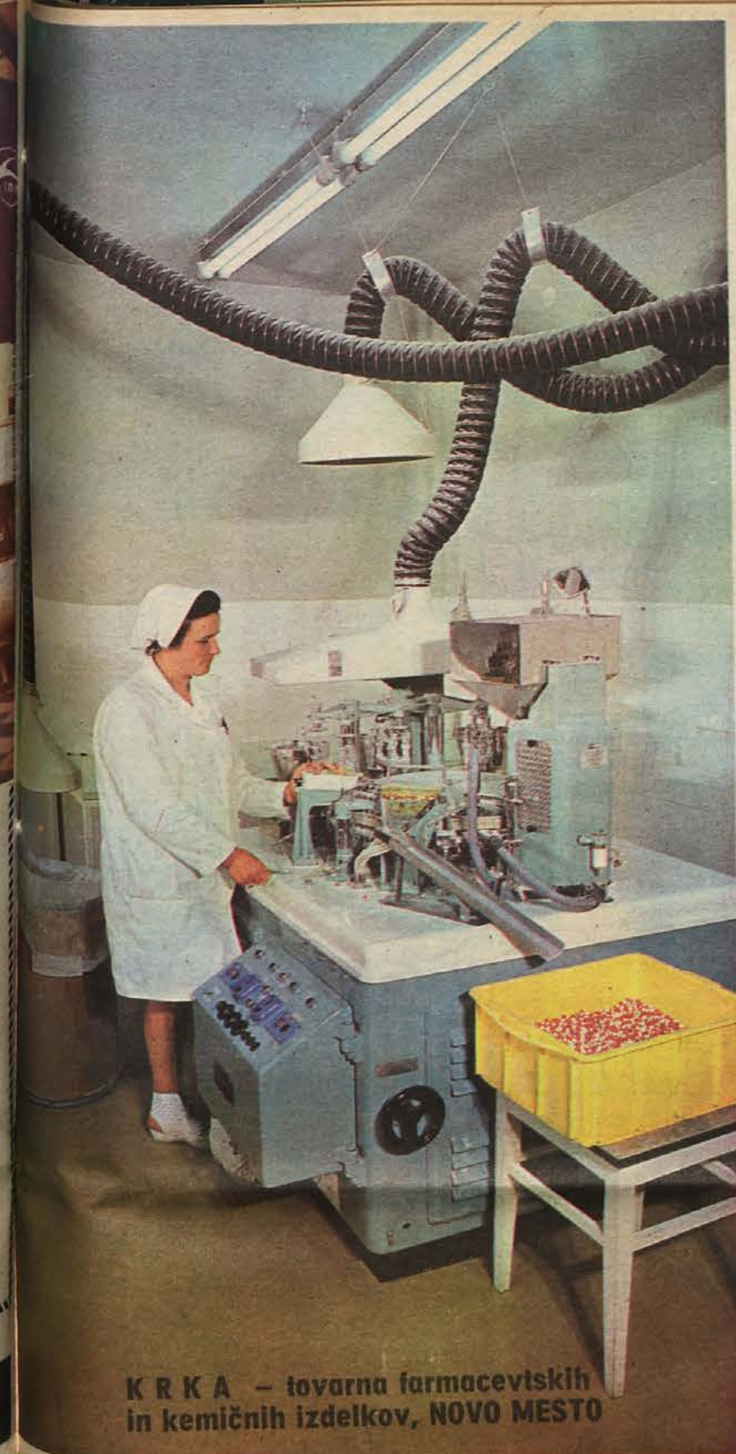
K R K A – tovarna farmacevtskih in kemičnih izdelkov, NOVO MESTO

8. Sema neumna! jo je zavrnil soproj. Ali ne vidiš, da sva na Marsu? Ali bi rada primerjala marsovski plače z najino pokojnino? Sicer pa meni tukaj ni posebno všeč. Zakaj neki meniš, da so naju vtaknili v hiadlini – če ne zato, da naju očvrjejo za vsiljivo. Cimperj odtoč, tem boljše! In zakonca sta planila k vratom. Toda korak jima je