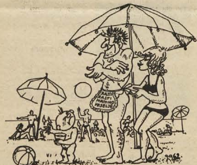
... mu je dala žena slinček njihovega najmlajšega ...

Bil sem v čudoviti deželi. Ljudje se med sabo sploh niso prepirali in živeli so v pravem paradizu. Edina nadloga, ki jih