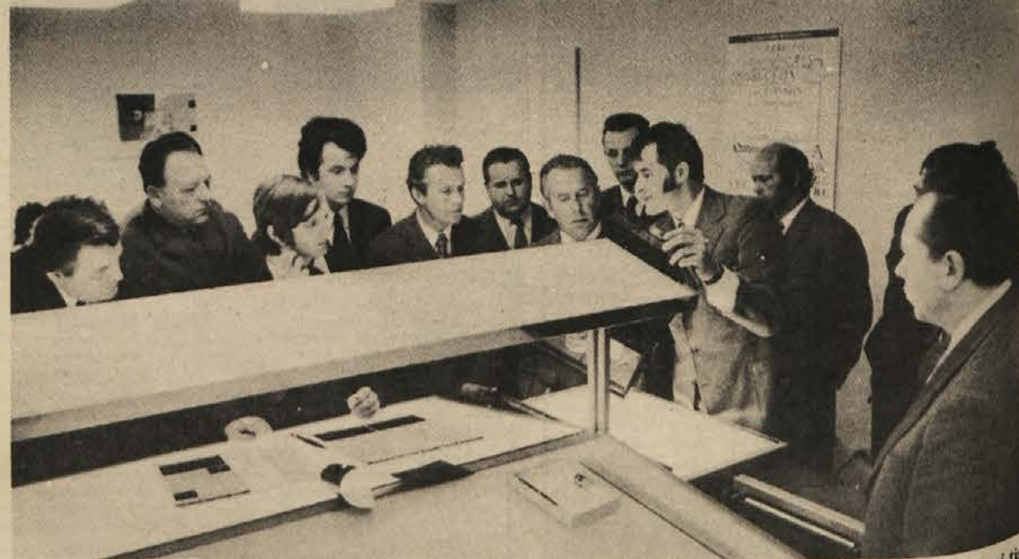
Po otvoritvi tehničnega oddelka Dolenjskega lista so si gostje z velikim zanimanjem ogledali grafično pripravo časopisa za ofsetni tisk. Otvoritev je bila v okviru praznovanj za letošnji novomeški občinski praznik in dan republike.

Na seji predsedstva občinske konference ZMS Novo mesto, ki je bila v sredo, so člani razpravljali o težah za razpravo o organiziranosti v občinski konferenci ZMS Novo mesto in o predlogih za nove člane predsedstva občinske konference.