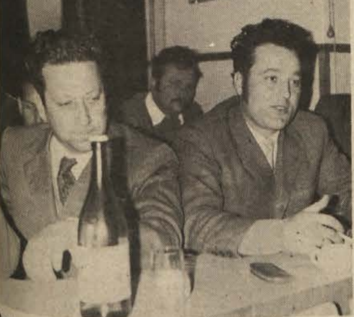
Predsedniki delavskih svetov, delovnih skupnosti in sindikalnih organizacij v Krškem zahtevajo združenje sredstev, namenjenih za doslej zapostavljeno gradnjo družbenih stanovanj. Razen tega bodo vztrajali, da bodo delavce v podjetjih še pred iztekom leta seznanili s poslovanjem. (Foto: J. Tepepy).

29. novembra 1955 je nekoli deček z galerije zvezne ljudske skupščine vprašal predsednika Tita: "Tovariš Tito, kateri je tvoj naj srečnejši dan v življenju?"