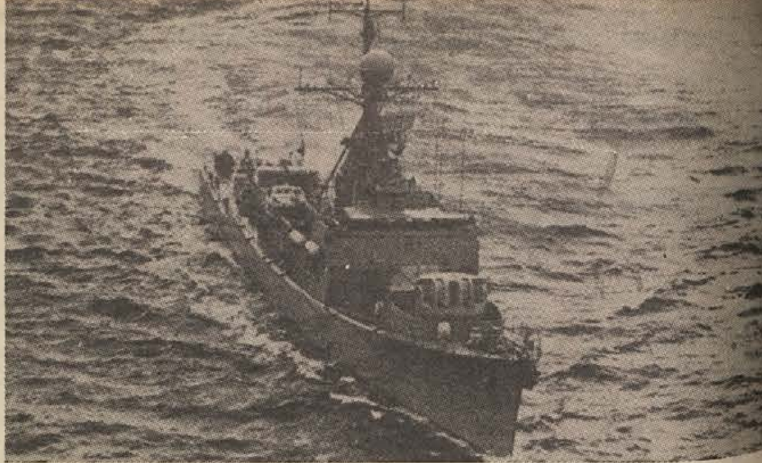
OSLO - Predstavnik norveškega obrambnega ministrstva je sporočil, da so prenehali iskati skrivnostno podmornico, ki se je štiri dni pojavljala v norveških ozemeljskih vodah. Iskanje so prekinili, ker so ugotovili, da je podmornica že zapustila norveške ozemeljske vode. Pod kakšno zastavo je plula, niso ugotovili. Na sliki: ena izmed norveških vojaških ladij, ki so sodelovale pri lovu na neznano podmornico.

koristna in potrebna gospodarska dejavnost. Z napačnimi napovedmi pa želijo cene zvišati ali znižati, kakor jim pač bolj ustreza, da bi pobrali več nezaluzenega dohodka ali dobička. To se dogaja pogosto. Taka konjunkturna služba pa diši bolj po dobičkanosni reklami kot po poštenem delu.