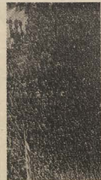
Veliko ljudi - pa malo inšpektorjev...

Ne gre pa pozabiti še nekaj res je, da jim moramo izboljšati delovne pogoje in jih kadrovske okrepi, ne gre pa pozabljati, da imajo nekaj platna in škarije te službe tudi same v rokah. Zamudno bi bilo vedeti, kolikokrat doslej so uporabile proti krivicam najvišje možne kazni! Zato se, da malokrat, ker se pri novonovljanju raje zadovoljijo s simboličnim tisočakov, čeprav je najostrejša kazen, ki jo smejo izreči - desetkrat večja.