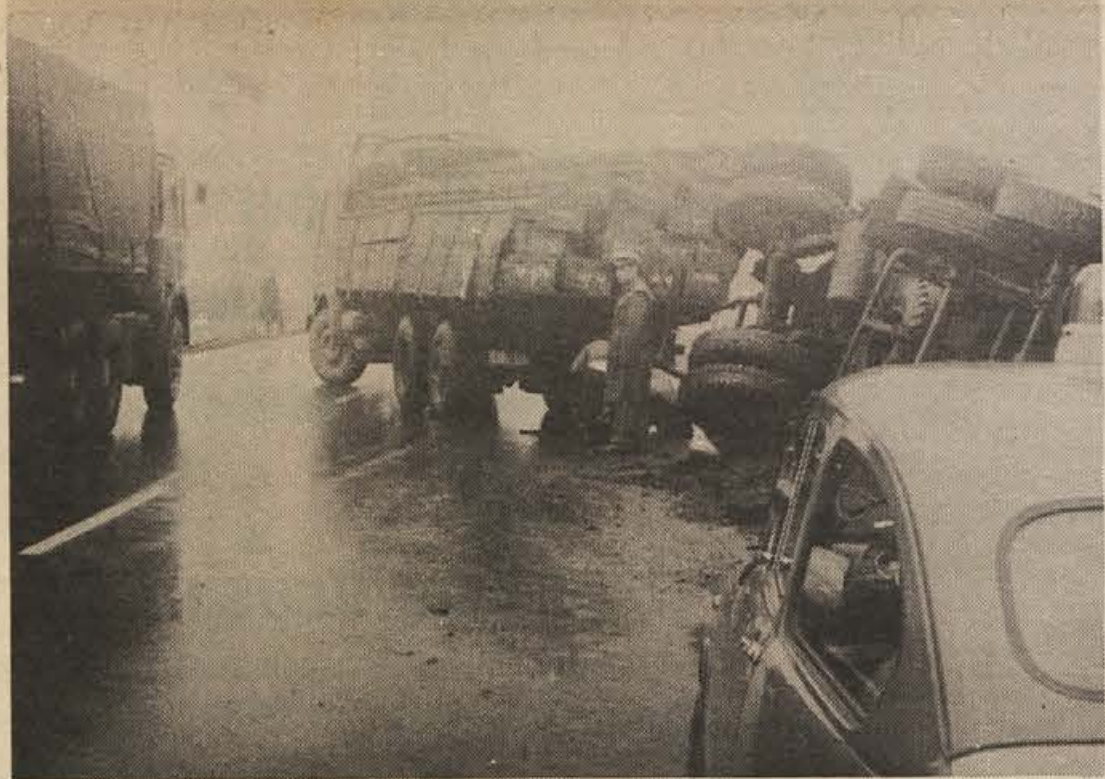
Sredi prejšnjega tedna je megla trdoživno napadala jutranje vožnje (na fotografiji: v megli je tovornjak zdrsnil s ceste in potem zaprl promet), v četrtek zvečer in v petek proti jutru pa je nov snežni metej zaprl avtomobilsko cesto. Šele proti petkovemu jutru so jo cestne službe toliko usposobile, da je bila spet prevozna.