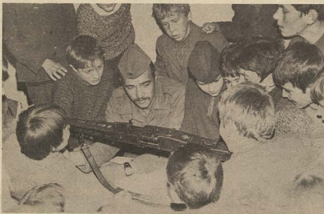
Pionirji in mladinci osnovne šole Mirna so ustanovili kurirski odred TV-5 v spomin na medvojno kurirsko pot preko Debenca. Kurirji so izbrani tako, da lahko v najkrajšem času pridejo do sleherne domačije na območju mirnske krajevne skupnosti. Ob ustanovitvi odreda so imeli v gosteh tudi vojake. Na sliki: ogled mitraljeza.

Interesenti naj se glede ostalih informacij zglase v upravi Sekcije za vleko, Novo mesto, Kolodvorska 9.