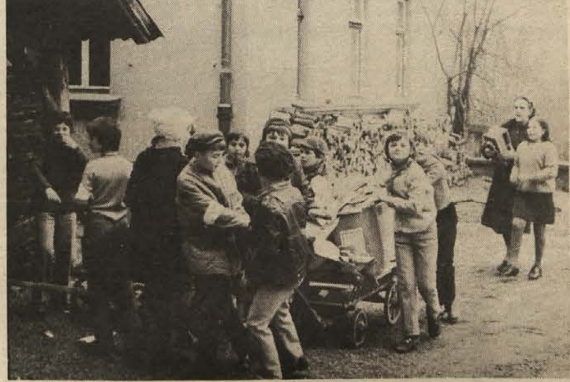
Društvo za boj proti raku je organiziralo po vsej Sloveniji akcijo za zbiranje starega papirja. V Novem mestu je akcija s pomočjo novomeških osnovnošolcev uspešno izpeljala organizacija Rdečega križa. Na vseh dvoriščih osnovnih šol je po 6-urnem zbiranju ležalo okoli 5 ton starega papirja in krp. Na sliki: učenci OŠ "Katja Rupena" so imeli veliko dela, preden so na dvorišču uredili kupe starih časopisov.