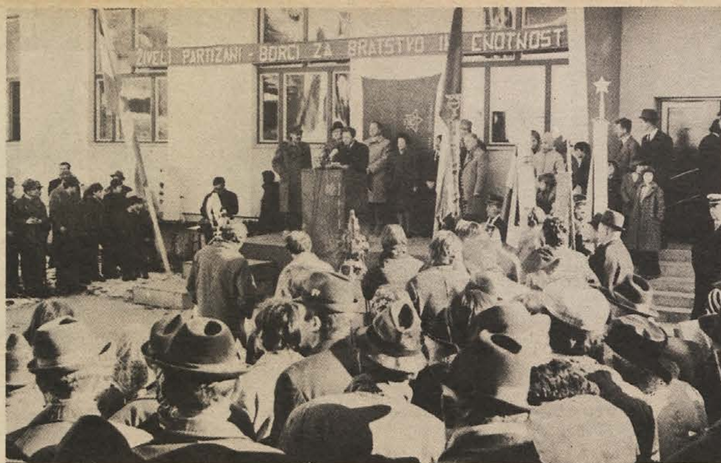
Nedeljskega zborovanja na Suhorju se je udeležilo nekaj tisoč ljudi iz vse Bele krajine, pa tudi iz sosednjih slovenskih in hrvaških občin. Kot slavnostni govornik je nastopil France Popit, predsednik Centralnega komiteja Zveze komunistov Slovenije.