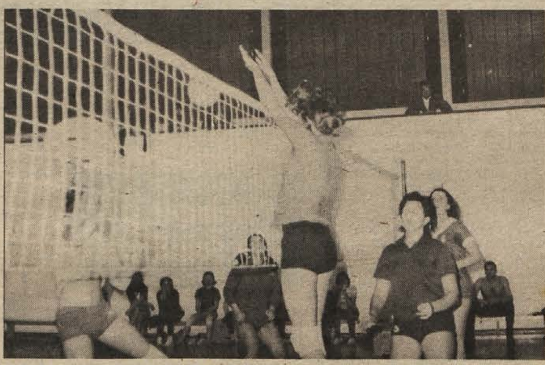
Najbolj vroči trenutki so vedno ob mreži. Prizor je s treninga slovenske mladinske reprezentance

na zadnjem mestu. Mnogi so pričakovali, da bodo osvojile pokal. Po koncu turnirja so se odbojkarice Mladosti pomerile še z izbrano ekipo slovenskih mladink, ki se je dva dni pripravljala v Novem mestu. Mladinke, zbrane pretežno iz Fužinarja, so se dobro upirale Zagrebčankam in so podglele z 1:2. V mladinski reprezentanci sta nastopili tudi domači igralki Rajerjeva in Pučkova.