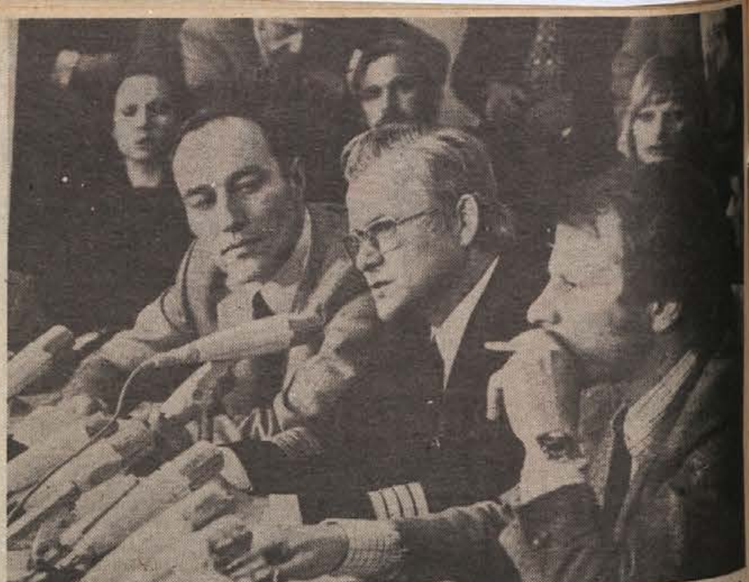
Dva komandos palestinske osvobodilne organizacije sta ugrabila letalo zahodnonemške letalske družbe Lufthansa, boeing 727, in izsilila v zameno izpustitev treh arabskih teroristov, ki so v treh različnih muenchenskih zaporih čakali na sodno obravnavo zaradi sodelovanja pri poboju izraelskih športnikov med Olimpijskimi igrami. Zadeva se je vsaj za Palestince - srečno končala. Letalo, ki je sprejelo na krov vse tri arabske teroriste, ki so jih iz Zahodne Nemčije prepeljali s posebnim letalom v Zagreb, kjer so se vkrcali na ugrabljeni boeing 727, je srečno pristalo v Tripolisu v Libiji. Tam se ugrabitelja in izpuščene teroriste odpeljali neznanu kam, potnike pa povabili, naj na libijske stroške prenočijo in naslednji dan odpotujejo nazaj v Evropo. Tako so tudi storili. V ugrabljenem letalu je bilo 13 potnikov in 7 članov posadke, ki (na sliki kapetan med tiskovno konferenco) niso mogli skriti veselja, da se je vse dobro končalo.

Razlike so tudi v mnenjih, kdo naj bi bil združnik ali član obrata za kooperacijo. Nekateri