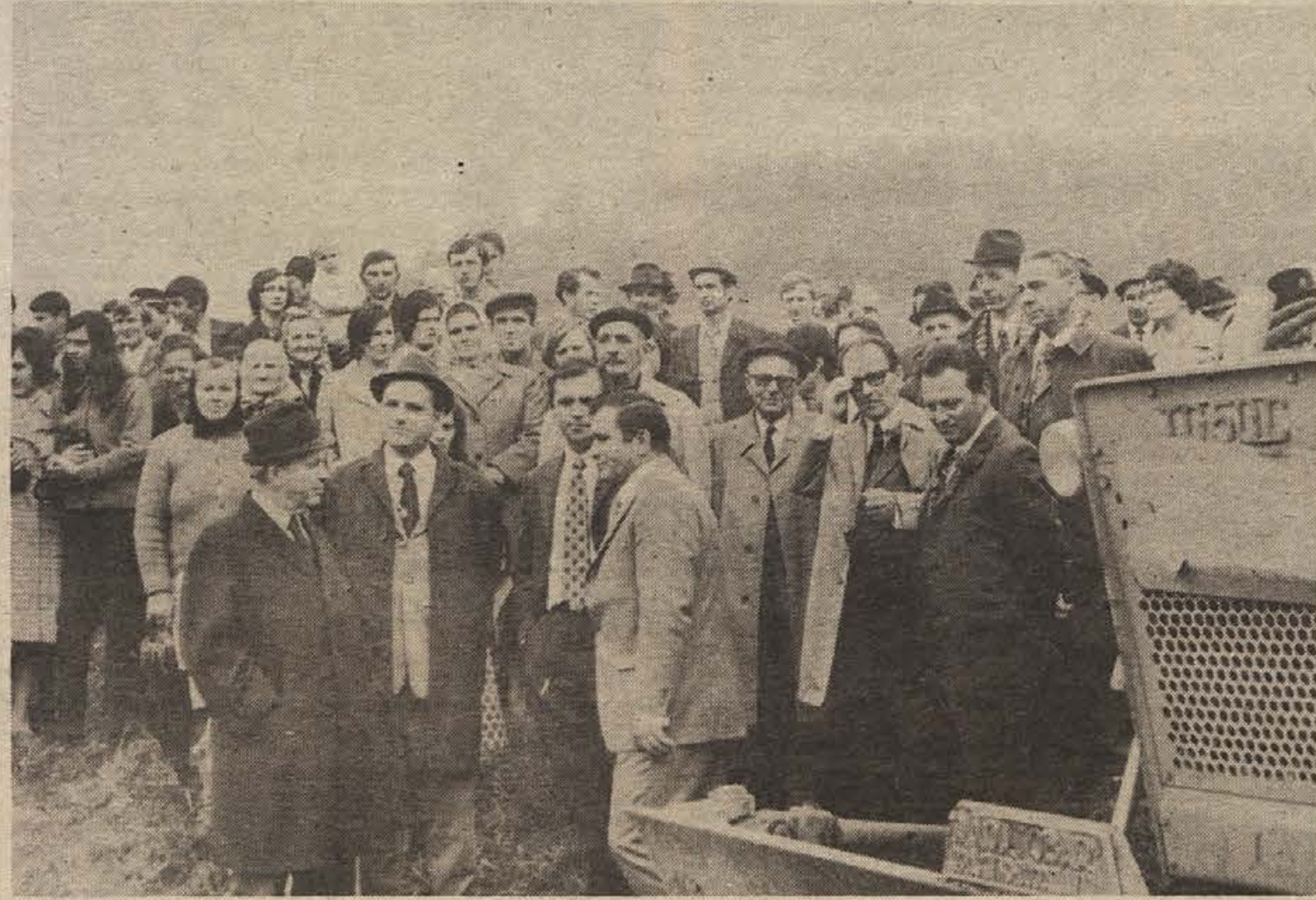
Tako je bilo v soboto na Vinici, ko so na slavnosten način začeli graditi obrat tovarne NOVOTEKS

Stane Potočar na manevrih Svoboda 71" Stane Potočar: načelnik generalštaba Generalpolkovnik Stane Potočar, sedanjí komandant ljubljanskega območja, je po ukazu nekdanjega predsednika Tita prevzel novo dolžnost v generalštabu. Stane Potočar se je rodil 27. aprila 1919 v Mirni peči. Vse svoje življenje je posvetil revoluciji in borbi za napredek naših narodov. Generalpolkovnik Potočar je nosilec partizanske spomenice 1941 in narodni heroj, odlikovan je bil tudi s številnimi drugimi odličji. Ob imenovanju na položaj načelnika generalštaba mu tudi Dolenjski iz srca čestitamo!