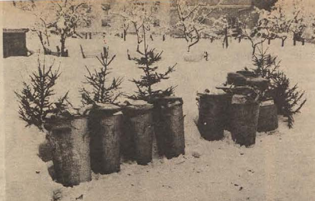
Vesolja je konec. Spet bo treba leto dni pridno delati.