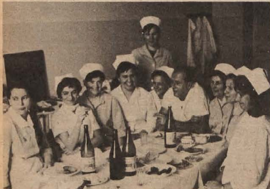
Medtem ko so se nekateri veselili, so drugi delali. V novomeški porodnišnici so dežurni takrat, ko ni bilo dela, v čajni kuhinji tudi silvestrovali.

Posamezniki so se zanimali še za konkretne možnosti za zaposlitev doma, za razvoj občine in podjetij, zlasti pa Vinice. Kot so pojasnjevali predstavniki podjetja BELT, Zavoda za zaposlovanje in socialno zavarovanje, sindikata in SZDL, je zdaj možnosti za zaposlitev več, še bolje pa kaže v naslednjih letih. R. B.