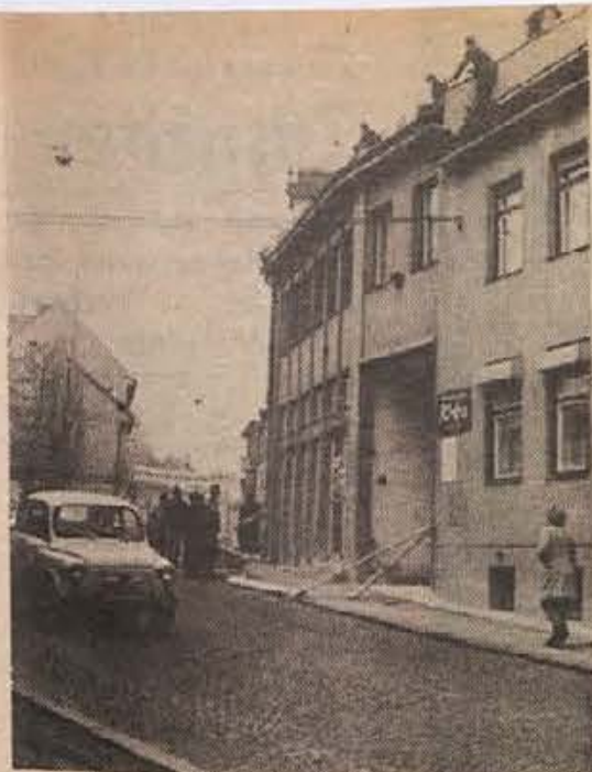
Takole pa ne gre: pločnik zaprt, pešci na cesti in dvojna nevarnost — lahko prileti opeka na glavo ali pa te povozijo avtomobil. Na sliki: pred ekspozituro DBH na Cesti komandanta Staneta v Novem mestu.