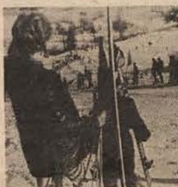
PO KAKŠNIH CENAH LETOVANJA?

Ce so pred tedni gostinske in turistične organizacije ugibale, kako naj sestavijo svoje cenike, da bodo kar najmanj prizadete zaradi različnih tokov posameznih nacionalnih valut, imajo zdaj čisto druge težave. Njihovi ceniki, pa naj bodo natisnjene cene v dolarjih ali dinarjih, so že objavljeni, dinar pa je v tem času doživel svoj drugi padež v letu 1971. Mimo tega je zvezna vlada sklenila zamrzniti vse cene, ki so veljale 26. novembra. Gostinci in turistične organizacije so se tako znašli v dokaj težkem položaju. Upravni organ turističnih organizacij in Jugohotela je sicer v Beogradu sklenil, da cene penzijskih storitev ne smejo biti večje kot lani v enakih mesecih.