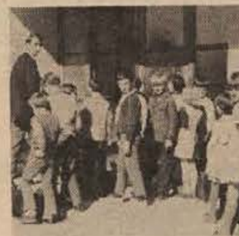
Kritika enotnega učnega načrta. Na sliki: šentjanski šolarji