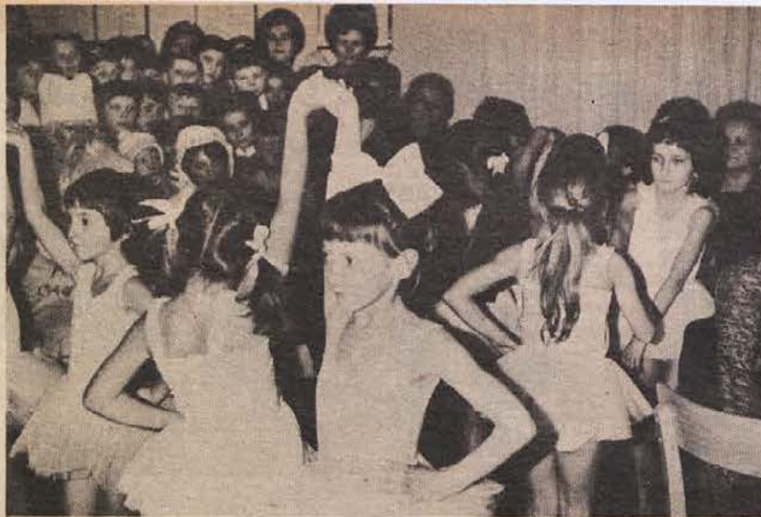
„BALET V BREŽIŠKI GLASBENI SOLI“ – Ob koncu starega leta se je dedek Mrz ustavljal tudi v brežiški glasbeni soli; mlade baletke pa so se predstavile s prikupnim baletnim nastopom.