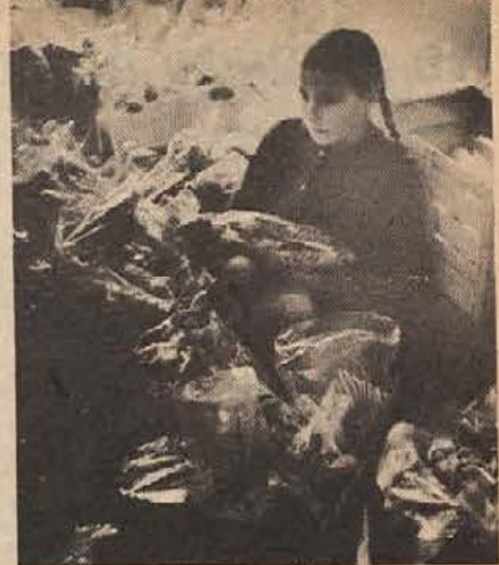
V skladišču dedka Mraza na Vinici, preden je napočil veliki trenutek, ki so ga otroci težko čakali vse leto. Dedek Mraz je letos manjšim šolarjem in predšolskim otrokom z viniškega konca prinesel samo sladkarije. Vedel je, da se jih bo marsikateri otrok samo tokrat najedel.