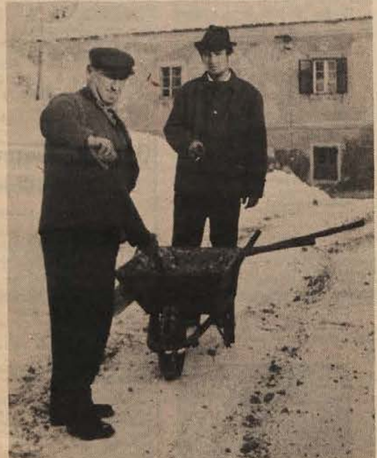
Čprav se je okoli novega leta sneg večkrat ponujal, ni napravil večje zmede. Kljub vsemu pa so delavci novomeškega Komunalnega podjetja skrbno posipavali spolzka mesta, tako da ni prišlo do nesreč.