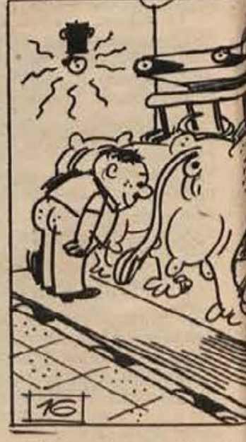
16. Stopila sta bližje naša slupe in se sklonila k visoko prodtem pa je ostro zazvonil zvonec na ukaz dvignile repe in se v tekoči trak za seboj... Zal, očedile so se kar po d stranišče, kot bi človek to tu