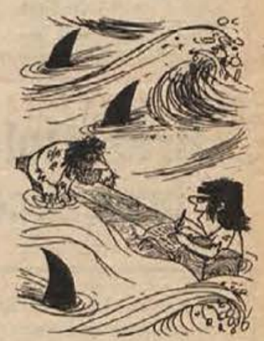
- Napisal sem pesem: Himna morju - vas morda zanima?