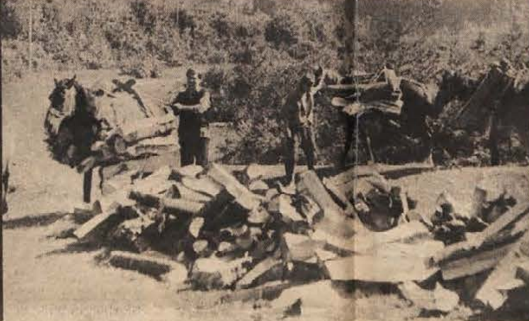
Spravljanje drv v dolino je opravilo, s katerim se nekateri poklicni ukvarjajo. Na sliki vidimo, kako z Gorjanc skupina zasebnikov iz Bosne na konjih tovori drva. Zastek je sezonski, ni pa slab.