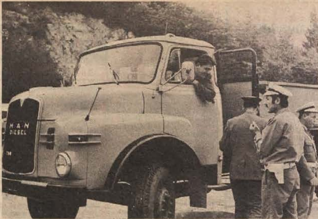
Jesensko-zimska cestnoprometna akcija se nadaljuje po vseh slovenskih cestah. „Stop, pregledujemo gume, luči, zavore!“ Miličniki so se postavili na prežo. Vse je tako kot med akcijo pred letošnjo turistično sezono v novomeški občini, od koder je tudi tale posnetek: voznik z brezhibnim vozilom nasmejan, mnogi drugi, ki so se do zdaj v kolonah skrivali z okvarami na vozilu, kislh obrazov. Akcija je prizanesljiva samo na začetku, kasneje nič več. Če mora človek odpreti denarnico ali k sodniku za prekrške, prihodnjic bolj pazi na vozilo.