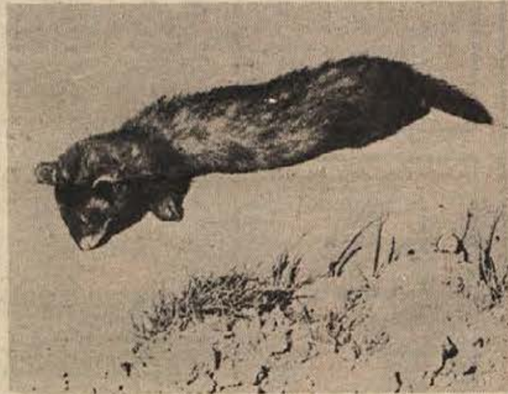
„Stric, to ni mačka, to je dihur!“ pravi Branko Zupančič. „Ujel ga je moj očka, ko je dihur kradel jajca v supi.“