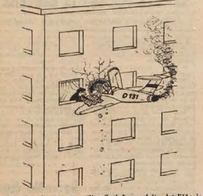
— Popolnoma ste zaši, pilot! Le poglejte, letališče je tukaj, kjer vam kažem s prstom, vi ste pa pristali preveč na desno!