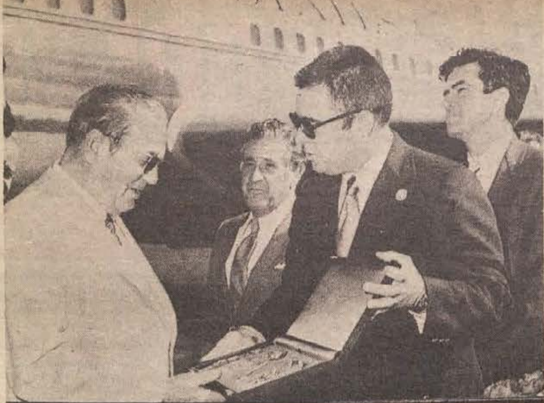
Predsednik Tito je na obisku v ZDA in Kanadi. Med drugim si je ogledal vesoljski center v Houstonu ter letalsko tovarno Douglas v Los Angelesu. Na sliki: predstavnik Palm Springsa, Kalifornija, izroča predsedniku Titu darila svojega mesta.

Druga možnost bi bila torej v tem, da bi pospešeno razvijali kmetijstvo, pri čemer je mišljen predvsem tehnološki razvoj. Samo ta lahko predstavlja osnovo, s pomočjo katere se bodo panoga in ljudje, ki se ukvarjajo z njo, postavili na svoje noge. Vse drugo so polovične rešitve. Mednje lahko štejemo tudi polproletarstvo, ki je sicer izhod za