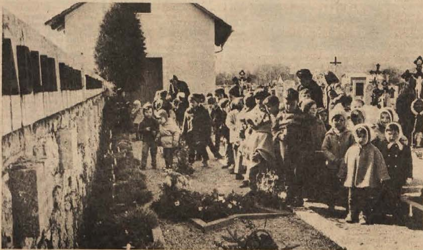
Najmlajši iz ribniškega vrta so pred dnevom mrtvih obiskali grobišče padlih partizanov. Vsaak je prižgal svečo in tako počastil spomin padlih „stričkov partizanov“. V Kočevju pa so na grobnici padlih borcev prižgali svečke tudi šolarji.