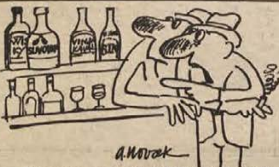
— Zdravstvo se pa res nič ne briga za delovnega človeka! Gripa prihaja, zdravila so nam pa podražila.