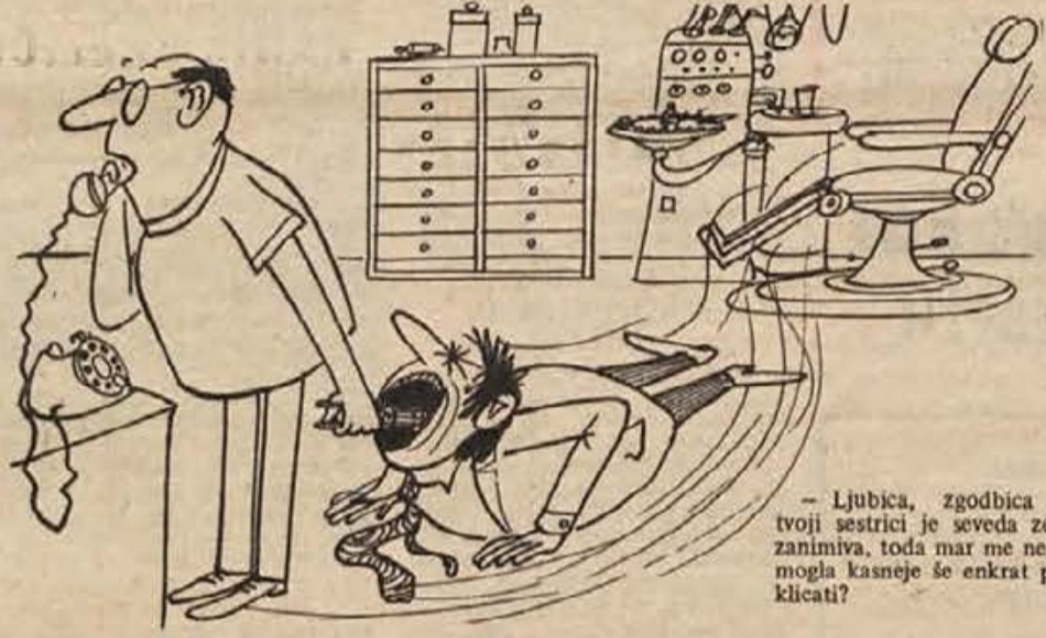
- Ljubica, zgodbica o tvoji sestrici je seveda zelo zanimiva, toda mar me ne bi mogla kasneje še enkrat poklicati?