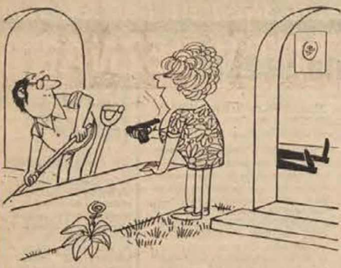
— Ste za zamenjavo, gospod sosed? Za vašo motiko, lo-pato in nekaj cementa vam dam tle pistolo, samo enkrat je bila rabljena!