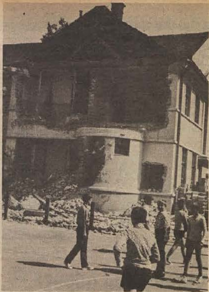
V Ribnici so začeli obnavljati dom TVD „Partizan“. Dolgo Ribničanom ni uspelo zbrati denarja, čeprav je bila obnova tega doma zelo nujna. Končno so letos z združenimi sredstvi gospodarskih in drugih organizacij le lahko začeli z deli.