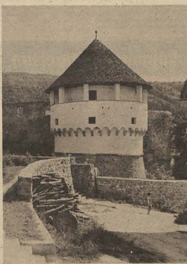
OD KAMNA DO KAMNA... Prizadevanja, da bi v nekaj letih obnovili in zaščitili grajske stolpe v žužemberškem gradu, so rodila že prve sadove. Na sliki: stolp, ki so ga obnovili letos.

Prodaja na domačem trgu se je letos povečala za 39 odstotkov v avgustu, v osmih mesecih pa že skoraj za 857 milijonov din izdelkov, s pogodbo je bilo prodanih za 231 milijonov izdelkov ali za 66 odstotkov več kot lani do začetka septembra.