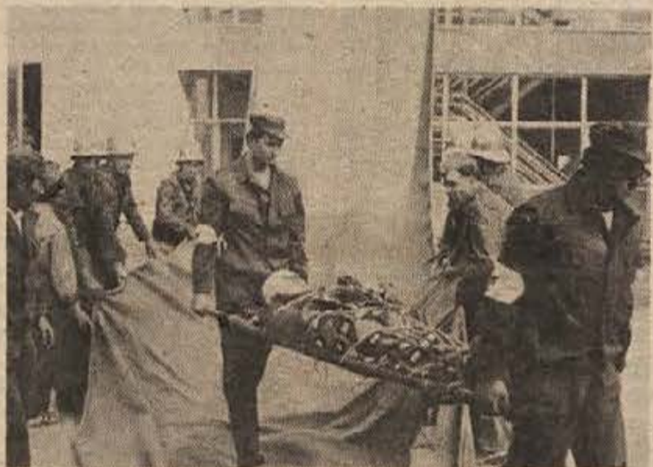
Težko ranjenega branilca neseta bolničarja v resilni avtomobil

kemijska sredstva. Ugotovili so, da so bile uporabljene samo navadne letalske bombe, zato niso imeli pravega dela, razen zavarovanja bomb, ki niso eksplozirale.