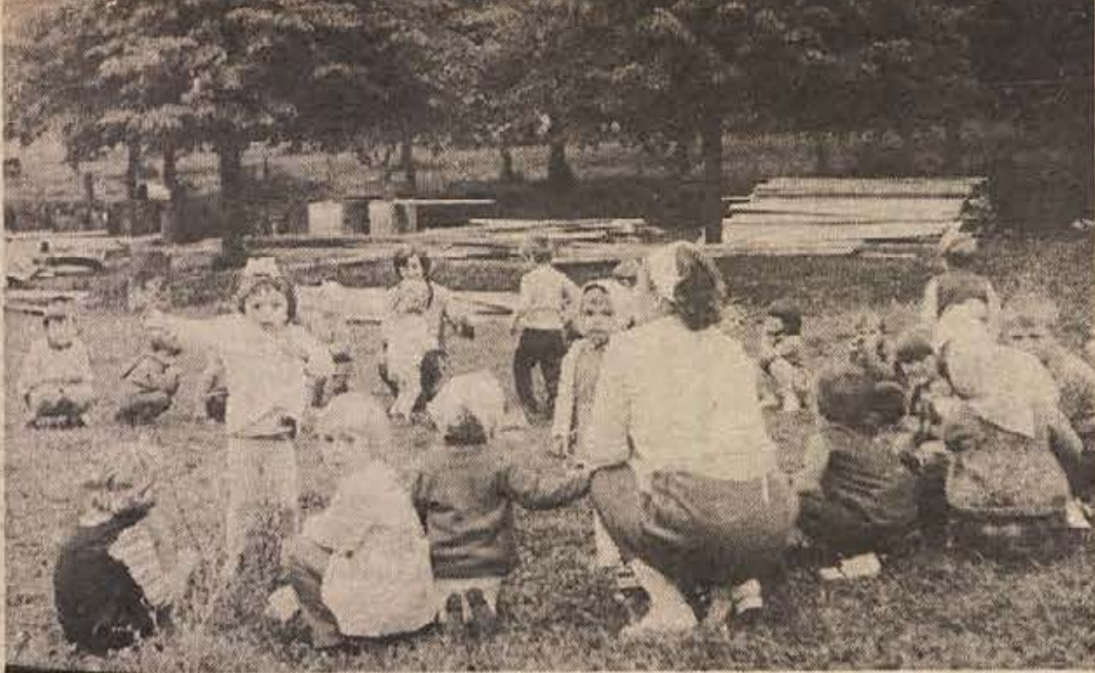
Malčki iz otroške varstvene ustanove v Metliki izkoriščajo na soncu zadnje trenutke. Napovedujejo dolgo in ostro zimo, zato bo časa za igranje v učilnicah še več kot preveč.