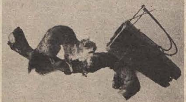
Z lanske polharske razstave: nagačeni polh pred pastjo, za katero trdijo polharji, da je stara več kot 100 let.