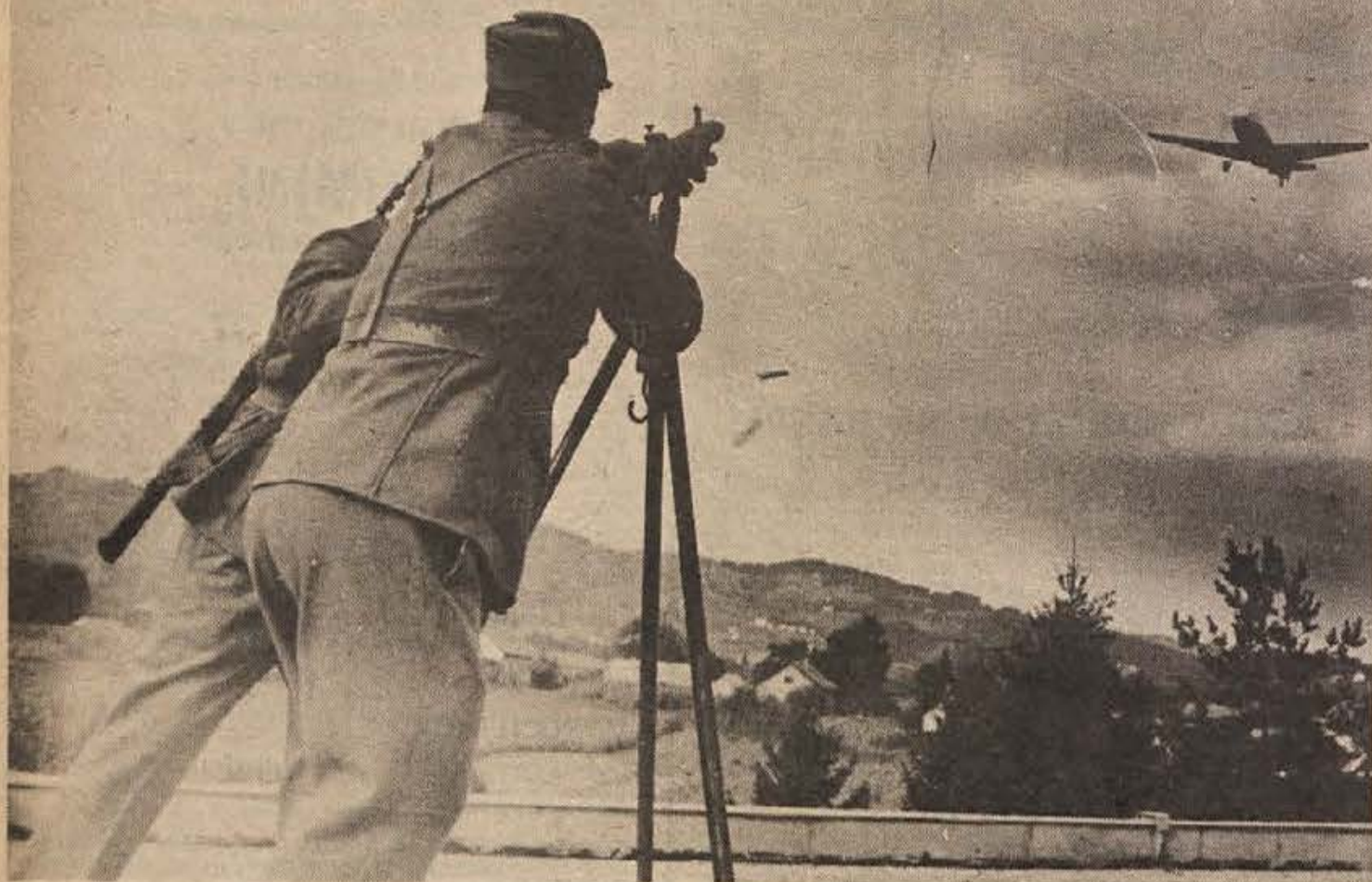
Protiletalska obramba na strehi obrata je zasipala s strojničnim ognjem nizko leteča letala