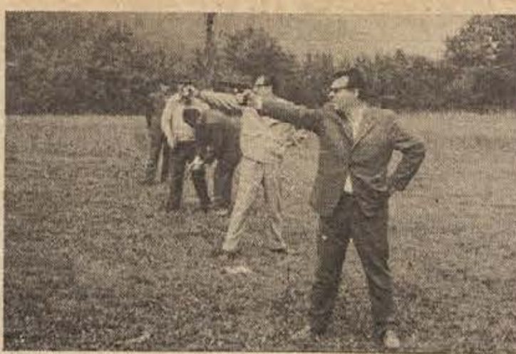
Strelske vaje rezervnih oficirjev in podoficirjev, ki jih je organizirala organizacija ZROP, so za območje mesta Kočevje končane, začele pa se bodo na podeželju. Streljali so s pištolo, brzostrelko, puško in polavtomatsko puško, prikazali pa so jim streljanje z nekaterim drugim orožjem.

V Kočevju bodo 7. oktobra letos zadnji krvodajalci dali kri. Letos je doslej v treh odvzemnih dneh oddalo kri 606 krvodajalcev iz vse občine. Po načrtu pa naj bi skupno za 12-krat povečalo vrednost proizvodnje, in to pri natančno istem številu zaposlenih. 176 članov kolektiva INKOP bo letos izdelalo različnih proizvodov v skupni vrednosti 18 milijonov din.