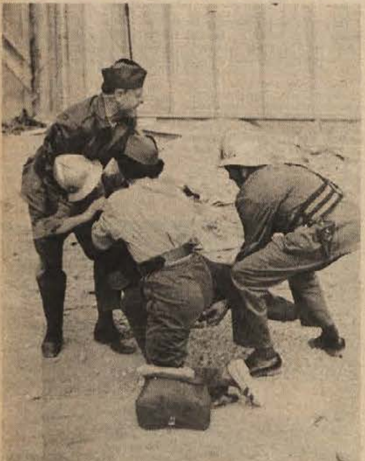
Gasilci so posredovali že med napadom, zato jo je pri opravljanju svoje dolžnosti skupil eden izmed reševalcev