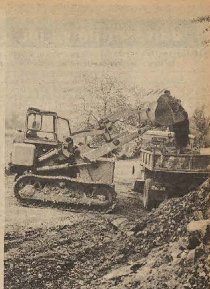
Na cesti Impoljca-Krško so začeli z zemeljskimi deli. Letos bodo modernizirali manj, kot je bilo sprva predvideno, ker bo cesta široka 6,5 m in so se dela zato podražila.