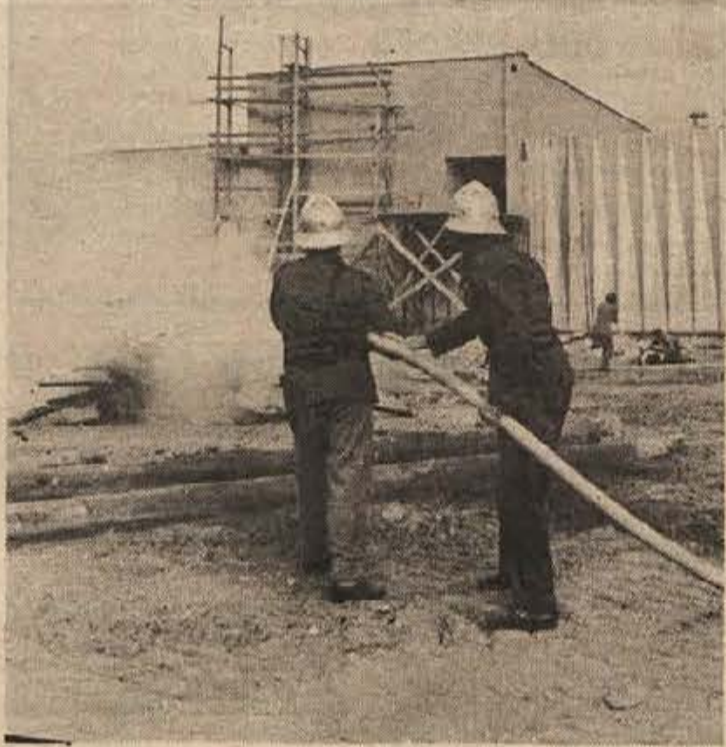
Krkin objekt je bil v ognju. Gasilci so s pripravami napadli ogenj in ga kmalu pogasili

Z roko v roki so sodelovali gasilci in ljudje iz sanitetnega voda. Gasilci so pripravili posebne lestve in jih naslonili na streho. Po njih so se povzpeli bolničarji, ki so morali obvezati ranjence. Ko so ranjenci dobili osnovno zdravniško pomoč, so jih namestili na posebna nosila, ki so jih po posebnih lestvah spuščali na tla. Krepke roke bolničarjev so nato ranjence odnesle do prevezovališča, kjer so jim nudili prvo zdravniško pomoč. Ranjence so reševali tudi s posebnim platnenim toboganom, ki so ga gasilci pri-