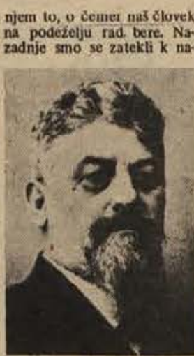
Pisatelj Ivan Tavčar, nedoseženi opisovalec slovenskega kmeta (1851 do 1923).

No, zdaj so se tudi „Strici“ iztekli in znali smo se pred nelahkim vprašanjem: kje dobiti kaj podobnega, da bodo naši bralci vsak teden znova z nestrpnostjo pričakovali povest v Dolenjskem listu?