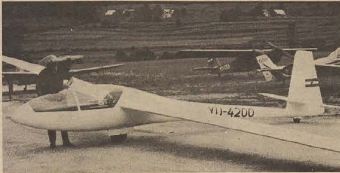
Prejšnji teden so novomeški letalci dobili visokosposobno tekmovalno jadralno letalo CIRUS. To je drugo tovrstno letalo v naši domovini in prvo po nemški licenci izdelano v Jugoslaviji. Novomeški Aeroklub ima tako že 11 jadralnih in 5 motornih letal.

Med neurjem se je vnel in zgorel leseni drog glavnega električnega voda v Volčičevi ulici v Novem mestu. Ogenj je izbruhnil zaradi okvare na izolatorju.