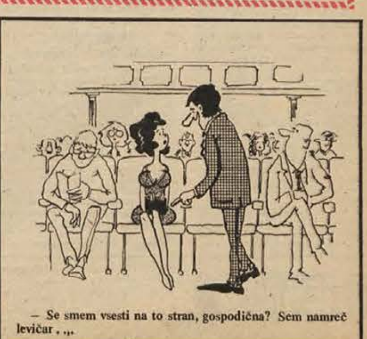
- Se smem vsesti na to stran, gospodična? Sem namreč levičar...

Od zajetih belogardistov jih je 25 ostalo in obležalo pri cerkvi, ker jih je tretji bataljon postal v "trinajsti bataljon", okoli dvajset se jih je priključilo nam in smo jih razstrelili po četah tretjega bataljona ostale, ki so se hoteli vrniti domov, pa smo izstrelili. Pa tudi tisti, ki so ostali pri nas, se niso kaj dosti ukazali. Samo šest jih je ostalo med nami. Med njimi je eden postal celo zelo dober oficir in sem ga po koncu vojne našel v naši ljudski armadi v činu podpolkovnika, ustala pa so jo drug za drugim pobrali proti Ljubljani, saj je bilo med njimi več Ljubljancev, ki so se priključili belogardistom, da so se rešili zaporov in nemške vojske.