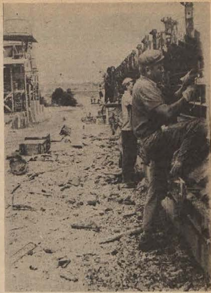
Priprava nosilcev za novi savski most v Brežicah. Vsak od njih tehtajo po 45 ton. Do 20. avgusta bodo dokončali vseh 37. To je zelo zahtevno delo. Gradis iz Maribora nekoliko zaostaja za planom zaradi pomanjkanja cementa in železa.