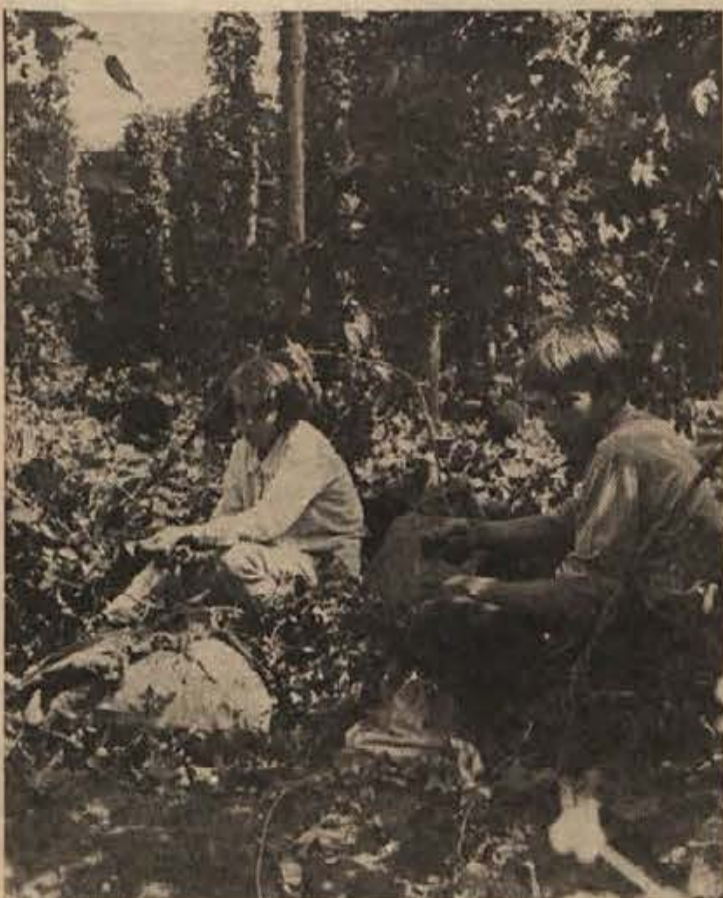
V Beli krajini, v okolici Novega mesta in na sevniškem območju so hmeljišča oživela. Povsod so se spravili nad „zeleno zlato“ v ponedeljek, 16. avgusta, razen na sevniškem koncu, kjer so začeli obirati že teden dni prej. Po dogovoru plačujejo vsi po 3 din za merico hmelja. Medtem ko Novomeščani in Sevnčanini že obirajo s stroji, si druge še pomagajo z živo delovno silo, toda obiralce je vedno teže dobiti.