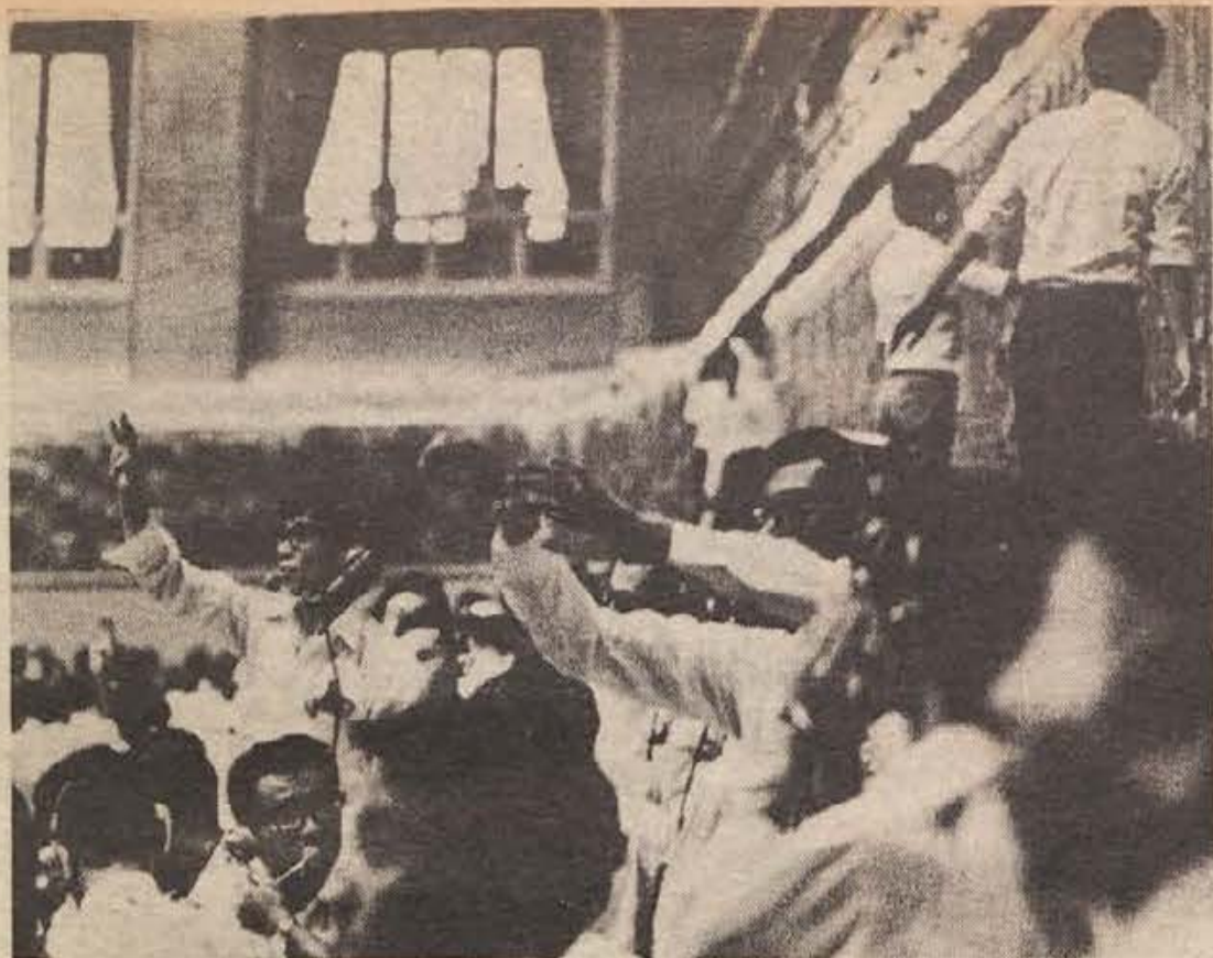
Nixon si je za svoj govor sicer izbral tak čas, da so bile banke in borze v Združenih državah Amerike zaprte naslednjih 24 ur po njegovi izjavi in niso mogle reagirati, toda drugod po svetu so njegove besede vzbudile pravo mrzlico. Tako je bilo tudi na tokijski borzi (slika), kjer je zavladalo skoraj panično vzdušje.