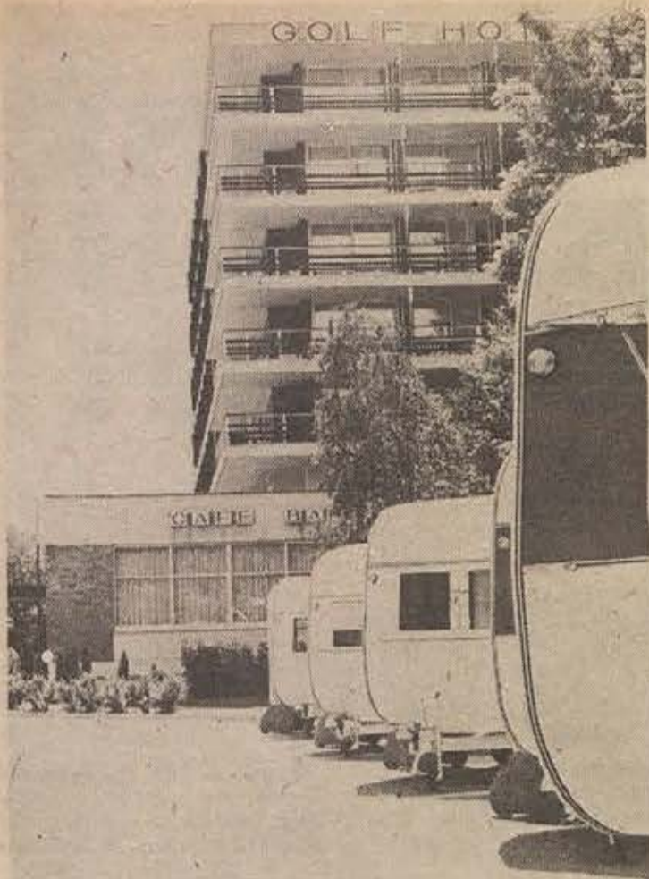
PRIKOLICE ZA NEMCIJO — V soboto in nedeljo so se mudili na obisku v IMV poslovni sodelavci in časnikarji iz Zahodne Nemčije, kamor je novomeška tovarna v tej sezoni izvozila 3.500 avtomobilskih prikolic. Gostje so si po konferenci v hotelu GOLF na Bledu ogledali tudi tam razstavljene nove tipe prikolic.