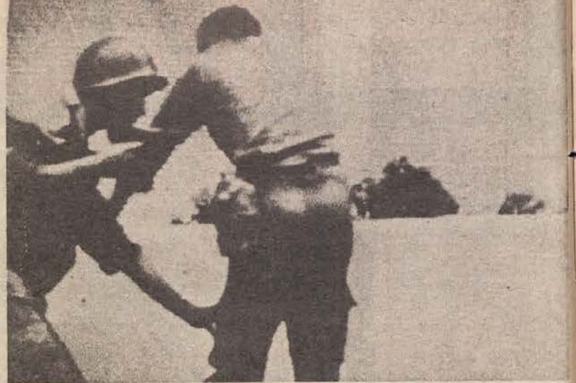
Tako kot po vsakem udaru (uspelem ali neuspelem) so tudi v Maroku pri priči začeli zapirati prevratnike — v nasprotnem primeru, če bi se udar namreč posrečil, pa bi se isto zgodilo s tistimi, ki so danes še vedno na oblasti. Govorijo, da je padlo okoli 200 ljudi (nekaj 30 vladnih in 170 prevratnikov), okoli 700 zarotnikov pa so prijeli (na sliki: med aretacijo zarotnikov) in je njihova usoda še vedno povsem negotova.

TOKIO — Zadnji vikend na Japonskem je bil zelo tragičen, saj je v dveh dneh v morju, na jezerih in v rekah ter kopalščih utonilo kar 65 ljudi, med njimi 26 otrok.