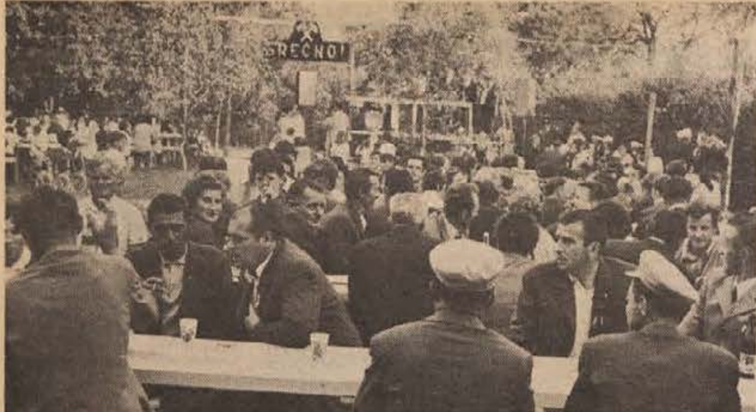
Zadnji rudarski praznik, ko je še večina kolektiva kočevskega rudnika skupaj, so praznovali 3. julija. Že letos bo odšlo precej rudarjev na prekvalifikacijo in rudnik bo v prihodnjem letu predvidoma zaprt