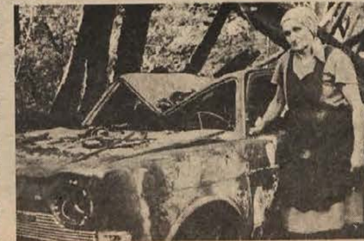
Obupana mati ob razdejanju, ki ga je povzročil ogenj.