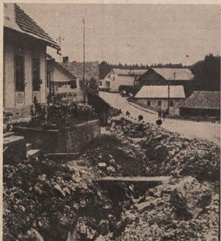
V Gradcu je te dni sicer še vse razkopano in razmetano, toda glavni cevovod novega vodovoda, ki bo navezan na črnomaljskega, so v kraju že položili. Vaščani Gradca in bližnjega Klostra bodo s prijavi in brezplačnim delom dali za vodovod nad 80.000 din. Do otvoritve glavnega vodovoda je še mesec in pol.

Slovesnosti v zvezi s proslavljanjem 500-letnice proglastitve Kočevja za mesto so se začele. Planinci so imeli 1. maja slavje pri Jelenovem studencu na Stojni. Pionirji šolskih športnih društev so imeli 6. junija veliko športno srečanje v vseh panogah med ekipami Kočevja in Delnic. V nedeljo, 18. julija, pa bo otvoritev filatelistične razstave, na kateri bodo razstavljene znamke, ki so veljale na območju Kočevske v obdobju od 1850 do 1971. Za to razstavo bodo razstavljali numizmatiki. A. A.