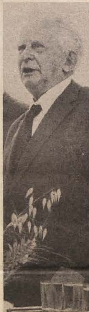
„Cilj vseh teh prizadevanj, taborov, ustvarjanja in srečavanja je kultura slovenskega naroda.“ je zaključil svoj govor Josip Vidmar, predsednik SAZU.