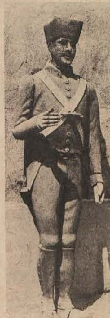
Francoski grenadir, ki se vedno počiva na podstrejšu Dolenjskega muzeja.

Na proslavi so v kulturnem sporu sodelovali: ženski pevski zbor in godba iz Črnomlja, recitatorji in tovarniška godba na pihala.