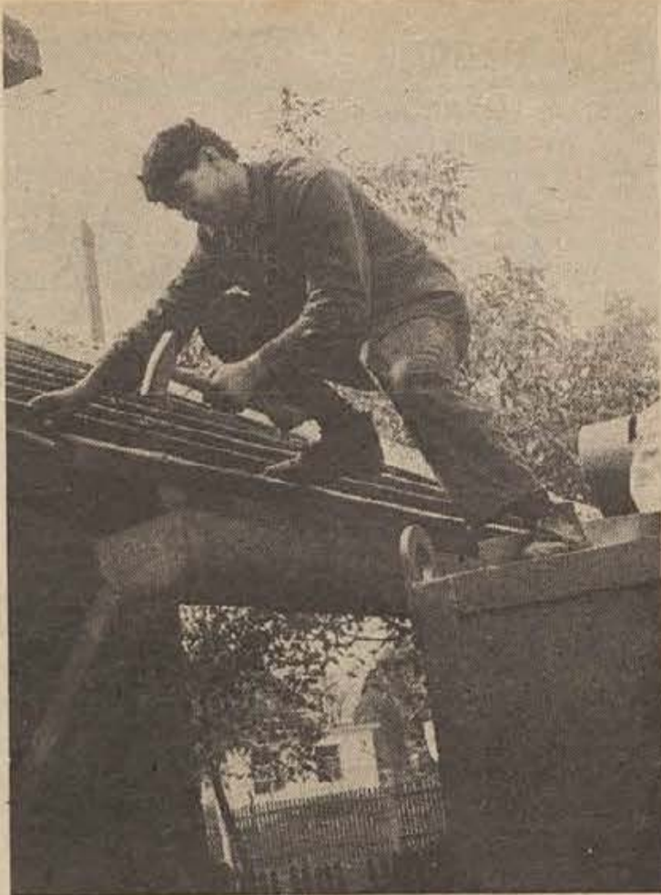
Kolektiv dobovske livarne dela v dveh razpadajočih zgradbah, zato komaj čaka, da se bo preselil v nove delavnice zunaj vasi. V stare prostore niti strojev ne morejo spraviti, in kot vidite na sliki, so morali najprej odkriti streho, šele potem so lahko postavili v delavnico nov stroj.