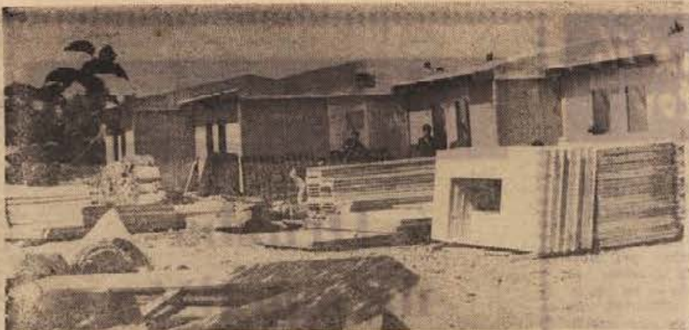
Naselje počitniških hišic za zdraviliščem v Cateških Toplicah je postavljen. V njem bo 212 ležišč. Skoda, da je dež zavrla delo, sicer bi se vanje že naselili vele-sejmski gostje.

■ KLJUB VSEM UGODNO. Svet politične skupnosti kot najvišji samoupravni organ v domovini v Poreču je na zadnji seji