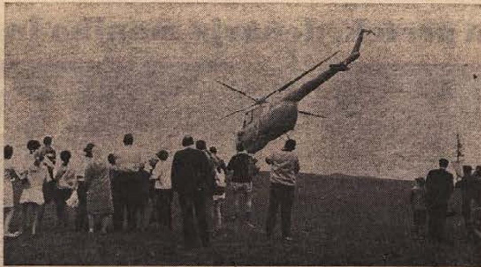
HELIKOPTER PRVIC NA LISCI. Minuli torek, 9. septembra, je prvi helikopter pristal na vrhu gore. Planinski mir je ropot motorjev vznemiril tudi med sobotno vajo enot teritorialne obrambe, ko sta ob velikem zanimanju obiskovalcev dva helikopterja izkrcala desantno enoto

Podrobneje bomo o izvajanih tovariša Vipotnika poročali prihodnje.