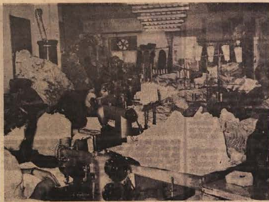
En sam pogled v konfekcijsko delavnico Zavoda za rehabilitacijo ROG v Novem mestu je dovolj zgovoren dokaz o tem, kako potrebni so zavodu novi poslovni prostori. Vse je tako nagnjeno, da se težko loči kup blaga od delavke, ter delavka od stroja

PREKRIVANJE STREH se je začelo že v poletnih dneh in se še vedno nadaljuje. Gradbeno obrtno podjetje ima še zdaj s tem polno roko dela, saj bi vsak rad skrpal luknje še pred jesenskimi delovjem. Dela ne manjka niti