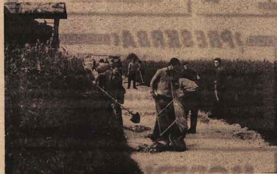
Prebivalci Orehovice in okolice so se zbrali in udarniško popravili cesto od Orehovice do Sentjerneja. Cesta je že drugo leto brez cestarja in je bila v tako slabem stanju, da se je voznik IMV, ki vozi po njej delavce, upri voziti. To je bil vzrok, da so je ljudje sklenili sami popraviti. Dokazali so, da se da z združenimi močmi veliko narediti in zaslužijo vse pohvalo. Komunalno podjetje pa bi kljub temu moralo nastaviti cestarja! Na sliki: prebivalci med delom na cesti

OKOLI ŠTIRISTO ŽENA BI SE RADO ZAPOSILLO