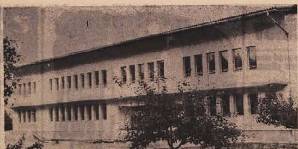
Gozdarski dom v Ribnici je končno po letih in letih gradnje le dograjen.