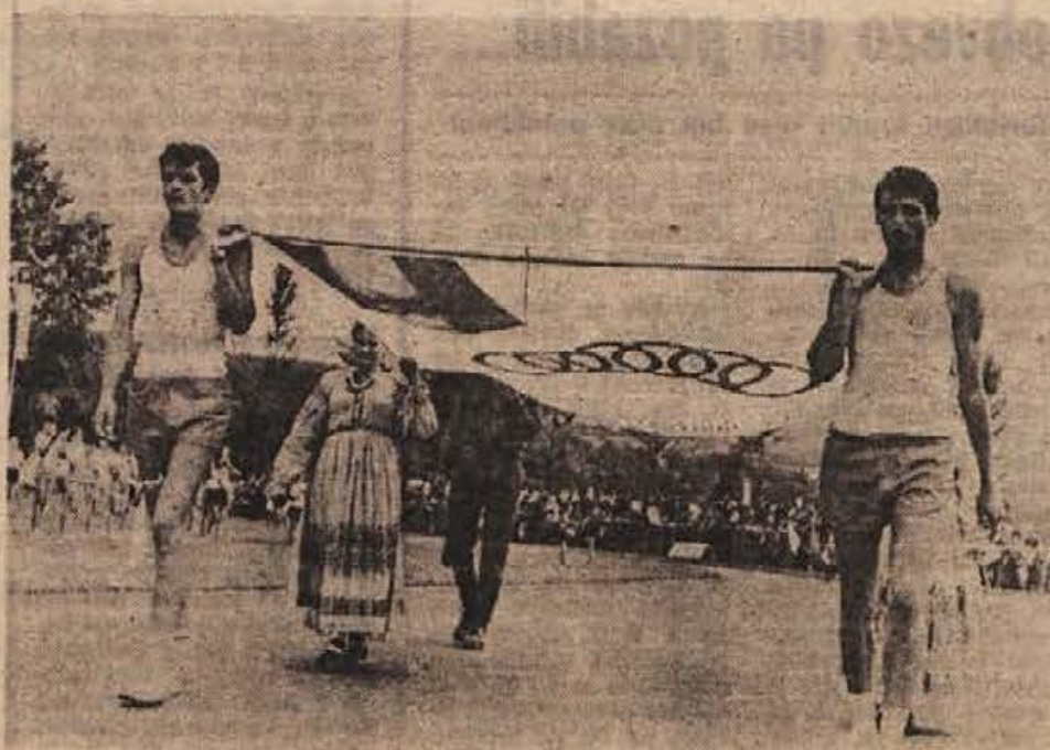
Simbol bratstva in enotnosti »Zletno zastavo« so nesli pred nastopajočimi mladinci iz Bosne ter pripadniki naše JLA