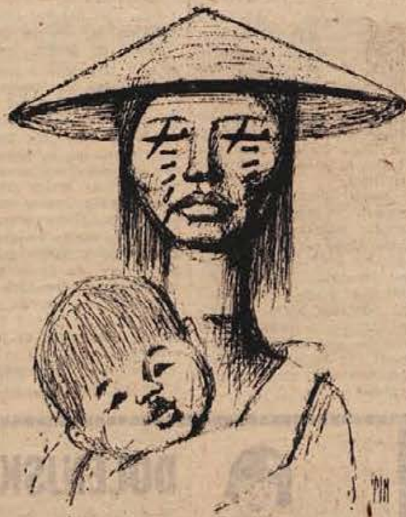
Mitelberg Louis Tim (FRANCIJA): BREZ BESED (ena izmed karikatur na I. mednarodnem bienalu karikatur »Brez besed« v Ljubljani). — Obiščite razstavo v ljubljanski Mestni galeriji in si oglejte dela svetovnoznanih karikaturistov iz številnih držav!