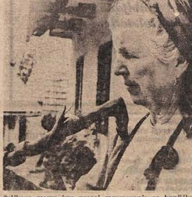
Zeljkovala ima precej razumevanja za konjičke svojega moža. Povedala pa je, da tudi ona ni kar tako. »Jaz sem specialistka za torte.« je dejala, »Spečem tako knjigo, da ne veste, če je prava ali ne.«