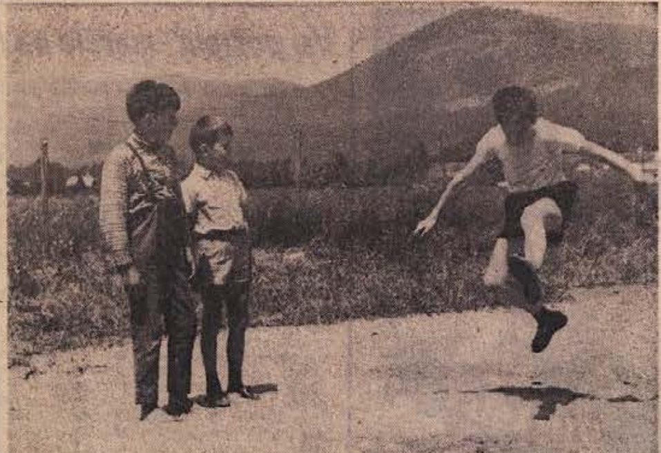
Takole se ribniški otroci kratkočasijo. Na igrišču pri domu Partizana preizkušajo kdo bo skočil dalj.