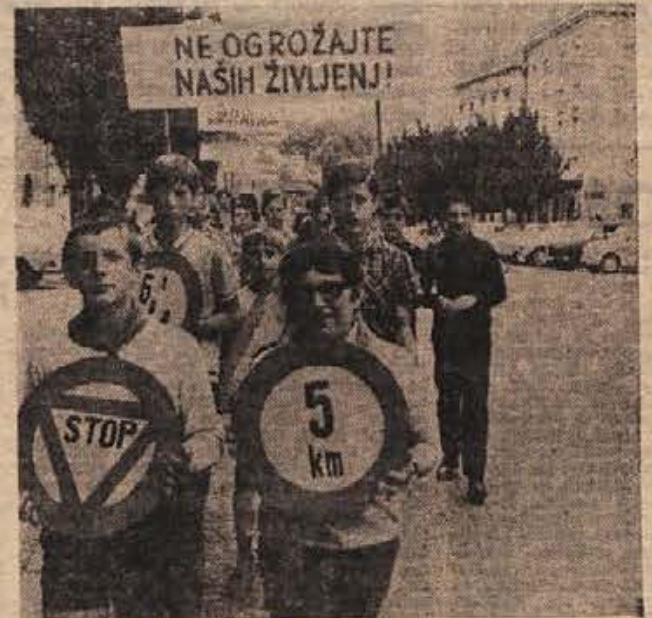
Okoli 400 učencev osnovne šole »Katja Rupena« je odšlo v terek opoldne na novomeške ulice, ker so s parolami opozarjali voznike motornih vozil, naj ne dirkajo, ker niso sami na cesti itd. V tih povorki so odšli pionirji od Kettejevega drevoreda po Cesti komandanta Staneta na Glavni trg do kandijskega križišča in po isti poti nazaj. V terek, ob dnevu varstva otrok v prometu, so bile po vsej novomeški občini številne manifestacije, v katerih so sodelovali pionirji-prometniki in prometni miličniki.

27-letni Anton Kobe z Dolza je v nedeljo, 15. junija, dopoldne z elektriko lovil ribe v potoku Klanfar pri Pangeré grmu. Ko je stopil v vodo, da bi pobral ubite ribe, ga je elektrika ubila.