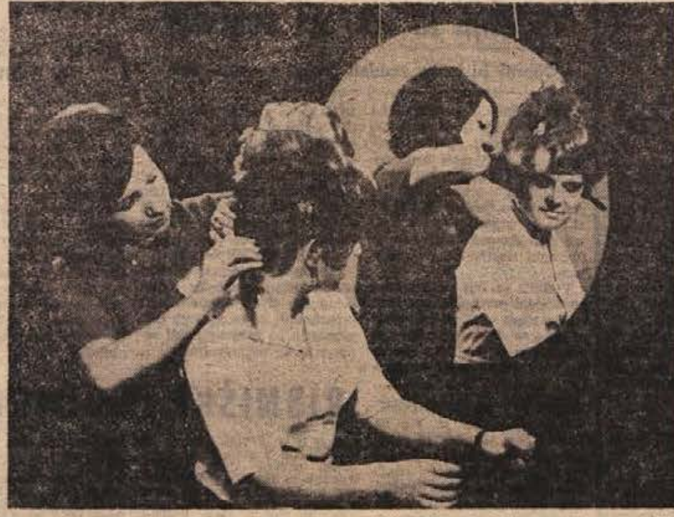
Se zadnja korektura pred ocenjevanjem. (Foto: M. Vesel).