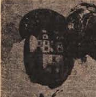
Mnogo truda in časa je treba, preden na pisanici nastane podoba

Nova osnovna šola bo sreča naših otrok — zato glasujemo zanjo na nedeljskem referendumu!