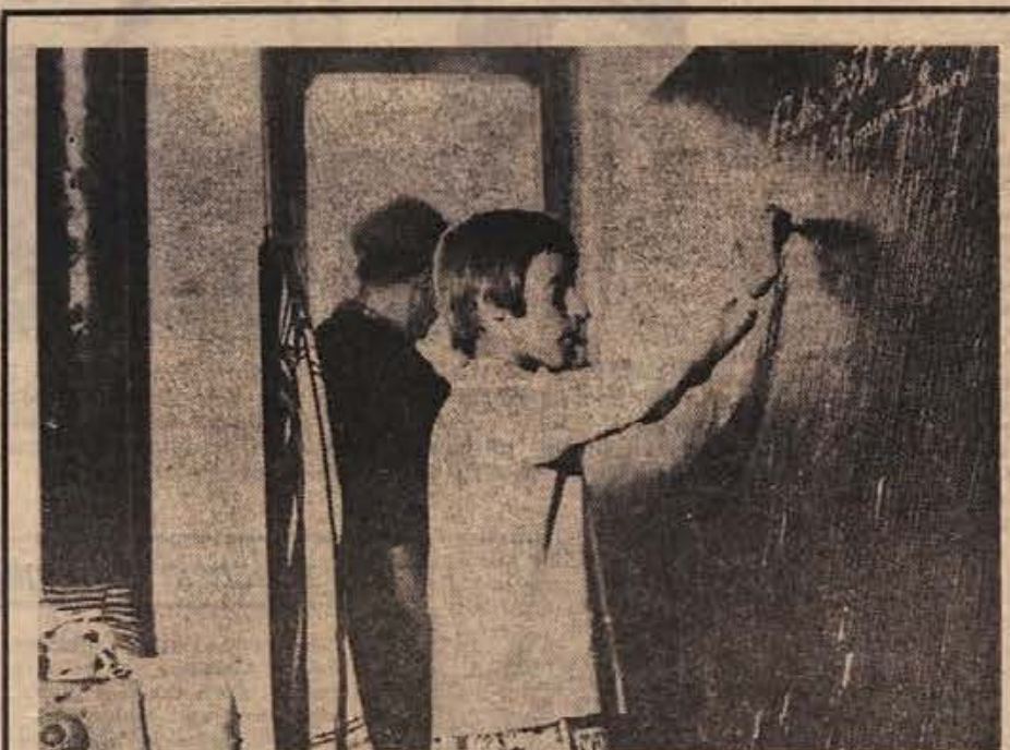
Pogledje v razred zaslihnih oddelkov krške osnovne šole, ki so v »sam-sloven bloku« (nadgrajeni stanovanjski hiši) na Vidmu: polovica tabele v temle razredu je skrite v kuhinjski niši in le del razreda vidi, kaj je na njej napisano... V teh učilnicah manjka zraka — namesto oken imajo okencal. Ko ne morejo več vzdržati, odpro vrata na stopnišče stanovanjskega bloka. Če bo nedeljsko ljudsko glasovanje sprejelo krajovni samoprispevek za novo šolo, bo krška mladina že čez nekaj let doživela zlate čase!