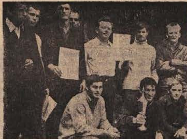
Ekipa gozdnega obrata Straza je osvojila prvo mesto na gozdarskem tekmovanju.