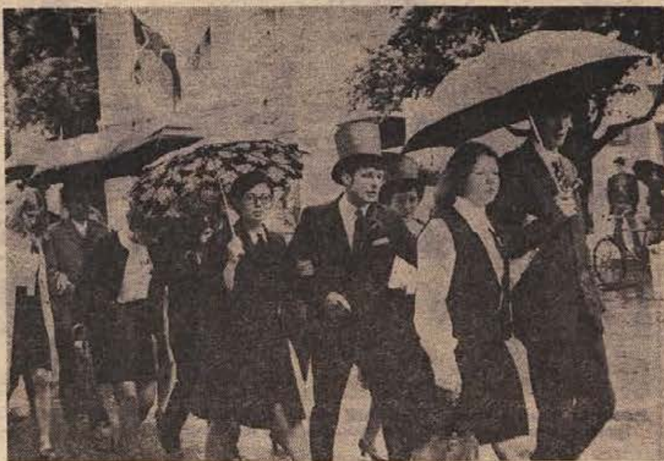
Od gimnazijskih klopi se te dni poslavlja v Brežicah enaindvajseti rod maturantov. Na sliki: sprevod po mestu.