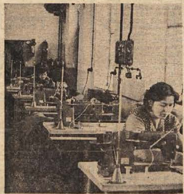
NOVA MOŽNOST ZA ZAPOSILITEV. Tovarna šivalnih strojev na Mirni je letos odprla nov obrat — šivalnico opreme za stanovanjske priklovice, kjer so zaposlili čez 20 ljudi, nekdanjih režijskih delovnih moči. Nove zaposlitve predvidevata tudi obrat MODNA OBLAČILA v Trebnjem in podjetje KEMOOPREMA. Na sliki je notranjost šivalnice.

Na jutrišnji seji aktivna na občinski upravi bodo vsi tisti, ki bodo sodelovali na zborih volivcev, prejeli vse potrebne materiale, pogovorili pa se bodo tudi o zadevah, o katerih bi lahko volivci želeli odgovore na zborih. V vseh krajih občine je bilo že 7. marca solo živahno. V Sevnici je bila akademija, ki se je je udeležilo veliko število žensk, v soboto pa sta obe sevnjski konferencijski podjetji privedli nabave za svoje delavke.