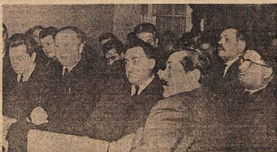
Podpiramo, vendar tudi zahtevamo svoje! Tako so menili poslanci, družbeno-politični delavci ter župani iz osmih občin, ko so se zbrali v Metliki na seji kluba poslancev