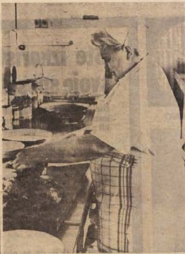
Za kuharice in natakarike ob dnevu žena ni bilo praznika. Gostišča so bila polna od petka do nedelje zvečer. Na sliki: pogled v kuhinjo Restavracije na Griču.