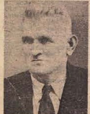
reim dobu brez besed. 1964. leta je v Podlipi pri Ajdovcih ugledal svet v kajžarski družini kot gluhoonem otroku. Tu, za kar ga je narava že ob rojstvu prikradala, je Grandovec

Vse življenje je živel zmerno in ni bil nikdar bolan. Za 85-letnico so se ga spomnili člani sindikata iz NOVOLESA in ga obiskali in obdarili ter mu zaželeli še mnogo srečnih let. A. V.