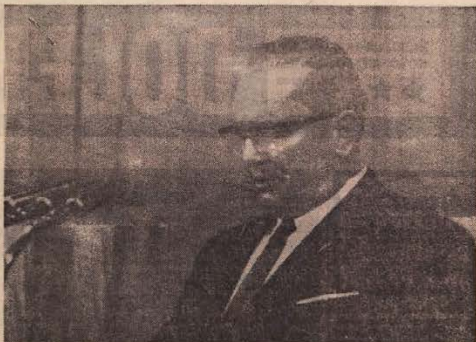
V BEOGRADU se je v Veliki dvorani Doma sindikatov v torek ob 17. uri popoldne začel deveti kongres Zveze komunistov Jugoslavije. Otvoritevna svečana seja je bila posvečena 50-letnici naše komunistične partije. Govornik na tej seji je bil tovariš Tito, ki so ga delegati pozdravili z navdušenim ploskanjem.