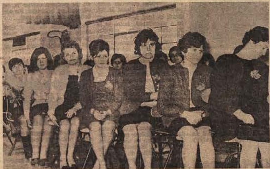
Tovarna perila LABOD v Novem mestu ima med 540 zaposlenimi v veliki večini ženske. 8. marec, ki je hkrati tudi praznik kolektiva, so proslavili v Novem mestu in v Krškem s pogostitvijo, z lepim kulturnim programom in z razgovorom o uspehih ter o svojih načrtih. Spomnili so se tudi upokojenk. Na sliki: članice kolektiva med proslavo

»Ena gospa je rekla, da bo predlagala naši občinski skupščini, naj s posebnim odlokom dopsrtno opreši plačevanja samoprispevka za novo šolo vse tiste brhne skoporitke, ki imajo, ročki, samo svoje hiše in nemi-ko limuzine, pa nič otrok ter se tete odpovedo desetaki ali dvosna na mesec, kot na primer NOVOTEKSOVI delavec...»