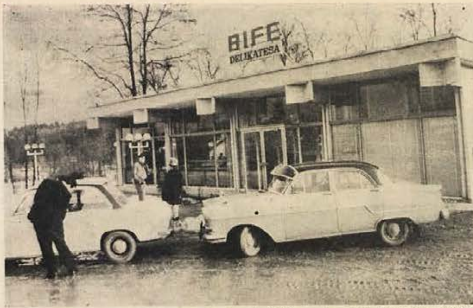
BIFE-DELIKATESA na Otočcu, ki so ga odprli tik pred novim letom, je projektiral in zgradil SGP »PIONIR« iz Novega mesta. Se ena delovna zmaga »PIONIRJA«, ki je v 20 letih zgradil po vsej Jugoslaviji več kot 2400 objektov visoke in nizke gradnje.