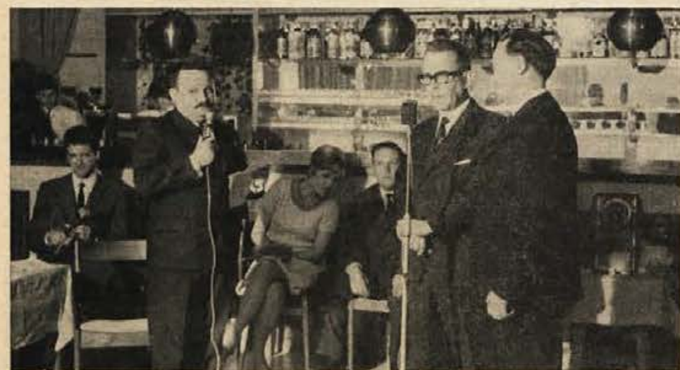
»Sefovski intervju« na lanskem novinarskem plesu

Potem sem z nogo v mavcu in bergljami prvič nastopila v začetku decembra na ustnem časopisu v Celju, nato pa tudi drugje. Mavec so mi sneli šele pred nekaj dnevi in sedaj moram nogo potrpežljivo razgibati...«