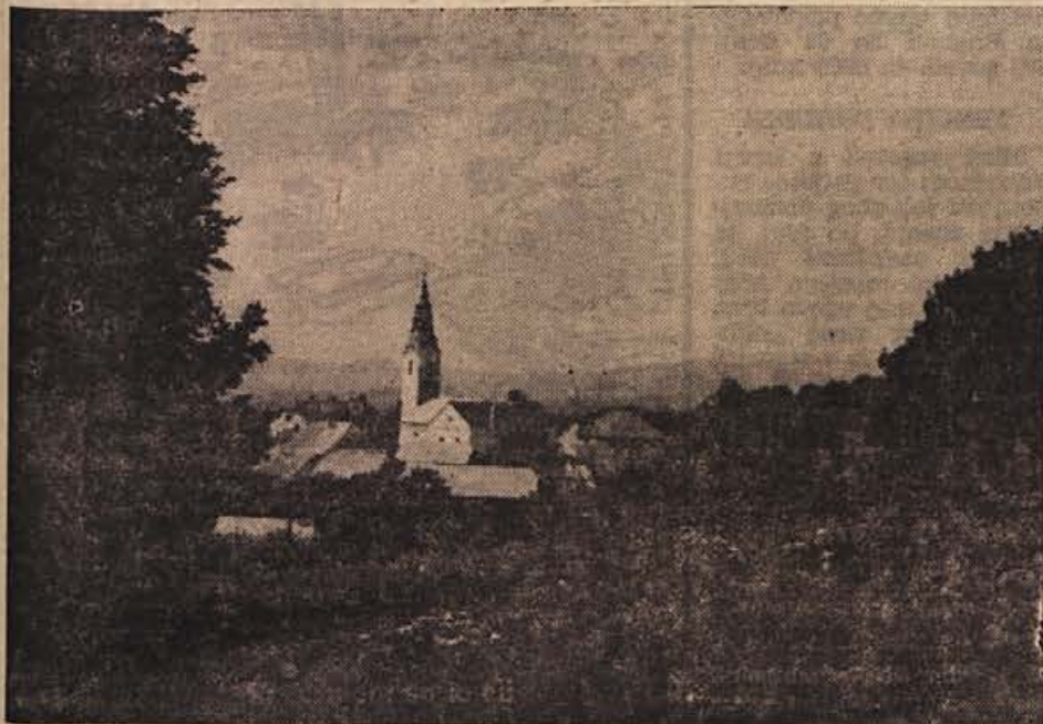
POGLED NA TREBELNO, KJER JE BILA USTANOVLJENA GUBČEVA BRIGADA

V okrilju prostranih stoletnih gozdov, sredi živopisnega mozaika njiv in vinogradov, razmetanih po strmih pobočjih in posutih z zidanicami kot z biseri, v taki idilični hrbovski pokrajini z lepim razgledom po Dolenjski stoji vas Trebelno nad Mokronogom. Vas kot vse druge — borba ljudi s siromašno zemljo za vsakdanji kruh, borba za napredek in boljši jutrišnji dan. Toda Trebelno bo za vedno zapisano v slovenski zgodovini. V čudovitem bukovem gozdičku pod vasjo je bila pred 25 leti, 4. septembra 1942, iz dveh bataljonov Krškega odreda in dveh bataljonov Zapadno-dolenjskega odreda ustanovljena slavna Gubčeva brigada. V njenih vrstah je bilo okrog 800 neustrašenih borcev, ki so že dan po ustanovitvi doživeli ognjeni krst na Blečjem vrhu, nato pa izkazali polno mero junaštva in poguma v nešteti krvavih borbah po Dolenjski in sosednji Hrvaški vse do zmagovitega pohoda v osvobodeno Ljubljano. Brigada je neštetokrat dokazala, da zaslužno nosi ime velikega voditelja naših hrabrih pradedov. Po napornih pohodih in hudih bojih se je rada vračala v svoj rojstni kraj Trebelno. Po mnogih letih se zdaj spet vrača, čeprav nepopolna in okrnjena, da obudi spomin na slavne septembrske dneve pred četrstoletja. Še poznim rodovom bo brigada pričala, kje in kdaj se je porodila naša ljudska vojska.