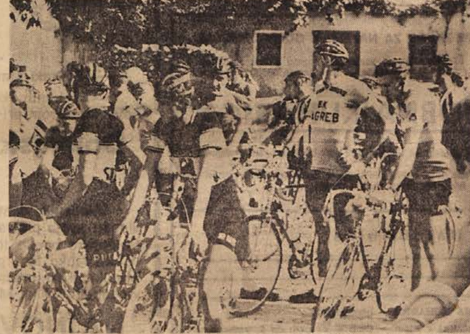
MEDNARODNA KOLESARSKA DIRKA »PO BELI KRAJINI« postaja ena izmed osrednjih poletnih športnih prireditev v Beli krajini in tudi tostran Gorjancev. Skoda le, da so organizatorji tudi tokrat premalo poskrbeli za popularizacijo sobotnih in nedeljskih tekem. Na sliki: pred startom v Metliki.

2. Ziberna (eC) 1:33,9; 4x100 m mešano: 1. Celulozar 5:04,8; 200 m hrbtino: 1. Marin (II) 2:34,4, 3. Cargo (Ce) 2:45,3; 200 m prsno: 1. Vrtnjak (Lj) 3:00,7 (rep. rekord za st. pionirje), 2. Ziberna (Ce) 3:01,4; 4x100 m crawl: 1. Celulozar 4:20,0; 1500 m crawl: 1. Cargo (Ce) 19:31,0, 4. Z. Gelb (Ce) 21:48,3; mladinke — 400 m mešano: 1. Pečjak (Tr) 6:26,4; 100 m crawl: 1. Vrnjak (Tr) 1:13,1, 3. Drugovič (Ce) 1:15,5; 4x100 m mešano: 1. Ilirija I. 5:39,2; 400 m crawl: 1. Vrnjak (Tr) 5:45,7, 5. Drugovič (Ce) 6:13,0; 100 m hrbtino: 1. Pečjak (Tr) 1:19,4; 200 m prsno: 1. Funduk (II) 3:16,2, 6. Drugovič (Ce) 3:34,8; 4x100 m crawl: 1. Ilirija 5:15,8, 5. Celulozar (M. Novak, I. Poljanec, N. Jenkole in N. Drugovič) 5:47,4; 800 m crawl: 1. Vrnjak (Tr) 12:08,4, 5. Drugovič (Ce) 13:03,8; 100 m prsno: 1. Funduk (II) 1:29,5; 100 m delfin: 1. Pribovšek (II) 1:52,2; 200 m hrbtino: 1. Pečjak 2:48,8. Končni vrstni red ekip: 1. Ilirija (Lj) 330, 2. Triglav (Kr) 292, 3. Celulozar (Kr) 197, 4. Rudar (Tr) 104, 5. Ljubljana 83, 6. Slavja (Verbo) 54, 7. Koper 25, 8. Radovljica 1-9in 9 Neptun (Celje) 19. Pavk