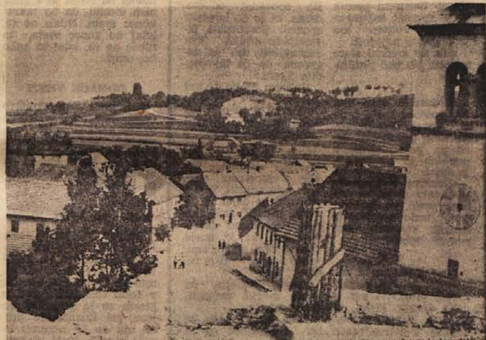
Ruševine mokronoškega gradu so pospravili in postavili spomenik borcem NOB, ki ga bodo odkrili v počastitev 25-letnice ustanovitve Gubčeve brigade. Tudi okolico spomenika so lepo uredili, tako da je zdaj podoba kraja mnogo lepša