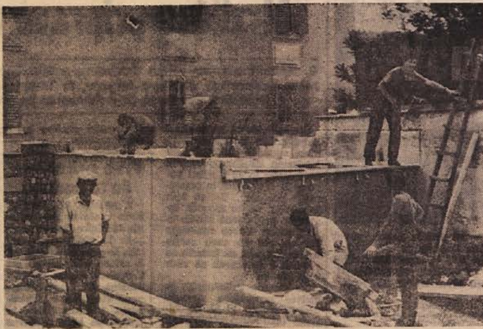
Nasproti kopalniškega doma v Dolenjskih Toplicah dokončujejo delavci podjetja Remont trafiko. Nova trafika stoji na mestu stare, ki so jo zaradi neprimernih prostorov sredi junija podrli. Predvidevajo, da bodo trafiko odprli v začetku septembra