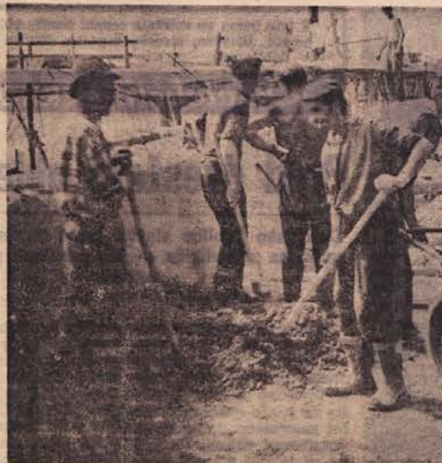
Na desnem bregu Save v Krškem betonirajo oporni zid za dohod na savski most.

Dejavnost turističnega urada v Brežicah je predvsem prodaja vozovnic, turističnih spominkov, organizacija izletov, rezervacija hotelskih sob, posredovanje potnih listov in vizumov itd. Letos je veliko zanimanja za izlete po domovini, posebno pa v tujino. V prvem polletju je pešalo v tujino že 25 avtobusov, predvsem v Italijo in Avstrijo, po domovini pa peljeta vsak teden povprečno po dva avtobusa.