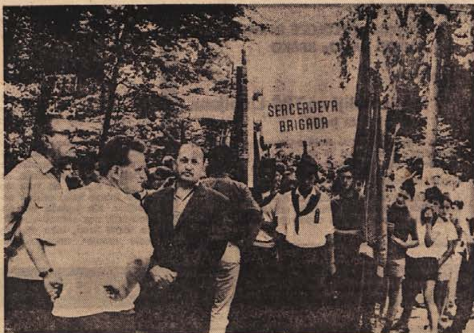
Minuli četrtek se je na partizanskem Rogu zbralo okoli 800 pionirjev iz vse Slovenije na proslavi 20-letnice ustanovitve pionirske organizacije. Razdeljeni v brigade so napravili pohod na Bazo 20, bolnico Jelendol in nadaljevali pot na Daleč hrib, kjer so imeli pravi partizanski miting. Pohoda so se udeležili tudi številni borci, ki so pionirjem pripovedovali o dogodkih med NOB na Rogu. — Na sliki: pred odhodom na pohod je pionirje pozdravil tudi predsednik ZZB NOV Slovenije in nekdanji komandant glavnega štaba slovenskih partizanov Franc Leskošek-Luka.

Godba na pihala je dvigala razpoloženje, ki se je po odkritju spomenika nadaljevalo v nadvse prijetni družbi v zgornjem delu vasi. Ves popoldan in pozno v noč so odmevali zvoki pesmi in glasbi v Gorjance. Ljudstvo je z borci vred slavilo veselo srečanje s »svojim bataljonom«, kakor smo ta dan ponovno slišali mnoge domačine, zbrane od blizu in daleč v partizanskem Vrhpolju. Tg