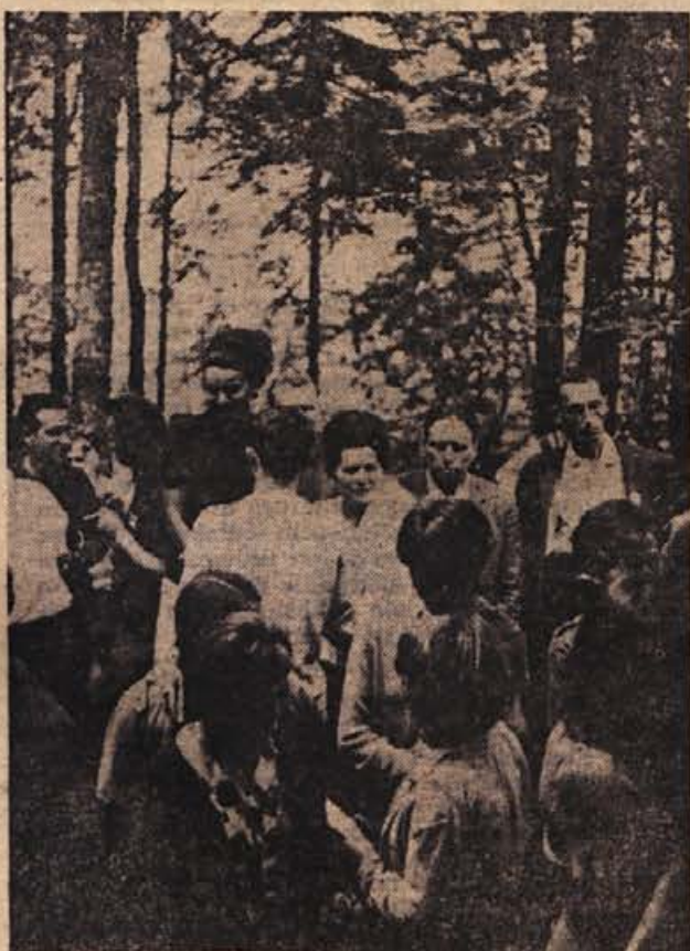
Obiskovalci planinske kočice na Bohorju bodo imeli odslej lep izlet k obnovljeni partizanski bolnišnici na pol ure oddaljenem Travnem laz, kjer se je v soboto zbralo na slovesnosti nekaj sto ljudi, borcev NOV in ranjencev, ki so se nekoč tu zdravili. — Na sliki: ena izmed prvih skupin nekdanjih ranjencev in borcev NOV ter izletnikov, ki je 22. julija obiskala Travnj laz in njegove čudovite hoste.

Trebanjska bencinska čr- palka je v zelo kratkem ča- su opravila obstoj, saj pro- da že več goriva kot mar- ketarja starejša in bolj zna- na Petrolova črpalka. Zato ni čudno, da so se pred ne- kaj dnevi zglasili pri obči- nski upravi predstavniki tega podjetja in zahtevali, naj bi čimprej uredili dokumenta- cijo za gradnjo še ene čr- palka na drugi strani ceste. Po njihovem zagotovitvi bi lahko začeli takoj graditi, ta- ko da bi črpalka lahko za- čela prodajati gorivo že pro- ti koncu letošnjega leta.