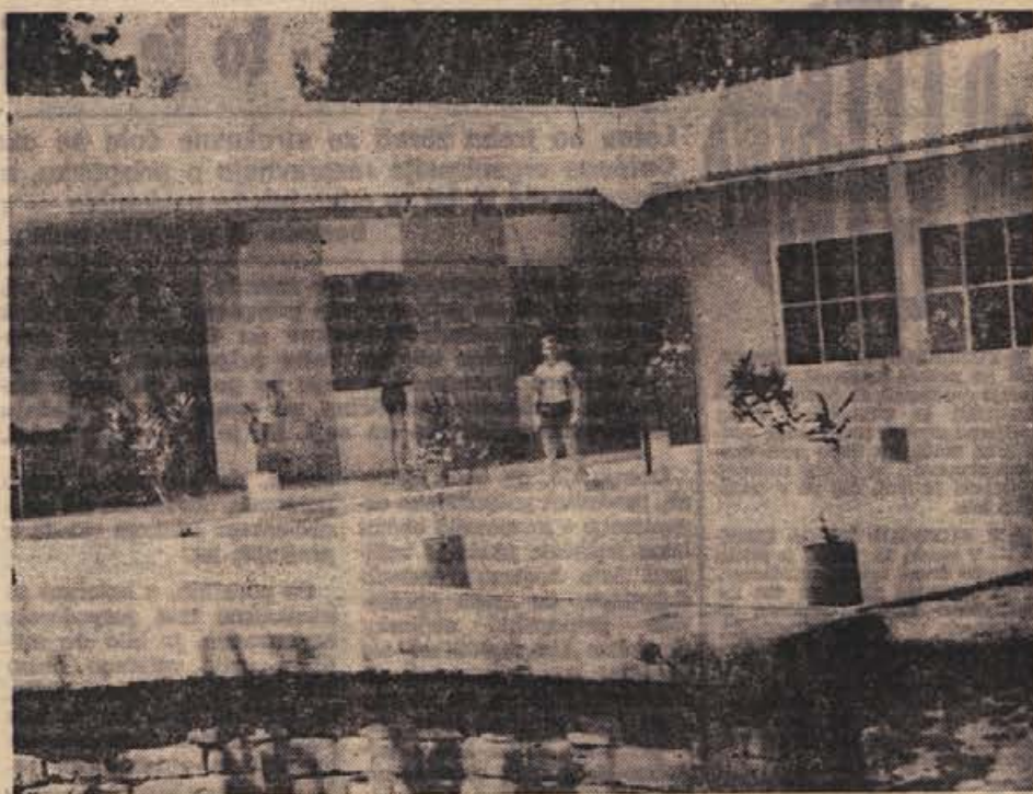
LESENEGA KOPALISCA V METLIKI ni več. Pred kratkim so ga podrli in zgradili sodoben objekt, v katerem so: restavracija, kuhinja, sanitarije ter več prostorov za omarice in kabine.

Več kot 60 mater na področju občine Črnomelj je lani za svoje nezakonske otroke zahtevalo višjo preživnino. Sodišče je okoli 30 primerov že obravnavalo in določilo, da morajo očete nezakonskih otrok plačevati povprečno 9000 S din na mesec.