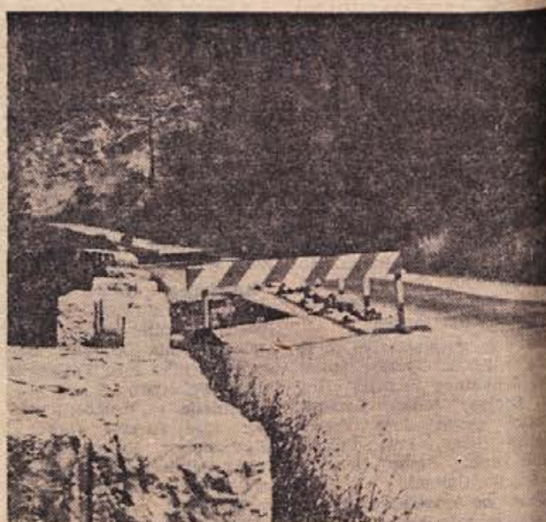
Aprila letos se je pogreznil del cestišča pri Dolenjskih Toplicah. Do sedaj, ko gre skozi Dolenjske Toplice nekaj sto avtomobilov na dan, so postavili le opozorilne deske! Morda čakajo odgovorni činitelji na težjo nesrečo ali pa na konec letošnjega mednarodnega turističnega leta?

Prizadete strokovne šole z učnim kadrom in dijaki vred, občinska skupščina, družbenopolitične organizacije in drugi, ki si prizadevajo za nemoteno delo strokovnega šolstva, z velikim zanimanjem pričakujejo, kaj se bo izcimilo iz priporočila delovnim, predvsem gospodarskim organizacijam. Pričakovanje je tolikanj bolj dramatično, ker se vsi zavedajo, da je obstoj strokovnega šolstva potisnjen v roke organizacijam, ki so ta čas edine sposobne rešiti strokovno šolstvo.