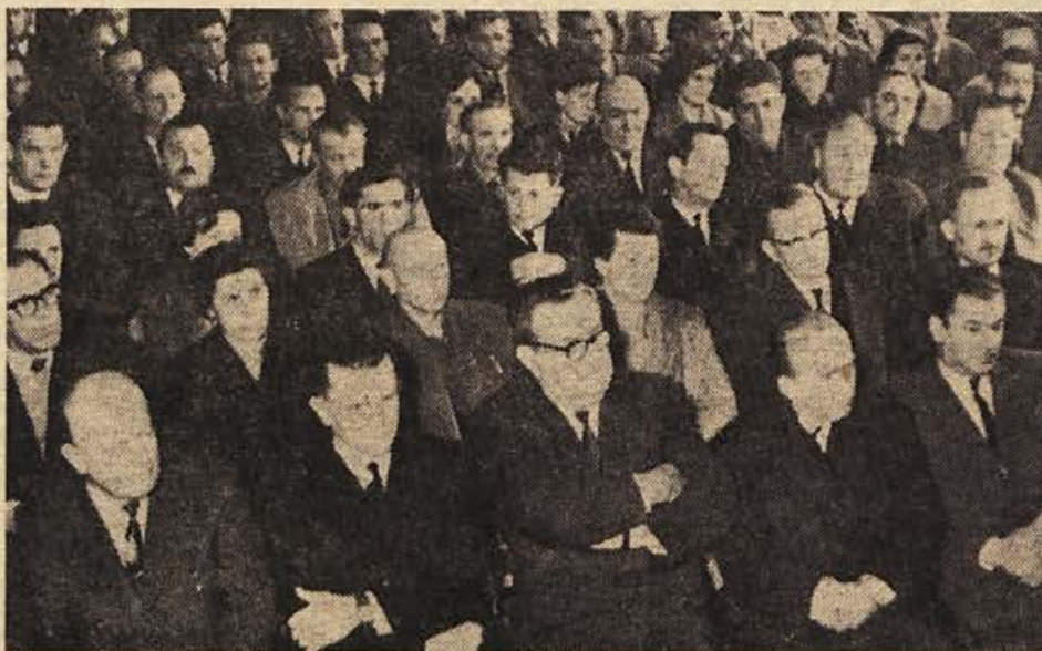
Odborniki obeh belokranjskih občinskih skupščin z bivšimi borci belokranjskega odreda na skupni seji v Semiču, kjer so podelili domicil Belokranjskemu odredu. Med njimi je bil predsednik ZZB Slovenije Franc Leskošek-Luka

Na petkovi seji je bil precejšen del razprave posvečen kadrovanju v bodoči občinski komitej. Izdelali so že predlog za izvolitev novih članov in vodstva, o njem pa bo še pred občinsko konferenco, ki je predvidena v drugi polovici meseca maja, razpravljalo članstvo v osnovnih organizacijah.