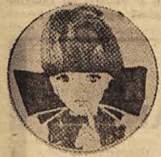
je ZVITOREPEC Zato vsak četrtek kupim ZVITOREPCA

PST! Zelo zaupno! moj najboljši in najljubši prijatelj!