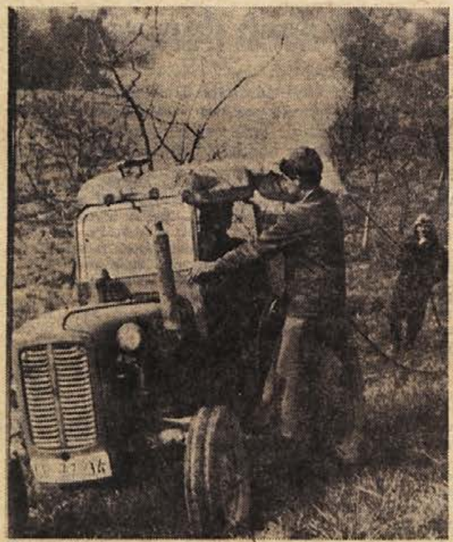
V času, ko se popje nopenja, je zimsko škropljenje najbolj učinkovito. Tega se zavedajo tudi v sevnškem Kmetijskem kombinatu, ko so prejšnji teden hiteli škropiti sadno drevje v nasadu pri Sevnici.