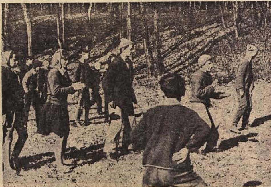
DAN POMLADI so učenci V. c in d osnovne šole v Sevnici izkoristili za izlet v naravo, kjer so se pomerili »med dvema ognjema«

Domačini so prikazali eno najboljših igrar, odkar tekmujejo v republiški ligi. Vsi igralci so se nadevje trudili in vodstva niso spustili iz rok vse do konca. Tudi tokrat se je odlikoval predvsem prodorni Bosina. Srečanje se je odigralo okrog 300 gledalcev. Za Brežice so nastopili: Mars, Rovani 5, Setina 4, Kuzel, Jurečič 3, Bosina 5, Paulič 3, Avsec 1, Degen, Novak 1, in Bergič. — Prihodnjo nedeljo bodo gostovali tudi člani v Kranju, kamor bo skupaj z ženskimi odpotovala še mladinska ekipa.