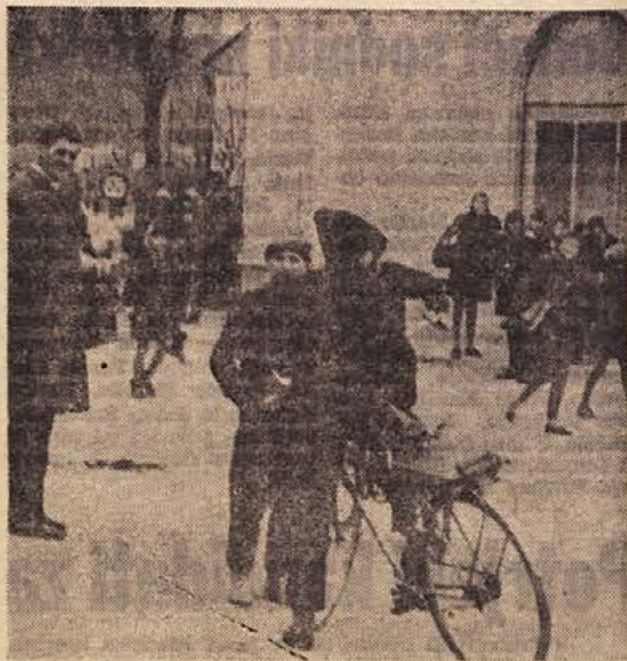
POUKA JE KONEC, učenci pa so se zapodili skozi vrata šole, kot bi ne hoteli nikoli več nazaj. Temu se ne smemo čuditi, saj je šola v Mirni peči prej podobna razpadajočemu gospodarskemu posloppju kot izobraževalni ustanovi. Na javni tribuni so občani nedavno poudarjali, da tako ne sme več naprej, da pa bi Mirna peč letos dobila novo šolo, ni upati in ni možnosti. Sicer pa je nova mirnopenška šola na prioritetni listi in se s tem lahko tolažijo učenci, učitelji in starši. — Na sliki: mirnopenški učenci se peš ali s kolesi odpravljajo domov

Kaj želite kot direktor pomembnega podjetja, ki ga širak krug ljudi