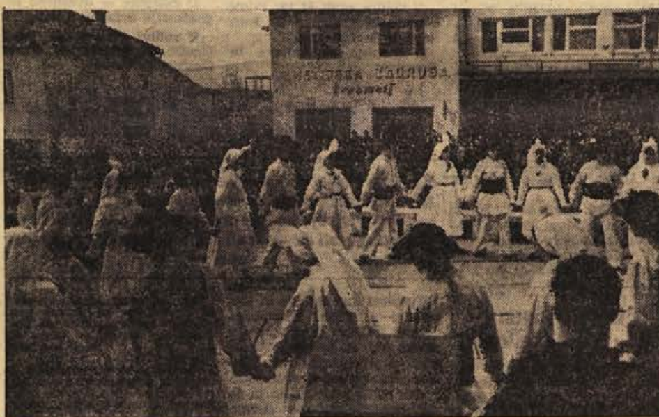
PIONIRSKI MITING V ČRNOMLJU: Precejšnja množica — posebno veliko je bilo mladine — se je v ponedeljek dopoldne zbrala pred pleščadjo Prosvetnega doma v Črnomlju. Preden so odpravili na pot kurirsko pošto, so šolarji izvedli kulturni spored. Na fotografiji je folklorna skupina domače osemletke