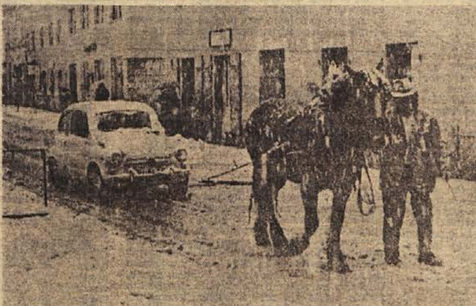
Letošnja muhasta zima, ki se je tako zavlekla v pomlad, marsikomu prav krepko ponagaja. Pravo aprilsko vreme in »zadnji sneg« sta posebno prizadela avtomobiliste, ki so si morali pomagati tudi s pravimi konjskimi silami. Fičku na naši sliki je manjkala prav ena, da je v hudem snežnem metežu lahko prevozil Ribnico

Začetek ob 8. uri zjutraj na dvorišču hotela KANDIJA.