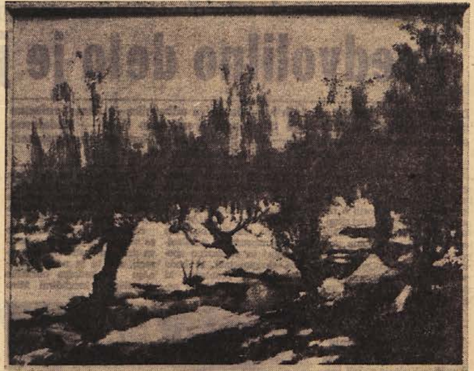
Miro Kugler: ZIMA

Zanimanje za turizem nameravamo vzbuditi tudi med mladino. V osnovnih šolah bodo predavanja o turizmu,