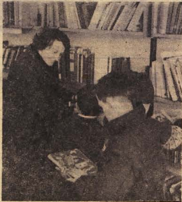
Kočevska knjižnica je lepo urejena in tudi zadovoljivo obiskana. Zvesti bralci so tudi mladi: cicibani, pionirji in mladinci, za katere ima knjižnica poseben oddelek.

Člani političnega aktiva so se strinjali s predlogom aktivno družbeno-političnih organizacij, naj bi za novega možnega predsednika občinske skupščine kandidiral Miro