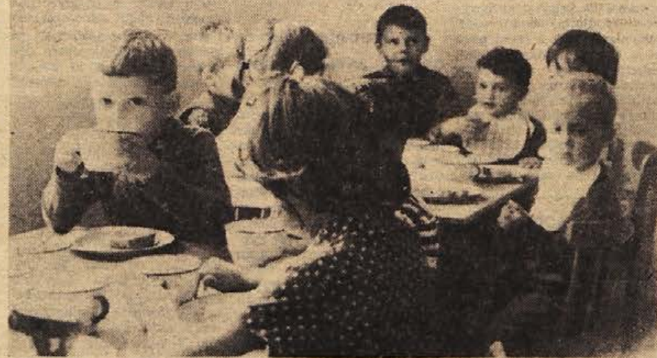
V novem vrtcu za predšolske otroke, ki je bil odprt septembra v naselju na Mestnih njiyah v Novem mestu, je prav prijetno. Na fotografiji: otroci pri dopoldanski malici

Komisija za vzgojo in varnost v prometu pri občinski skupščini v Novem mestu bo v ponedeljek, 13. februarja, popoldne podelila petnajstim voznikom plakete vzornega voznika. Zanimivo je, da bo dobila plaketo tudi voznica z dovoljenjem iz leta 1938. S tem bo imelo plakete vzornega voznika v novomeški občini že 64 poklicnih voznikov in voznikov amaterjev.