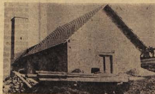
Prizadevni gasilec s Studenca so gasilskemu domu prizidali tudi dvorano, ki je bila na Studencu že nujno potrebna. Upajo, da bo ta dvorana še letos dokončno urejena.

IGRIŠČA BODO OKOLI ŠOLE. Čeprav so bila športna igrišča po prvotnem urbanističnem načrtu Sevnice predvidena v bližini kopitarne, je občinska skupščina pred kratkim potrdila spremembo te zamisli. Po novem naj otroško varstvo, ki je bila pred bi bila igrišča v okolici šole, ker tam ne bo stala bodoča stavba za videna na prostoru med bencinsko črpalko in šolo. Sprva so menili, da bo bližnja bencinska črpalka ostala na sedanjem mestu le nekaj let, vendar se je pokazalo, da motorizacija tako hitro napreduje, da bo črpalka lahko ostala tam, četudi bi zgradili novo na desnem bregu Save.