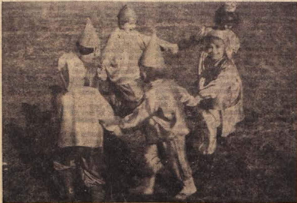
Torkov pustni ringaraja varovancev otroškega vrtca v Brežicah

V občini je 332 obrtnikov V brežiški občini je 45 trgovskih poslovalnic, 10 gostinskih obratov v družbenem sektorju in 35 zasebnih gostiln. Družbenih obrtnih organizacij je 14, zasebnih obrtnikov pa 332.