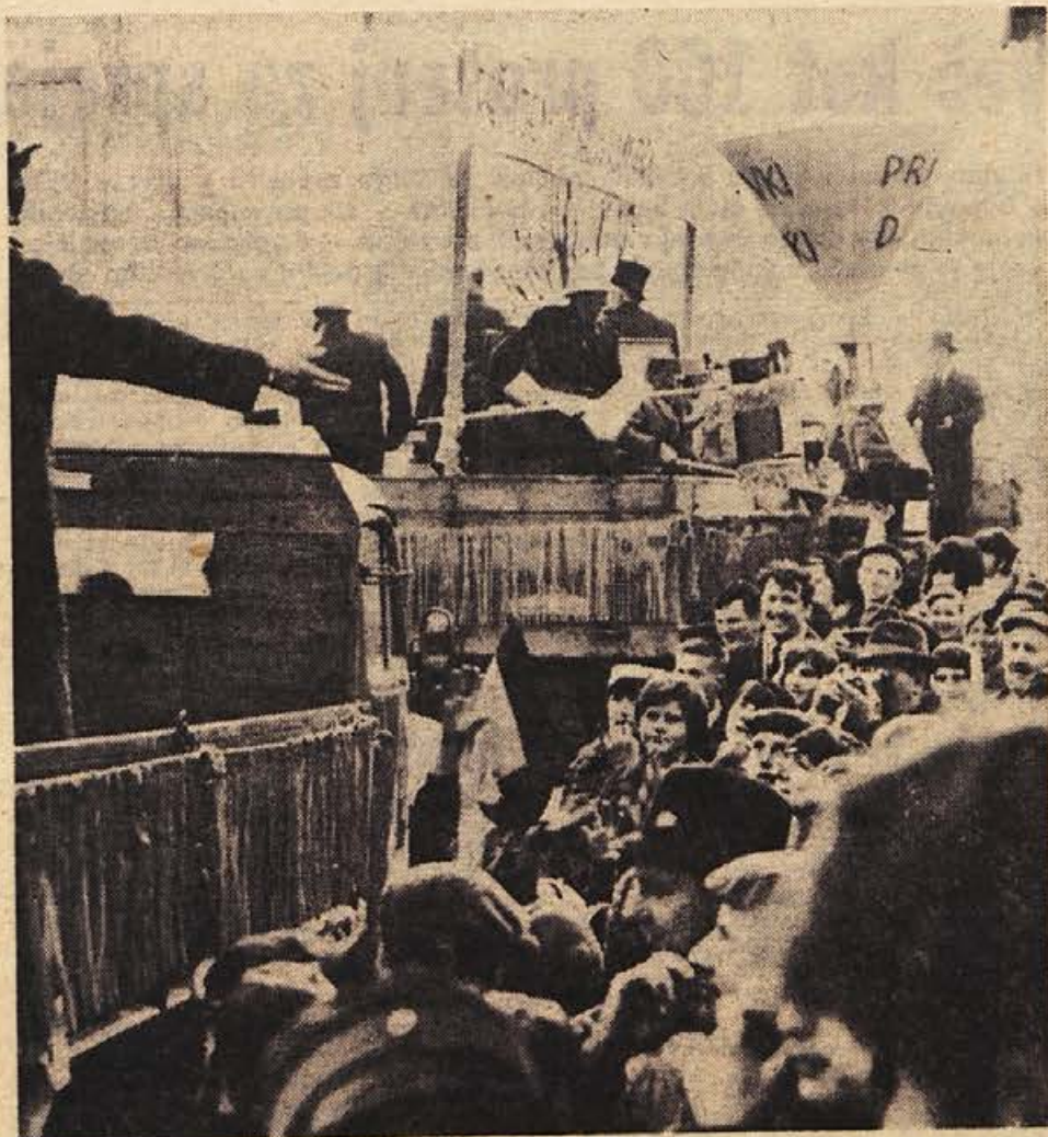
TEZAVE OBCINSKEGA PRORACUNA. Takole so metliški pustni veseljaki v nedeljo predstavili tudi širši javnosti težave svoje proračunske politike: na prvem vozu davčni lijak, na drugem prazno občinsko blagajno, na tretjem pa domačo kovnico denarja