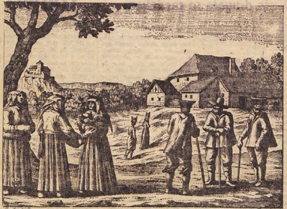
IZ VALVASORJA: DOLENJCI

Za fevdalno posest na Dolenjskem je tudi značilno neverjetno hitro spreminjanje obsega posestev in menjavanje njihovih gospodarjev, razen za samostanska posestva (Stična, Kostanjevica), posest freisinskih škofov ter za posestva večjih in pomembnejših fevdalnih rodbin. Valvasor pravi: »Zelo redko je najti gospodstvo ali graščino, ki bi dolgo lahko kazala svojo staro moč in bogastvo. Kmalu namreč izrgajo posamezne dele zemljišč iz posestva s prodajo, zamenjavo, poroko, dedovanjem, z delitvijo deležev med otroke, z zastavami, zaradi sporov ali pa z volilni, darili in pokloni samostanom.«