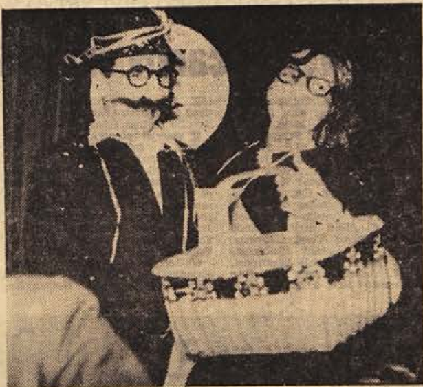
Gostje od blizu in daleč, ki so se v soboto zvečer zbrali v prostorih nove restavracije hotela Grad Otočec nad Krko, so preživeli večer in urice od ranega jutra v zares veselom razpoloženju. Komisija iz vrst gostov je tale par izvolila za »najboljši maski večera«; razdelili so tri lepe nagrade, steklenice fruškgorskega biserja pa so bile tolažilne nagrade za pohvaljene maske.

Vrstni red: Levičar 8,5, Rupar 7,5, inž. Kurent 7, Hrovat 6, Turnšek 5, Pavliha 4, Čolarič 3, Zupanc 2 ter Zorko in Špiler 1.