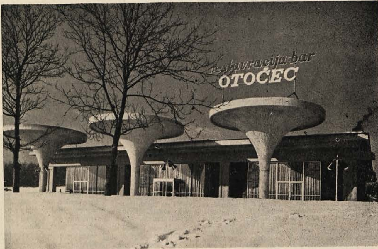
Restavracija »Otočec«, v kateri smo nocoj zbrani, je projektiralo podjetje EMONAPROJEKT iz Ljubljane; arhitekt stavbe in notranje opreme je Miloš Lapažne, dipl. inž. arh., statik pa je bil Dore Martinjak, dipl. gradb. inž. Gradilo je podjetje PIONIR iz Novega mesta, investitor pa je bil kolektiv hotela Grad Otočec

Danes spremljivo brez padavin, bo pa hladneje. V nedeljo, 29. I., pričakujemo suho oz. lepo vreme in nekoliko hladneje. Okrog 30. I., a najkasneje 1. 2. ponovna ohladitev s snegom do nižin, od tu dalje spet jasno in mrzlo.