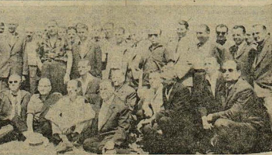
Borce Cankarjeve brigade so se po nedeljskem slavju na Javorovici tudi skupaj slikali