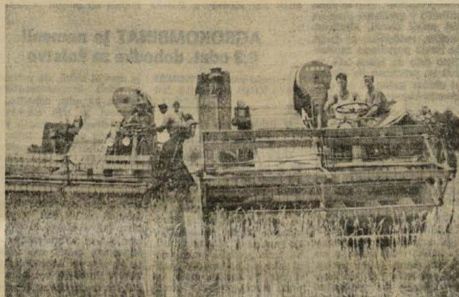
Kmetijski obrat Draškovec je te dni končal z žetvijo pšenice, ki je letos zelo dobro obrodila. Pridelali so jo okrog 112 ton. Na sliki: s kombajnom je šlo delo hitro od rok.

Prošnje pošljite najpozneje do 31. 7. 1966 na upravo KZ Brežice.