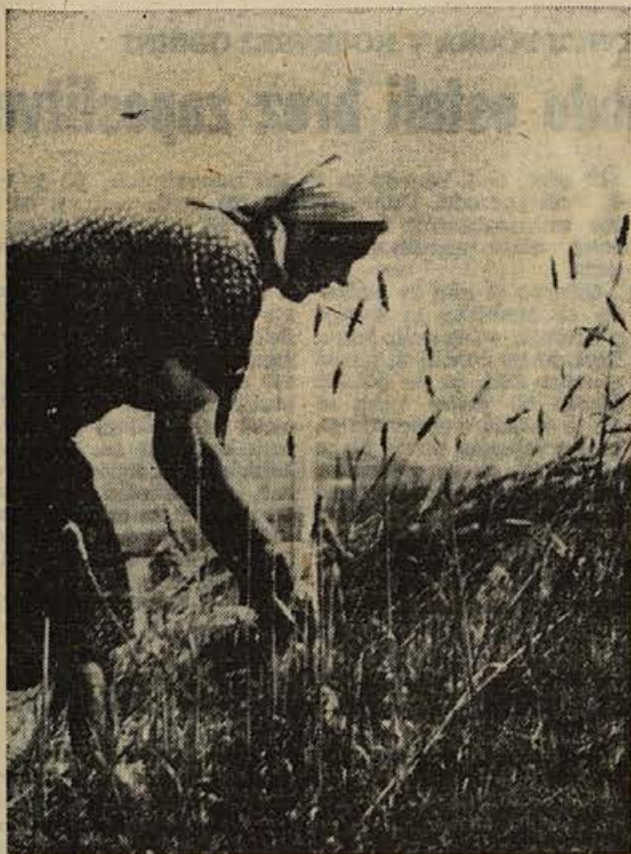
Zadnji snopi že padajo. Izredno dobra letina pšenice po Dolenjski je, razen tam kjer je mlatila že toča, razveselila žanjice in gospodarje.