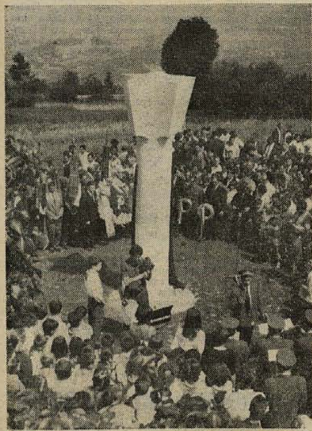
Lepšega mesta za postavitev spomenika na Javorovci skoraj niso mogli izbrati. Od tod je lep razgled po vsej Dolenjski, od Novega mesta pa tja do zagrebškega predmestja. Na sliki: svečanosti ob odkritju se je udeležilo več kot 1500 ljudi. Globoko v ozadju Sentjerne in okolica.