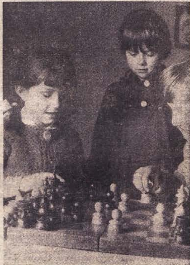
PARTIJA SAHA SE S POMOČJO »KIBICA« NAPETO ODVIJA. SKUPINA SOLARJEV V ČRNOMALJSKEM VRTCU PREŽIVLJA TAKO SVOJ PROSTI ČAS, NJIHOVE MAME PA SE V SLUŽBI LAHKO BREZ SKRBI ZANJE POVSEM POSVETE DELU. SMO ZE POVŠOD ZAGOTOVILI ZAPOSLENIM ZENAM TAKO OTROŠKO VARSTVO?

In taka, kakršna je, je Zveza komunistov poglajala med ljudstvom globoke korenine. Zaradi tega po pravici lahko rečemo, da VIII. kongres ni samo njen kongres, ampak je tudi naš, to je kongres nas vseh. Njegove težnje bodo težnje vseh Jugoslovancev in njegovi sklepi bodo sklepi vseh članov jugoslovanske socialistične skupnosti. Takega se veselimo in takemu želimo, da bi bil pri svojem delu čimbolj uspešen v korist nadaljnega še hitrejšega napredka naše socialistične družbe in za blagor vsega človeštva, ki vidj v naši Zvezi komunistov Jugoslavije zanesljivega, neomajnega bojavnika za mir.