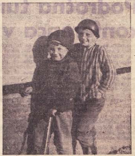
Navihana mlada prijateljka sta doma iz Sentlenarta pri Brežicah. Mlajši se najraje zabava z vožnjo na skirci, starejši pa uživa kot gasilec. Celado si je sposodil na bližnjem skladišču Odpada. Pravi, da je tam veliko zanimih reči za mlade raziskovalce!