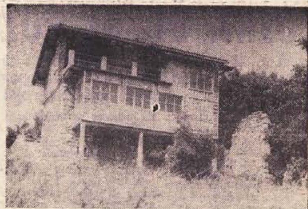
Lovski dom na Toplem vrhu je prikupna turistična in izletna postojanka — obiščite ga, prijetno vam bodo postregli!

Vsem, ki so kakorkoli pomagali prebivalcem vasi Bistrica in članom lovske družine Loka pri elektrifikaciji, se prav lepo zahvaljujemo! J. Z.