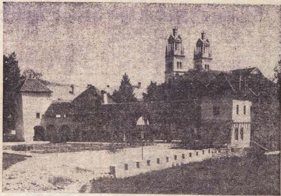
Ribnica na Dol.: stari grad in muzej