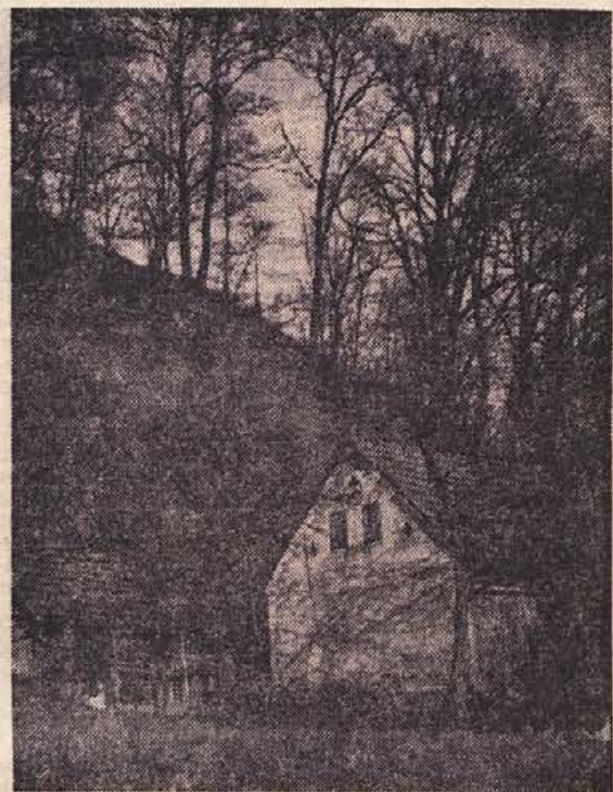
Jesenska podoba iz okolice Sevnice