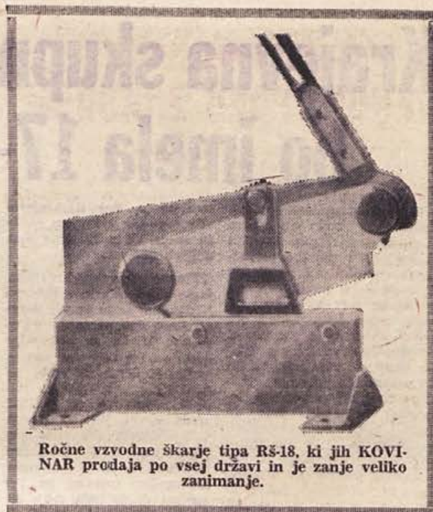
Ročne vzvodne škarje tipa RŠ-18, ki jih KOVINAR prodaja po vsej državi in je zanje veliko zanimanje.