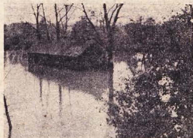
»Topla Kolpa«, o kateri radi povemo pletli toliko lepega, je ob zadnjih velikih nalivih pokazala tudi svojo drugo podobo: v Metliki je zelo narasla in vdrla v kabine kopalnišča ob reki