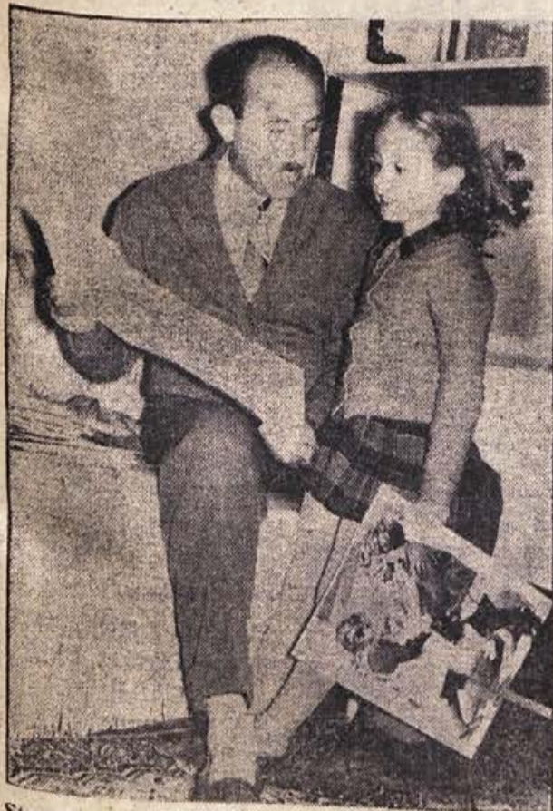
Strog sodnik v službi je doma dovzetan poslušalec — hčerka je namreč oster kritik njegovih umetniških fotografij...

Zadeva je čedalje bolj vodenela. Sodniku ne sme manjkati spretnosti, če hoče najti krivce, kadar se obtoženi dogovorijo za enoten, največkrat skonstruiran zagovor.