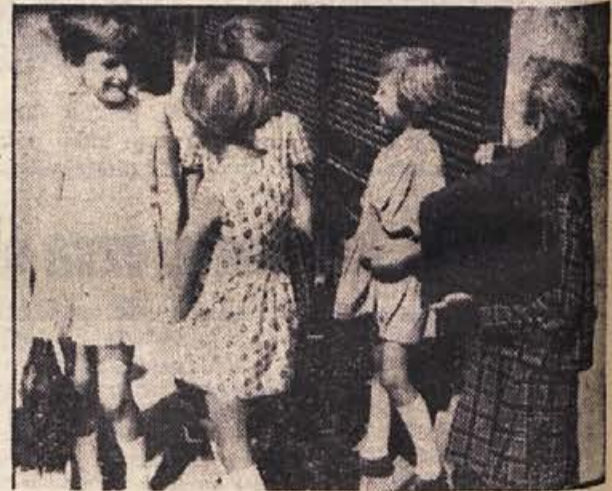
SLIKA TEH DNI: koliko važnega se morajo pomeniti še potem, ko že zapustijo šolske klopi in se napotijo domov k mamicam in očkom, da jim bodo povedale vse, kar so ta dan doživele novega! Tale skupinica iz Brežic ni prav nič drugačna!

Sovjetska zveza nastopa po sejmi v tujni z vedno večjim uspehom tudi kot proizvajalec predmetov za široko potrošnjo. Stroji za tekstilno industrijo, avtomobili, čudovita krzna, pa tudi radijski aparati in izdelki optične industrije privabljajo številne obiskovalce. Vsa sovjetska industrija je že od 22. kongresa partije v znamenju velikih vlaganj v kemično industrijo. Proizvodnja mineralnih gnojil bo v sedemletnem obdobju povečana štirikrat, proizvodnja plastičnih mas in sintetičnih smol sedemkrat, zgradili bodo več kot dvesto novih tovarn in vložili v to panogo več kot 45 milijard dolarjev.