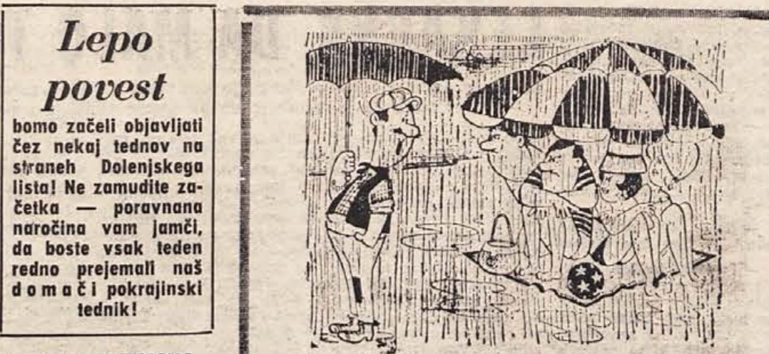
— Ce bo tako deževalo ves teden, bo za solato kar dobro...

Ta teden posebnih novic o trojčkih ni, o stanju v