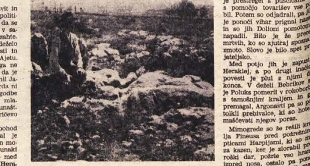
Tajinstveno sled na gmajni v Kozinj so prvič fotografirali pred prvo svetovno vojno. Kjer kamniti pragovi prekrivajo njeno smer, je vklesana v skalo

imenovali Argo. Delo je vodila sama boginja Atena in ladja je bila iz lesa, ki v morju ne gnije. Bila je lepo okrašena in tako lahka, da so jo junaki lahko nosili na ramah. Argo je bila prva ladja, s katero so si Grki upali na odprto morje. Potem so se vrstila razbur. Najprej jih je vihar vrgel na Lemnos, otok žensk, ki so pred tem iz ljubosumnosti pole svoje meje. Argonavte so lepo sprejeli in od tedaj lepota jih je po dolgem času končno odrgal Herakleje in jih spomnil njihovega skupnega cilja. Na poti je ležala še dežela prijazen Dolionov. Ti so jih lepo sprejeli, pač pa so jim zagovorniki orjaki, katerih rod je bival v sosesčni hoteli e sklamali zapreti izhod iz pristanišča. A čuječi Herakleje je prestregel s puščicami s pomočjo tovaršev vse pobili. Potem so odjadrali, pa jih je ponovih vihar prignat nazaj in so jih Dolionci pomotoma napadli. Bilo je že precej mrtvih, ko so zjutraj spoznali smoto. Slovo je bilo spet prijateljstvo. Med potjo jih je zapustil Herakleje, pa so drugi inace povesti je plul z njimi do konca. V deželi Bebrikov se je Poluks pomeril v rokoborbi s tamošnjim kraljem in ga premagal, Argonavti pa so potokli prebivalce, ki so hoteli maščevati njegov poraz. Mimogrede so še rešili kralja Fineusa pred požretnimi pliocami Harpijami, ki so mu za kazen, ker je zlorabil premoški dar, požrle vsa hrana rošči dar, ostalo pa ponosno. Srečno so ušli med simplegadam, dvema plavaljoma otokoma, ki sta se vde-