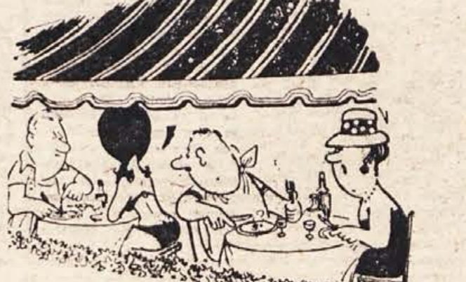
— Te zanima, kaj onadva jesta?

no kolesnico, lahko sledite okrog 30 km daleč povsod, kjer je svet bol kamnit. Italijanski arheologi so se že bežno zanimali za ta pojav in pred prvo svetovno vojno je na tej gmajni fotografiral prav ob tej kolesnici risarjevega očeta tedanjih ravnatelj trzaškega muzeja. Po dobrih petdesetih letih je ta sled še prav dobri vidna, čeprav jo je že tu in tam zarasla trava in mlado borovje. Seveda bi bilo težko drzno domnevo dokazati — najbrž pa sploh nemogoče. A neka zveza je, Dobrileva misel ni povsem brez podlage vsaj v toliko, da so po tem ozemlju res vodile prastare grške trgovske poti, ki pa so doslej kaj slabo raziskane. Vendar redke najdbe čisto določeno pričajo o do tu razpredeni grški trgovski mreži. S tega stališča je za nas pripovedka o Argonavtih gotovo zanimiva; saj je Dobrila tudi že tretji avtor, ki se je lotil njene obdelave pri nas. Zato upravičeno domnevamo, da bo tudi pri naših bralcih počela primerno priznanje. J. M.