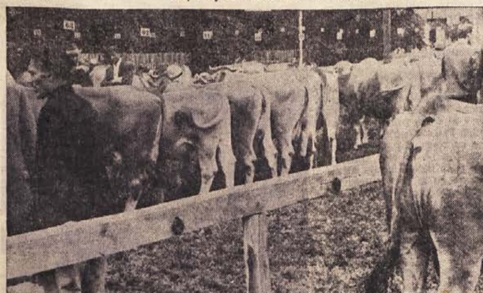
Takole je bilo prejšnji teden na živinorejski razstavi, ki sta jo 8. septembra organizirala v Ribnici domača kmetijska zadruga in Kmetijski inštitut iz Ljubljane

slabe organizacije šolstva v Kočevju pomanjkanje učilnic, zato je potrebno, da se čim prej sestavi odbor za gradnjo nove šole. Hkrati so odborniki sprejeli sklep o ukinitvi šole v Lazah ob Kolpi. Trije učenci se bodo prešolali v Kočevje, ostalih osem pa v šolo v Predgradu.