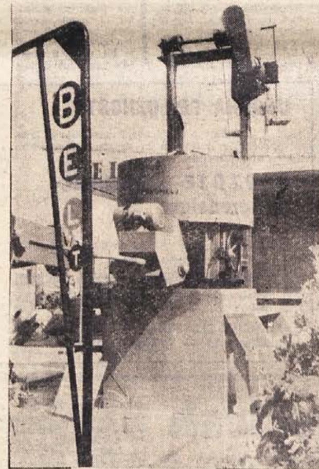
BELTOV mešalec za livarski pesek na zagrebškem velesojmu