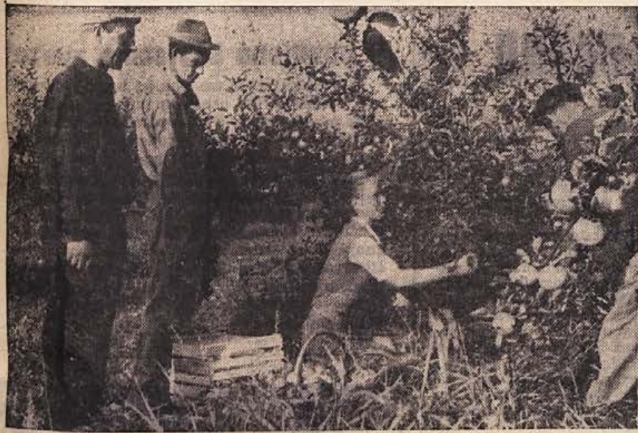
V vrhpoljskem novem sadovnjaku že pridno obirajo zgodnje sorte jabolk. Zal črno-bela fotografija ne more pokazati, kako polna so mlada drevesa — kajti na njih so bila rdeča jabolka, sadež poleg sadeža, da se veje kar šibijo...