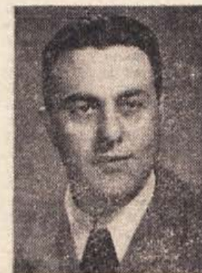
in mladosten — mu želimo še mnogo let življenja in veliko uspehov pri delu!

RK in sindikata, kot dobrega člana ZB in zgledega komuniste, ki že vrsto let uspešno sodeluje v samoupravnih organih naše bolnišnice. Za vestno opravljanje odgovornega dela ga je Prezidijska skupščina SRS že odlikoval z redom dela III. stopnje. Ob lepem jubileju — dočakal ga je svež