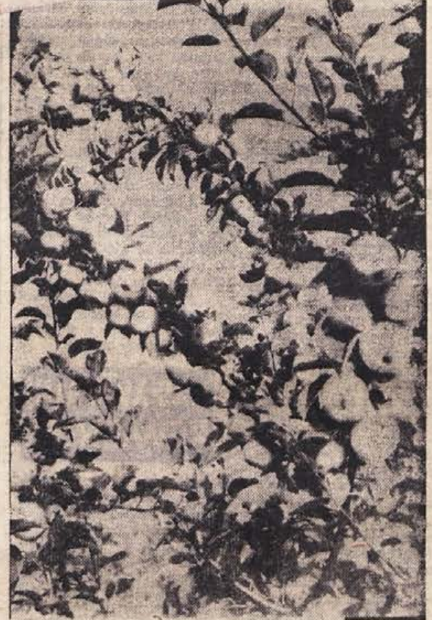
JESEN BOGATA, DOBRA ŽENA... Težko so obložena mlada drevesca v novem sadovnjaku v Vrhpolju pri Sentjerneju, kjer je letos v rodnosti polovica od 7.000 dreves, druga polovica nasada pa bo začela roditi prihodnje leto. Več o tem kmetijskem obratu berite na 3. strani današnje številke!

Upamo lahko, da sredstva za izobraževanje kadrov v delovnih organizacijah letos ne bodo ostala neizkoriščena tako kot lani in poprej. Zlasti v podjetjih, ki so v rekonstrukciji ali v investicijski izgradnji, bodo porabili vseh razpoložljivih 2,5 odst. od osebnih dohodkov v ta namen. Pohvaliti je treba Novoteks, Labod, Industrio obutve, Gozdno gospodarstvo, Kremen, ZTP, Iskrine obrate, Opremales, Novoles in IMV. Enostranskemu vlaganju v stavbe in opremo brez hkratne skrbi za izobraževanje strokovnjakov je torej odklenalo. V vseh kolektivih pa bodo morali še veliko napravljati o tem, kakšni naj bodo kriteriji za podelitev študentij in hkrati poskrbeti, da bo odhajalo na visoke in višje šole več študentov iz delavskih in kmečkih vrst!