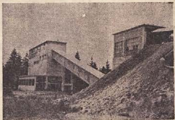
Pozdrav iz rudnika Kanžarica