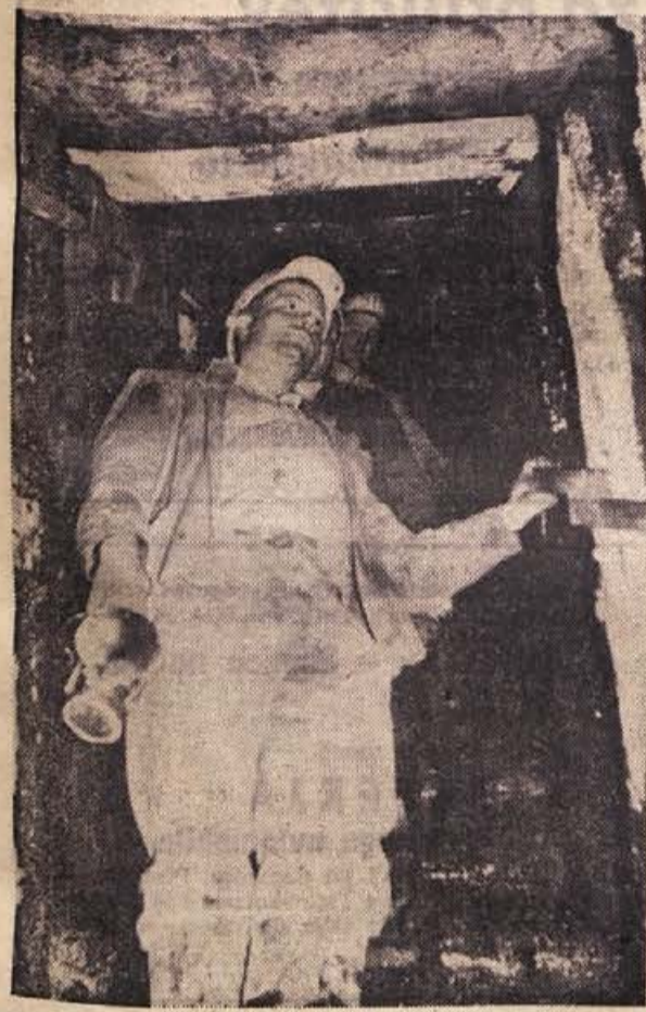
Takšna je pot na delo in z dela v starem jašku rudnika Kanižarica. Rudarji porabijo za spust, povratek in površino skoraj dve uri časa! Čitek in povratek na površino skoraj dve uri časa! To se pozna tudi pri jamskem učinku.