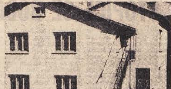
4. novembra letos bo verjetno le dograjena nova šola na Travi v kočevski občini. Sole bodo prebivalci vsestransko veseli, saj bodo v njej imeli klubski prostor, prhe za kopanje in predvsem: prijeten dom za učeo se mladino!

od republiškega povprečja, zato jih bodo sedaj povišali za 10 odst., dodatek na draginjo pa znaša 3.000 din. Povečale se bodo tudi stipendije, tako da bo povprečje 16.000 din, za 2.000 din pa se bodo povečale podpore socialno ogroženim. Potrebno bo tudi povečati podpore družinam kadrovcem, za 3.000 din pa se bodo povečale tudi podpore žrtvam fašističnega nasilja in otrokom padlih borcev ter priznavalnine borcem. —vec