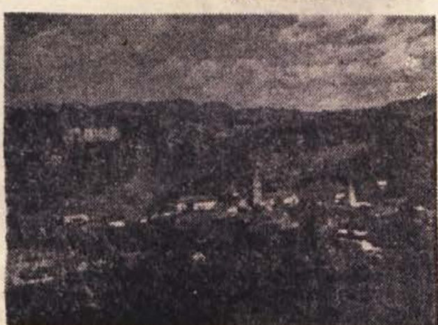
Sevnica z gradom