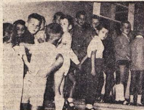
Takole so minulo soboto čakali prvošolčki v vrsti pred osnovno šolo Katje Rupena v Novem mestu, da jih tovarišice popeljejo v hram učenosti. Nekateri so imeli solze v očeh, drugi so bili neučakani.

Vaščani so lepo uredili gasilski dom, za praznik pa so dobili novo motorno brizgalno, s katero bodo odslej upravljali vaški gasilci. Pokrivilci nad gasilskim slavjem je bilo podjetje »Avto-obnova« iz Maribora. — Popoldne se je po svečanostih razvila prijetna zabava, na kateri so se srečali stari znanci in ob dobri kapljici kramljali pozno v noč.