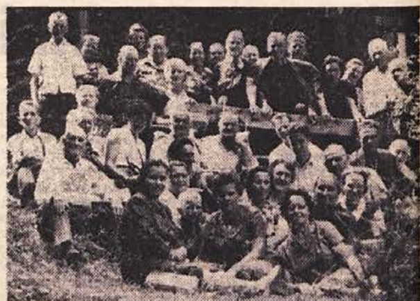
Člani invalidske organizacije iz Dol. Toplic smo pred nedavnim priredili izlet v partizanske kraje. Spetoma smo se ustavili na Bledu in si z blejskega gradu ogledali jezero z okolico. Od tu smo odšli v Begunje na ogled muzeja talcev in zaporov. Na poti iz Kranjske gore proti Vrhu smo se ustavili pri Ruski kapeli, kjer so pokopani ruski vojaki, ki jih je zasul snežni plaz v prvi svetovni vojni, ko so gradili cesto. Bil smo tudi pri izviru Soče, odkoder smo nadaljevali pot do zgodovinskega Cerkena. Tam smo obiskali spomenike in spominske plošče. Ob grobnici, kjer je pokopan 47 gojencev partijske šole, smo počastili njih spomin z enominutnim molkom. Tudi v bolnici Franja smo se zadržali pri ogledu objektov, o zgodovini bolnice pa nam je pripovedoval oskrbnik. Na povratku domov smo obiskali še Novo Gorico, Vipavo, Ribnico in nazadnje še Kočevje in se posebno Šeškov dom ter muzej v domu. Z izletom smo bili vsi zelo zadovoljni. Zahvaljujemo se Avtobusnemu podjetju »Gorjanec« ter prizadevnemu soferju, ki nas je varno vozil.