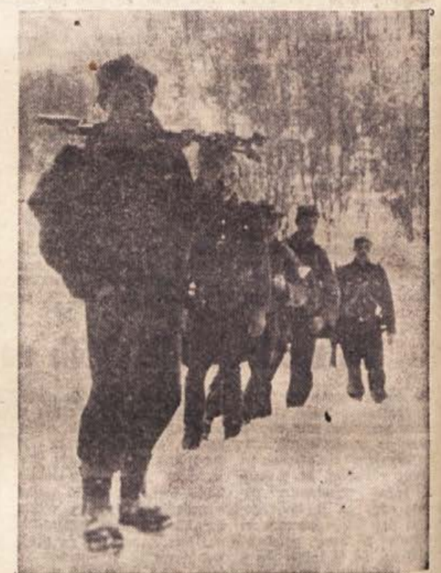
Borci Kozjanskega bataljona na pohodu v zimi 1944-45

Nemci so se res bliskovito bližali. Še malo in prispeli