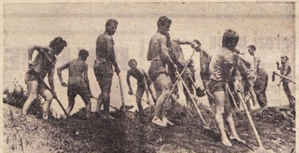
Brigadirji v Beli krajini so se te dni zamenjali, delo na cesti med Metliko in Črnomljem pa razveselivo napreduje