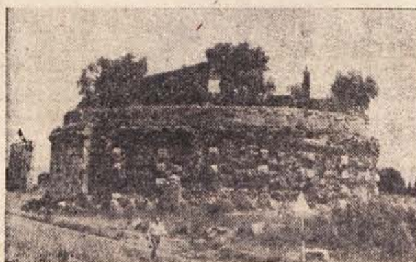
Grobnica ob Rimski cesti v Rimu

Srečanje v Genzanu se je spremenilo v manifestacijo prijateljstva. Starejši tovariši, dolgoletni delavski voditelji, so nam povedali, da so se v zaporih in koncentracijskih taboriških srečevali z Jugoslavlani, v katerih so našli plemenite tovariše in revolucionarne bojovnike. Zupan, ki nas je hotel še posebej pozdraviti v občinski dvorani, je romal iz zapora v zapor skozi vse obdobje fašizma. Pravijo, da