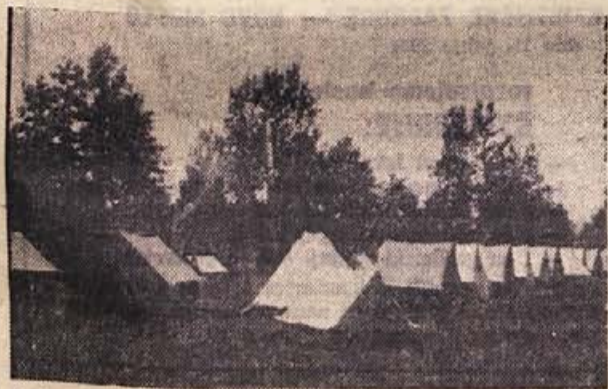
Sotori tabornikov Odrada narodnih herojev iz Črnomlja ob Kolpi na Vinici