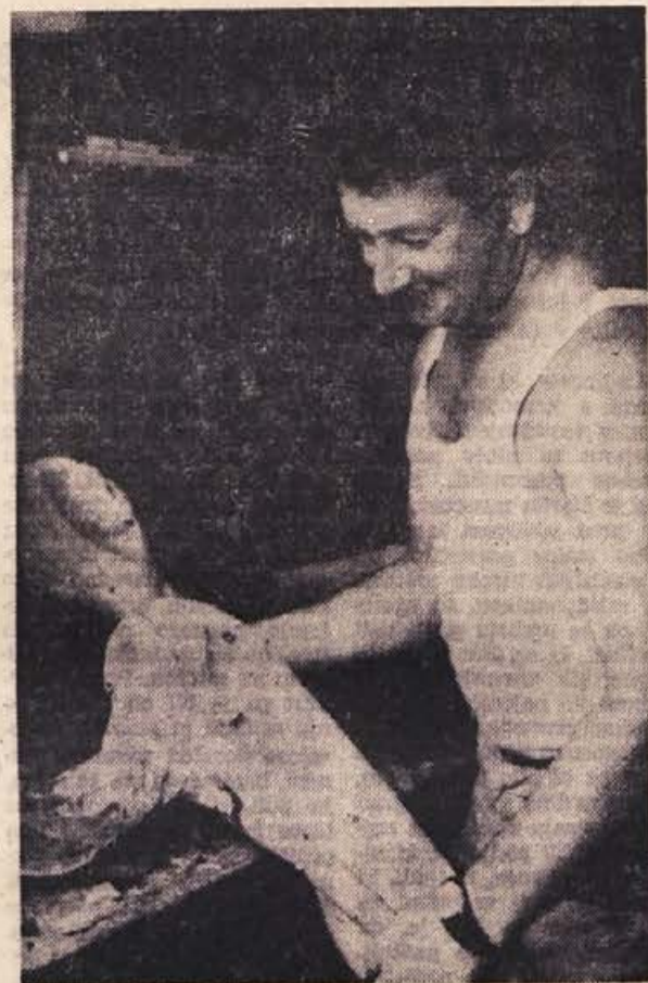
V vse, kar izkleše, izdolbe ali nariše, vloži del samega sebe, svoje srce, svojo ljubezen do lepega...

In spet govori o načrtih. O prihodnjih načrtih, velikih, pri tem pa je ves v sedanjem delu, ob kipu, ki ga pravkar končuje. Za nekaj dni ga bo