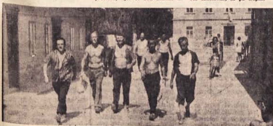
Ekipa ribniških borcev je prispela med prvimi na cilj