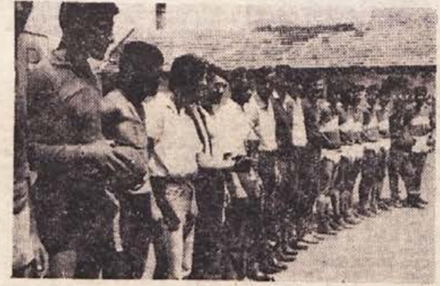
Zmagovalna ekipa Dobropolj in domačega Partizana

Dober teki Mladinci so si ga po napornem dopoldnevu zaslužili. IVAN ZORAN