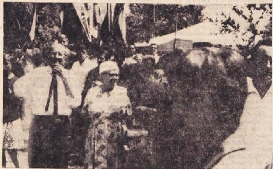
S sobotnega srečanja rojakov-izseljencev na pikniku v Vinomeru nad Metliko: koliko pristrčnih snidenj, koliko sreče, ko so se s svojci spet videli po dolgih dolgih letih...

Tudi v kmetijstvu, zlasti v času združevanja, se sproščajo problemi, ki jim je treba posvečati večjo pozornost. Če smo na eni strani za pospeševanje družbenega kmetijstva, ko-