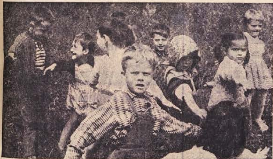
Takole se gredo »lisičke« malčki v otroškem vrtcu »Vide Tomšič« v Novem mestu; veliko lepih uric užijejo na svežem zraku v igrah in radostnem rajanju.