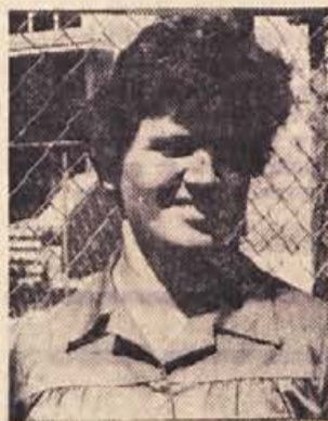
«Najbolj bi potrebovali vrtec!» trdi tovarišica Zorčeva

— Vam je všeč na semiški šoli? — Ze tri leta sem tu. Letos sem prevzela pouk v prvem razredu, ki ga je še težje