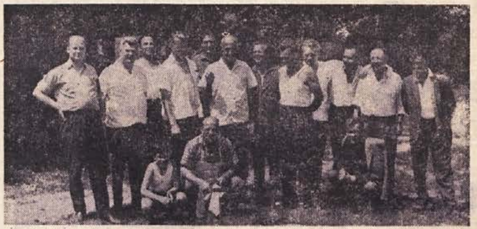
Udeleženci nedeljske taktične vaje rezervnih oficirjev v okolici Novega mesta

Sončen popoldan. Na začetku novomeške ulice stoje trije kratkohačni in neutrudno mečejo kamenje v prometni znak, ki stoji nad stopniščem ob stavbi Medobčinske zavarovalnice. S kamni, debelimi kot oreh, skušajo zadeti znak v polju, ki je od takšnega početja že vse okrušeno. Ljudje hodijo po ulici in bližnjem Glavnem trgu sem in tja, na koncu ulice pa stoji prodajalka, ki mimo dočim ponuja sluške. Kamni, ki jih mečejo kratkohačni nedebudneži, frčijo ljudem okoli glav. Kam vodi takšno početje, starši? — I —