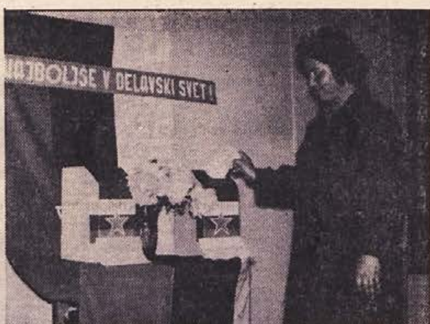
Takole so volili v novomeškem obratu Cestnega podjetja