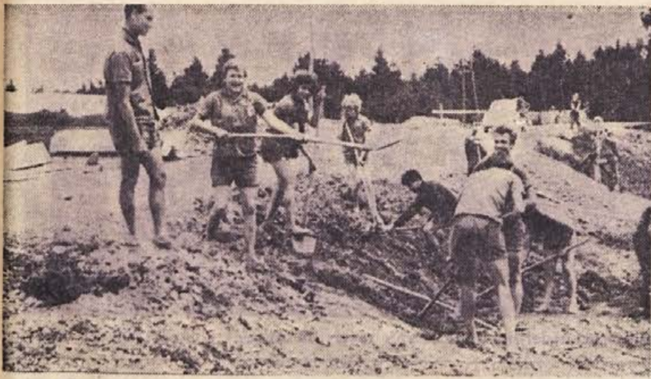
Belokranjski brigadirji na cesti med Gradcem in Podzemljem