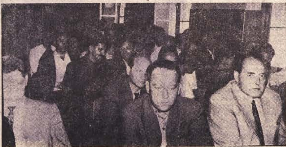
Delegati in gostje na novomeški predkongresni konferenci Zveze komunistov