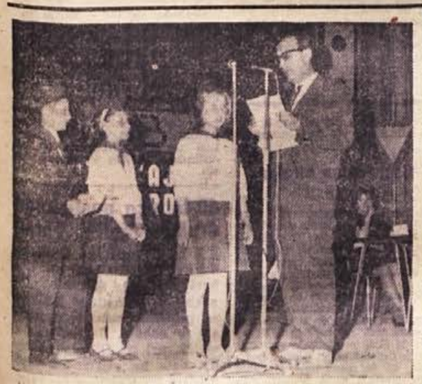
Pionirji iz osnovne šole Mrzlava vas pred mikrofonom

V drugem delu smo videli izredno dramatično borbo, ki je dosegla vrhunec nekaj minut pred koncem. Novomeščani so tri minute pred koncem znižali razliko na pet pik, tedaj pa sta stopila na sceno sodnika, ki sta že prej naredila nekaj večjih napak, in prisodila žogo Medvodčanom, čeravno so vsi, kar jih je bilo na igrišču, to obsodili. Gostje so izkoristili priložnost, dosegli koš in tekma je bila odločena. Gledalci so bučno negodovali ob sodnikovih odločitvah, ki so stale domačine dve točki. Novomeščani pa so vložili protest zaradi materialnega kršenja pravil. Brččas bo protest zaradi pomanjkanja dokazov odbil.