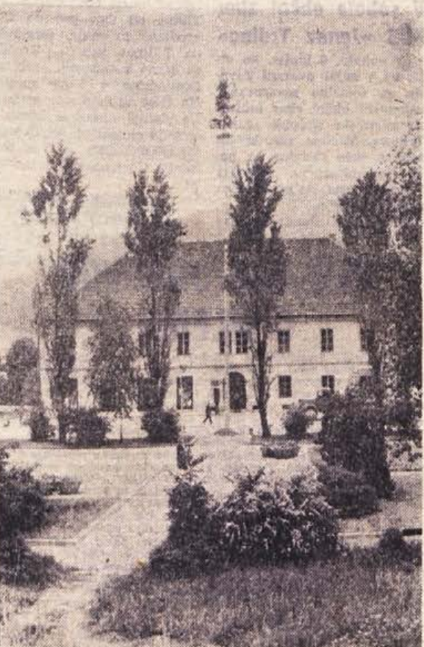
Popraznična fotografija: v Trebnjem še stoji mlaj, ki so ga občani postavili ob minulem krajevnem prazniku — 15. maju

Odborniki so zatem izglasovali priporočilo, naj bi se s 1. januarjem prihodnjega leta uvedlo razširjeno zdravstveno zavarovanje kmečke mladine. Na seji so sporočili, da bo do takega zavarovanja prišlo, če se bodo strinjale štiri dolenjske občine ljubljanskega okraja: Črnomelj, Metlika, Novo mesto in Trebnje. V trebanjski občini bodo v ta namen tudi zbori združnikov, na katerih bodo kmetovalci povedali, ali so pripravljeni prispevati del sredstev, ki je potreben za uveljavitev takega zavarovanja.