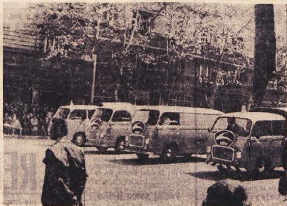
Na prvomajski paradi v Beogradu smo videli tudi osem avtomobilov novomeške INDUSTRIJE MOTORNIH VOZIL. — Na sliki: skupina kombijev, nekaj sto metrov pred glavno tribuno

Na breziškem stadionu bo v nedeljo ob 9. uri tekmovalje gasilskih pionirskih skupin, ki se ga bodo udeležili iz Brežic, Skopje, Cerklje, Krške vasi, Spodnje Pohance, Bukovška, Mosteca, Mijalovca, Bizelskega, Dečnih sel in okolice Brežic. Pionirji bodo tekmovali v kategorijah od 10. do 12. ter od 13. do 15. let. Mlajši bodo imeli na tekmovalni šolski vaji z brenčaco, pri čemer bodo z briganjem poskušali zadelati tarbo. Razen tega bodo odgovarjali na vprašanja, kako poznajo gasilsko orodje, preventivo in organizacijo gasilstva. Tekmovalci bodo se v prehodu po viseči lestvi, redovnih vajah in igri med dvema ognjema. Tekmovalci druge skupine bodo metali cvet na 105 m, plezali po viseči lestvi, tekli v štafeti 1x100 m z ovirami in prenašali ustno poročilo, metali žogo v koš in imeli redovne vaje. Pionirji z veseljem sledijo zgledu starejših gasilcev, saj bodo prav kmalu prevzeli njihove naloge. D. V.