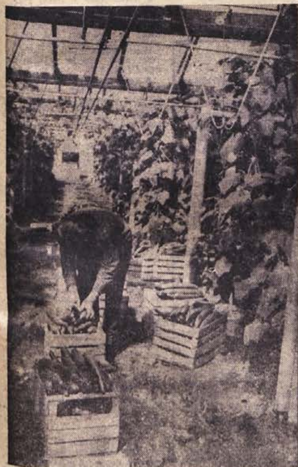
POMLADANSKA RAZGLEDNICA IZ RASTLINJAKA V ČATEŽU PRI BREŽICAH: gajbice so polne. Kumarice bodo čez dan ali dva že na dunajskem trgu, ki je nekoč že poznal krške rake-žlahtnike in brusniške češnje... Več o čateškem rastlinjaku berite na 5. strani današnje številke!

Pripombe občanov k osnutku občinskega statuta, ki jih ni bilo malo in so zajemale vsa področja, je treba sedaj le še zbrati in temeljito preštudirati, nato pa poskati najboljše pot, da bi zadostili željam občanov. Ni namreč — tako so ugotovili na seji IO ObO SZDL — dovolj, da probleme spoznamo, treba jih je preučiti in čimprej rešiti.