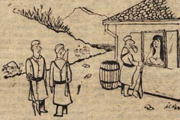
— Ti počasi se začnem bati za Stanka! Že devetlet je zdajle prosil za kozarec vode...