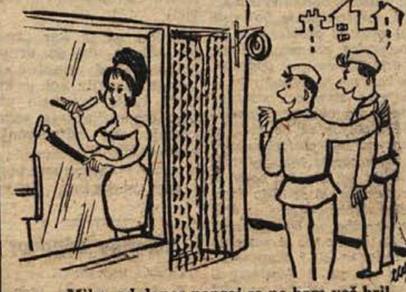
— Miha, od danes naprej se ne bom več bril v kasarni!