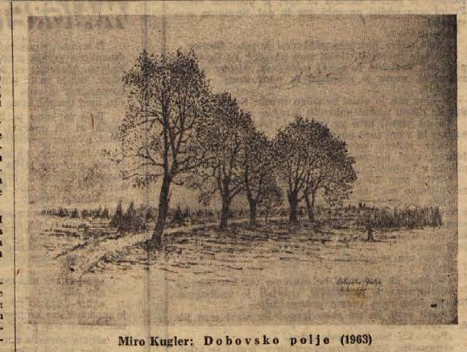
Miro Kugler: Dobovsko polje (1963)

Organizacijski odbor za proslavo 20-letnice partijske šole za Primorsko in Gorenjsko pripravlja proslavo in komemoracijo, razstavo partijskega šolsiva, oddajo »Se pomnite, tovariši«, radiotelevizijsko oddajo, monografijo partijske šole za Primorsko in Gorenjsko. Zato poziva in naproša vse preživele tečajnike in svoje padlih tečajnikov v Cerknem ter vse druge, da pošljejo svoje naslove, spomine, fotografije, pomembne prispevke ali karkoli, kar lahko nazorno osvetli idejno delo partijskega izobraževanja ali oživlja spomin na idejno-politično delo in na tragični dan v Cerknem. Gradivo pošljite na naslov: OKRAJNI KOMITE ZKS LJUBLJANA — organizacijski odbor za proslavo 20-letnice partijske šole za Primorsko in Gorenjsko, Resljeva cesta.