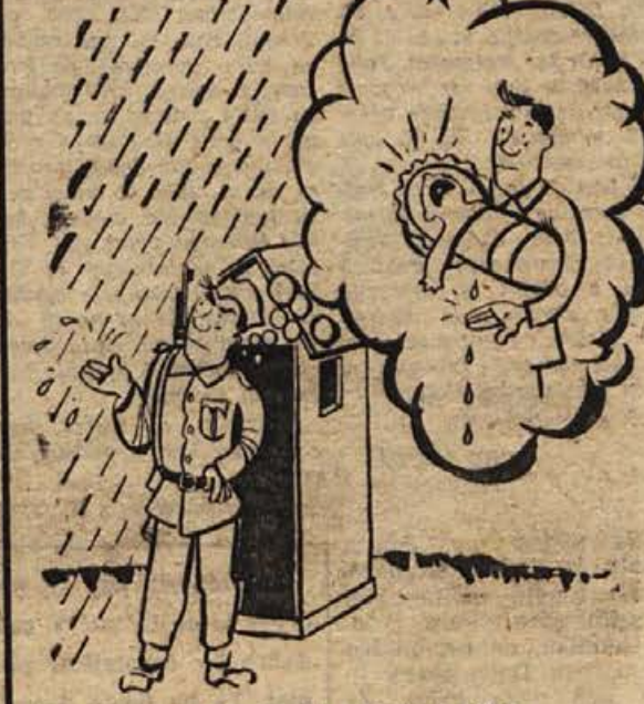
Asociacija mladega očka