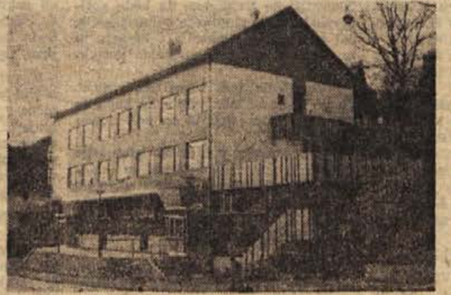
Nedavno odprti hotel »Bela krajina« v Metliki je že prve dni sprejel nekaj inozemskih turistov, ki se skozi našo državo vračajo v severne domovine. Hotel je najodobneje urejen, trenutno pa tudi najbolj obiskan lokal v Metliki.

Prebivalci stanovanjskih blokov ob tako imenovani »Tovarniški cesti« v Metliki so letos zgradili osem garaž za osebne avtomobile. Sredstva sta zbrala hišna sveta obeh tovarniških blokov. V garaže so skupaj vložili okrog 1 milijon dinarjev, več del pa