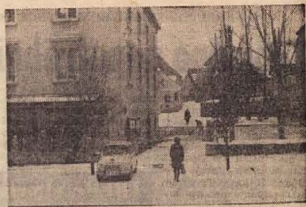
Prvi letošnji sneg v Novem mestu: takole je bilo v petek, 13. decembra; v ponedeljek pa smo imeli že skoraj slovenski rekord, saj nam ga je nasulo že 30 cm

V splošnem mizarstvu na Dvoru znatno občutijo pomanjkanje delovne sile. Trenutno manjka 5 kvalificiranih mizarjev in trije nekvalificirani delavci. V prihodnjem letu bodo izdelovali okrog 98 odstotkov svojih proizvodov za ljubljansko podjetje »Lesnino«. Proizvodnje novih izdelkov ne bodo uveljavili, ampak bodo v glavnem izdelovali še naprej opremo za dnevne sobe, razne vrste vitrin in knjižnih omar in drugo, s čimer so se že uveljavili na trgu.