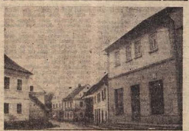
Do novega leta bodo v Semiču odprli sodobno urejeno poslovalnico trgovskega podjetja »Potrošnik« iz Črnomlja.