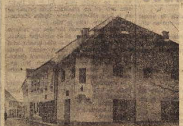
Med najpomembnejše krajevne pridobitve v zadnjem letu štejejo Žužemberčani sodobni trgovski lokal »Grad«, ki je poslovalnica trgovskega podjetja »Dolenjka« iz Novega mesta.

■ Za potrebe živinoraje potrebujemo v Sloveniji letno okrog 2000 ton krmilnega kvasa, ki ga sedaj tovarne močnih krmil uvajajo. Pivski kvas izdeluje le ljubljanska pivovarna, in sicer okrog 15 t letno. V bližnji prihodnosti bo potrebe pokrila nova čistilnica pri tovarni celuloze v Vidmu-Krškem, kjer naj bi iz odpadne sulfite ne krmilnice pridobili okrog 2640 ton krmilnega kvasa. Upajmo, da ne bo ostalo le pri načrtih!