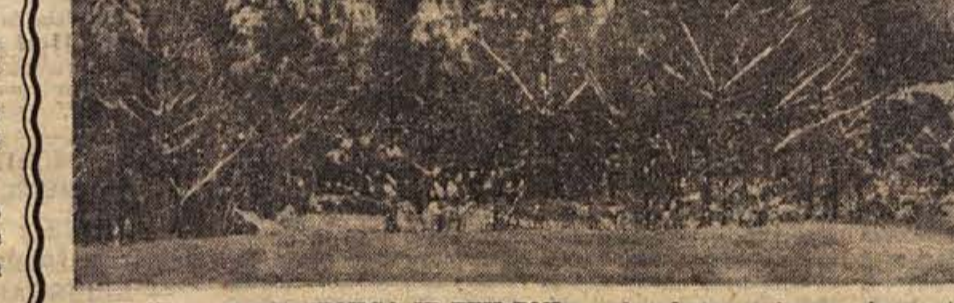
BREŽIŠKA RAZGLEDNICA IZ TEH DNI: grad, v katerem ima svoje prostore Posavski muzej (prihodnji teden bomo objavili o njegovih zakladih daljši sestanek), je pokrila snežna odeja...

Stari most — simbol Mostarja — je skoraj 4 stoletja kljuboval času. Zgradil so ga leta 1566 po načrtih Hajrudina. S svojo elegantno linijo in izrednim lokom je vzbujal občudovanje potopiscev, navdahnil je mnoge umetnike in od nekaj u stavljaval popotnika. Kot ena naših največjih zanimivosti iz preteklosti se je priljubila tudi turistom.