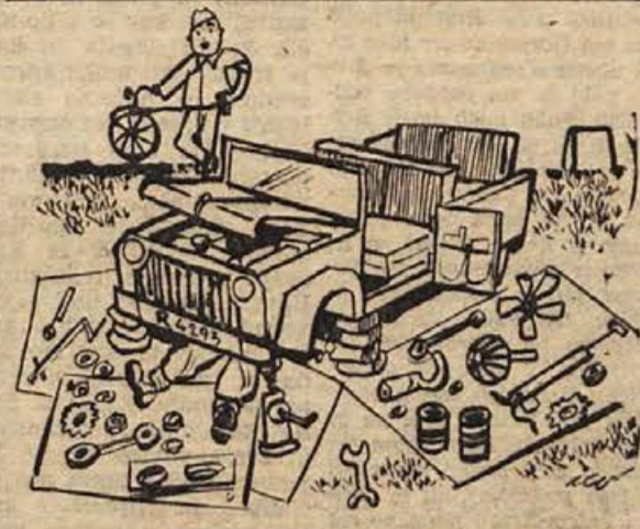
— No, prijateljček, ni kaj v redu?