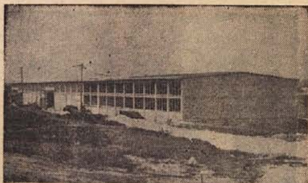
Garaže in delavnice Cestnega podjetja v Bučni vasi pri Novem mestu