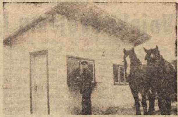
Nedavno je Mirna dobila svojo prvo trafiko. Lokalno stoji blizu železniške postaje.

Pred kratkim je bil na Mirni občni zbor sindikata prosvetnih delavcev v trebanjski občini. Obravnavali so nagrajevanje prosvetnih in pedagoških delavcev, njihovo stanovanjsko problematiko in podobna vprašanja. V posebnih točki dnevnega reda so razpravljali o reorganizaciji svoje sindikalne podružnice in se odločili za tri nove podružnice prosvetnih delavcev: v Trebnjem, Mokronogu in na Mirni. Menijo, da bo na ta način lažje izpolnjevati naloge.