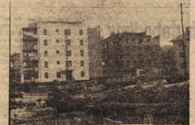
Moderna črnomaljska mestna četrt se vsako leto poveča za nov stanovanjski blok. Letos so zgradili tega, ki je na sliki v sredini. Del niso dokončali, ker jih je prehitelo hladno in za opravljanje zidarskih del neugodno vreme. Spredaj je skladišče bučkove hlodovine podjetja »Zora«.