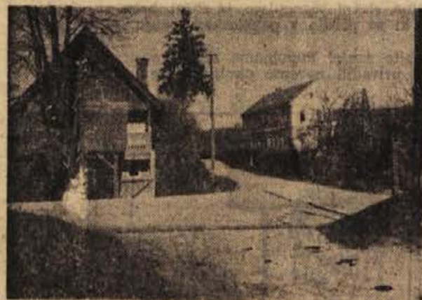
Križišče v Globokem, seveda pred zadnjim snegom

Zveza prijateljev mladine priporoča v otroškem vrtcu kolektivno obdaritev, vendar ne takih daril, ki jih lahko kasneje uporabljajo samo odrasli (npr. televizor). Društva, šole in vrtci naj izbirajo med športnimi rekviziti, pripomočki za delo v pionirskih krožkih in knjižnimi zbirkami.