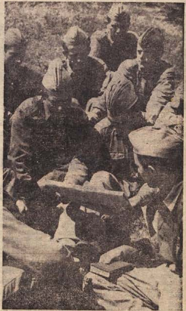
V naši ljudski armadi borci in starešine veliko bero; razgledanost v domačih in svetovnih dogodkih sodi med dolžnosti, katerih je vsakdo vesel