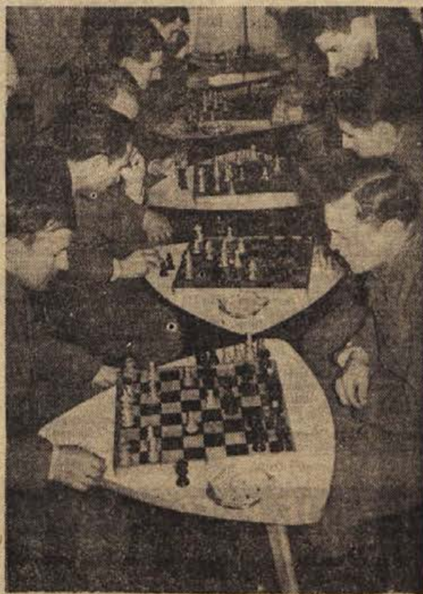
Šah je priljubljena igra v vseh garnizijah JLA. Ob šahovnicah prežive borci in starešine mnogo prijetnih uric in nešteto ostrih, zagriženih bitk dobojujejo na črno-belih poljih