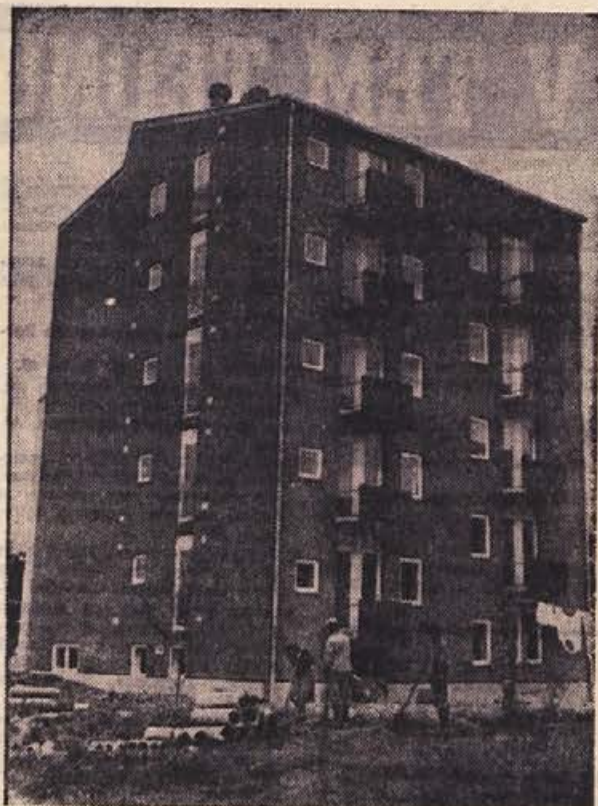
Ko je bil v ta stolpič v novem stanovanjskem naselju v Brežicah uperjen naš objektiv, je bila stavba še prazna. Zdaj pa se v njej prav gotovo dobro počutijo stanovalci, ki so se medtem vselili