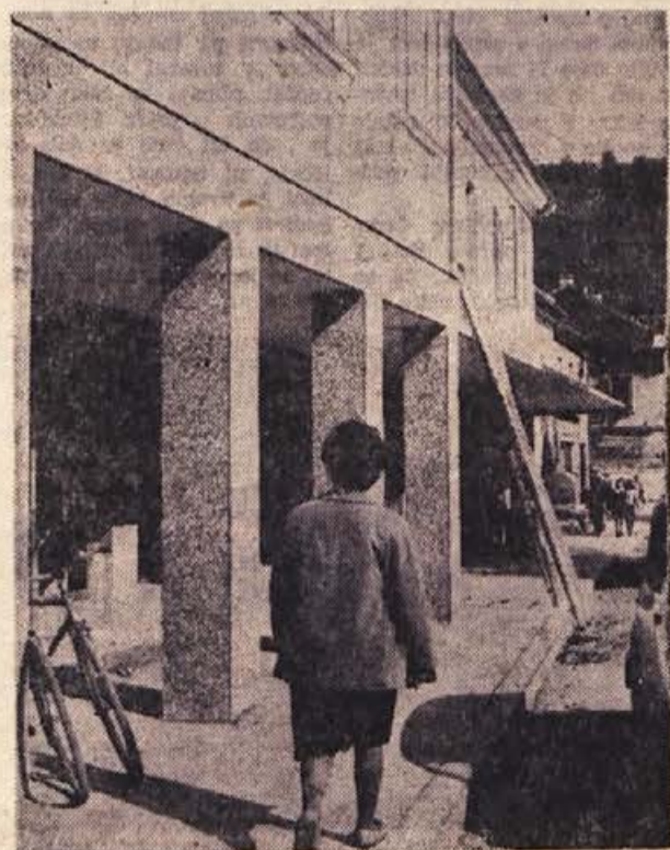
Nova trgovina v Sevnici je urejena na način, ki bo omogočil sodobno in kulturno postrežbo