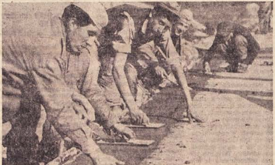
Takole je bilo zadnje dni na avtomobilski cesti pod Beogradom. Največje delo jugoslovanske mladine bo te dni končano pred rokom — od Ljubljane do Gevgelije v Makedoniji je stekla črno-bela magistrala jugoslovanskih narodov

(Odlomek iz zbornika »ORIS MLADINSKEGA GIBANJA V NOB 1941—1945«)