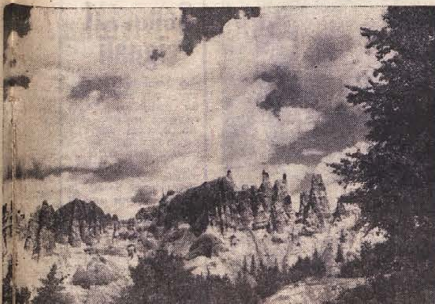
Pešane piramide pri Miljevini, severno od Sutjeske — pod temi vrhovi so se pribijali naši borci v V. sovražnikovi ofenzivi

Prvi del potovanja je za nami. Odtod dalje se bomo vozili mimo krajev, ki jih opisujejo nešteti prospekti v vseh evropskih jezikih.