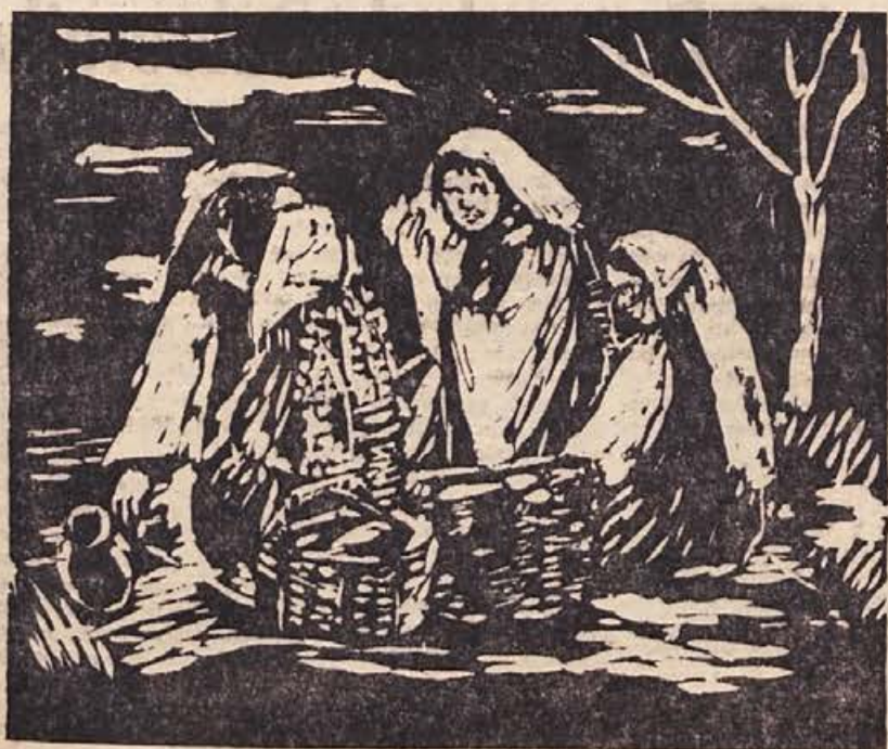
Zdenka Golob-Borčič: ŽENE (linorez)