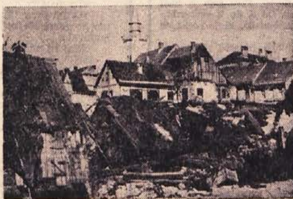
Črnomelj: takole je bilo mesto po bombardiranju 3. oktobra 1943

Glavni štab Slovenije je takoj pripravil partizansko ofenzivo, ki se je začela 12. novembra z blokado Novega mesta, medtem ko je Bela krajina bila že od 11. novembra popolnoma osvobojena.