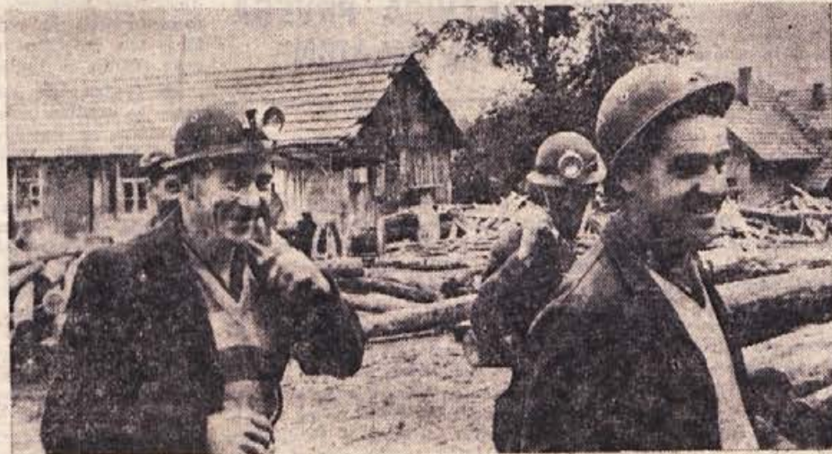
Rudarji iz Globokega so malce z nezaupanjem ogledovali nove čelade in akumulatorske električne svetilke, ki so montirane na njih. 10. oktobra so se prvič, odkar rudnik obstaja, namesto s karbidovkami odpravili v rov z električnimi svetilkami. Ko jim je delovodja obrazložil vse potrebno in dokazal, da so električne svetilke veliko uporabnejše od karbidovk, so se zadovoljno nasmejali, kakor vidite na sliki. S starim rudarskim pozdravom »Srečno!« so odšli na delo

Kako potrebno je bilo pričeti z obnovo, dovolj zgovorno priča nekaj številki: kmetijska zadruga je letos na svojih obnovljenih površinah v šestem letu po obnovi obrala po 95 hektolitrov muškata silvanca na hektar, vsaj 10 hektolitrov pa ga je na vsakem hektaru zgnilo. V zelo dobrih, starih vinogradih je letni pridelok največ 60 do 70 hektolitrov na hektar, v slabih pa nič več kot 25 hektolitrov na hektar. Razen tega morajo vinogradniki na neobnovljenih površinah vložiti po 280 delovnih dni ročnega dela na hektar, da dosežejo prej omenjeni pridelok, v sodobnih, terasastih vinogradniških plantažah pa pretežno del vsega opravijo stroji in je potrebnega le 80 dni ročnega dela na hektar.