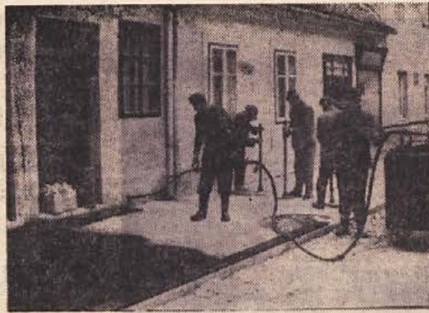
Komunalna uprava v Brežicah je letos uspešno začela urediti načrt, ki predvideva sodobno ureditev mesta. Nedavno so uredili cestno razsvetlavo, kanalizacijo v novem naselju, zdaj pa so na vrsti pločniki, ki jih bodo te dni asfaltirali. — Na sliki: skupina asfalterjev Komunalne uprave na delu v Brežicah.

Stalna kritika na račun brežiških pločnikov je odpadla. Te dni so dokončali asfaltiranje dela najbolj razdrapanih pločnikov od Ruha do gradu. Upamo, da se bo kmalu zbralo kaj sredstev za obnovo pločnikov na drugem delu ceste, zlasti pri mostu.