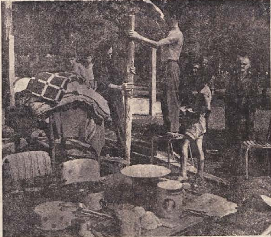
UREJAJO SI BIVALIŠČE — Sotori, ki jih pošiljajo kolektivi in posamezniki iz vseh krajev države, bodo za nekaj časa nudili vsaj zasilno streho številnim prebivalcem porušene Skopja.

Gorjanska košnja je v novejšem času izgubila svoj prvotni čar. Po košenicah samevajo tu pa tam redke kopicke. Zgodi se celo, da ostanejo cele košenice nepokošene. Vzrokov je več. Osnovni vzrok pa so vsakokrat ljudje. Skoro tri četrtine prebivalcev iz podgorjskih vasi: Gabrja, Suhadola, Cerovega loga, Dolu itd. so si poiskali službe v dolini ali odšli drugam. Vračajo se za nekoliko dni ob dopustih in se spet razgobe po službah. Poetično stran gorjanske košnje počasi izpodriva strah, kako dobiti delovno silo in spraviti seno v dolino, katerega ljudje nujno potrebujejo. Cas pa gre naprej... Se-se primeri, da se na širni košenici pri Miklavžu zbere vrsta koscev in da se ob popoldnevih z naloženimi smukami sena zvrsti tudi po 10 gospodarjev v dolino. (Smuke so posebna priprava za vodenje sena. To je voz s prvimi kolesi, na katerega so pritrjene dolge lege, ki tvorijo zadnji del voza. Tako Podgorci po kamnitih, strmih poteh že