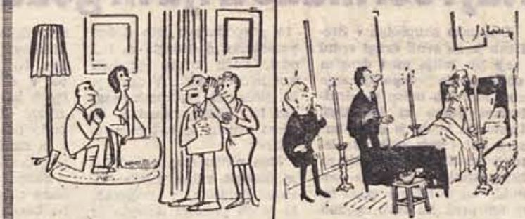
— Glasneje! — Kaj se dogaja?

Dobra gospa Maigret! Rada bi mu pomagala. Po navadi si ga ni upala spraševati o njegovem poklicnem delu — komajda o tem, kdaj se bo verjetno vrnil in obvedoval —, kadar pa je bil bolan in ga je videla pri delu, ni mogla drugače, kot da je bila nekoliko v skrbeh. »Nekaj je, česar ne razumem,« je spraševala naprej. »Ko si govoril o Lyonski postaji, si rekel, da se mož ni upal vrniti domov, ker bi zasledovalci prišli za njim.« »Da, najbrž sem rekel tako.« »Včeraj pa si mi rekel, da si je prav gotovo preoblekel suknjič.« »Da. No, in?« »In pravkar si sodniku govoril o polenovki, kot da jo je jedel v lastni gostilni. Potemtakem se je le vrnil domov. Potemtakem ga ni bilo več strah, da bi kdo prišel za njim v hišo.« »Ali je Maigret zares že poprej pomislil na to? Ali pa je odgovor ravno narobe kar stresel iz rokava?« »To se zelo lepo upoma. Na postaji je bil v terek zvečer. Takrat me še ni poklical. Upal je, da bo zasledovalcu usel.« »In drugi dan? Misliš, da ga niso več zasledovali?« »Morebiti res ne več. To je celo verjetno. Samo da sem tudi rekel, da se je okrog petih premislil. Ne pozabi, da je nekemu telefoniral in da je zahteval pi-semksi ovitek.« Ker je ni prepričal, je vseeno zavzdihnila. Nekaj časa je molčala. Potem je odprla usta in jih spet zaprla. Maigret se je oglašil: »Kar recite!«