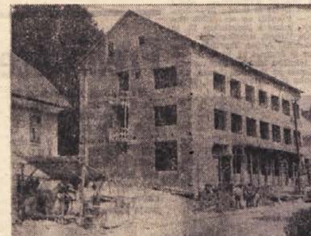
Novi hotel že dobiva svojo podobo. Prijetne sobice in moderna restavracija bo gotovo vabljiva točka za ljubitelje skrajnih južnih krajev Slovenije

● Načelnik oddelka za gospodarstvo pri občinski