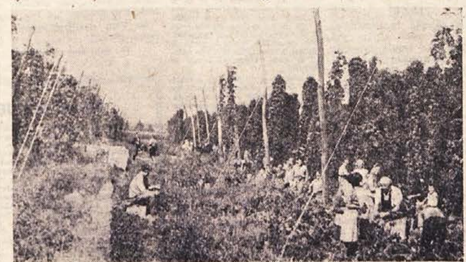
Te dni bodo oživila hmeljišča po Dolenjskem, v Beli krajini in Spodnjem Posavju

din, Stanovanjska skupnost Brežice 50.000 din, Delavska univerza Brežice 5900 din, Zavod za zaposlovanje delavcev 6762 din, Narodna banka Brežice 65.150 din, Komunalna banka Brežice 50.000 din, Obrtniki so zbrali 243.000 din, krajevne organizacije v Cerkljah 107.240 din, v Vel. Dolini 8000 din, v Dobovi 41.000 din o Krški vasi 26.300 din, Osnovna šola Velika Dolina je prispevala 18.000 din. Tudi zbiranje materiala se nadaljuje, prav tako kvodajalska akcija.