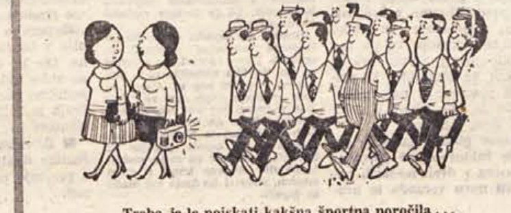
— Treba je le poiskati kakšna športna poročila...