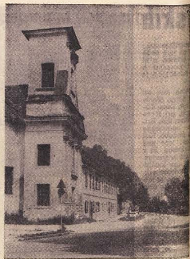
Razglednica iz starega predela Krškega