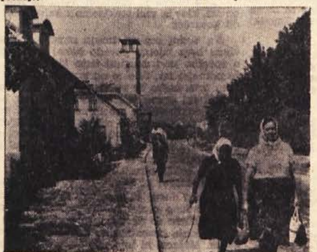
V Sevnico nakupovati!

Krvodajalci se še vedno prijavljajo, tako v skupinah kot posamezno. Doslej je prijavljenih za oddajo krvi že več kot 400 ljudi.