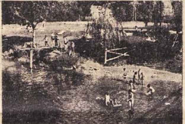
Kostanjevica, pa plitva Krka do kolen... in navdušenje kopalcev, ki jih obliva žgoče julijsko sonce...

(C) 3:08,2; 2. Nevenka Zlatič (C) 3:26,1; 3. Mateja Podlesnik (R) 3:30,5; 4. Joža Kerin (R) 3:36,9. 100 m hrbtino: 1. Marjeta Sribar (R) 1:29,6; 2. Franja Golob (R) 1:33,0; 3. Deja Gregorič (C) 1:36,1; 4. Branka Karabaš (C) 1:43,9. 100 m metuljček: 1. Vesna Breskvar (C) 1:24,8 (odličan čas); 2. Iška Kočar (R) 1:32,7; 3. Nevenka Zlatič (C) 1:41,0; 4. Marina Lenarčič (R) 1:45,4. 100 m prosto: 1. Silva Kostanjevica (R) 1:18,3; 2. Nevenka Kavšek (R) 1:21,0; 3. Meri Ravbar (C) 1:26,0; 4. Branka Karabaš (C) 1:31,3. Stafeta 4x100 m mešano: 1. Rudar (Marjeta Sribar, Mateja Podlesnik, Iška Kočar, Lučka Vodšek) 5:53,5; 2. Celulozar (Deja Gregorič, Nevenka Zlatič, Vesna Breskvar, Meri Ravbar) 6:08,9. V skupnem plasmanu severne skupine II. zvezne plavalne lige trenutno vodi Partizan — Celulozar Videm-Krško z več kot 400 točkami prednosti pred Medveščakom iz Zagreba, ki je trenutno drugi, tretji je Rudar Trbovlje, Črna Zvezda iz Beograda pa je izpadla iz lige, ker se ni udeleževala tekmovalni.