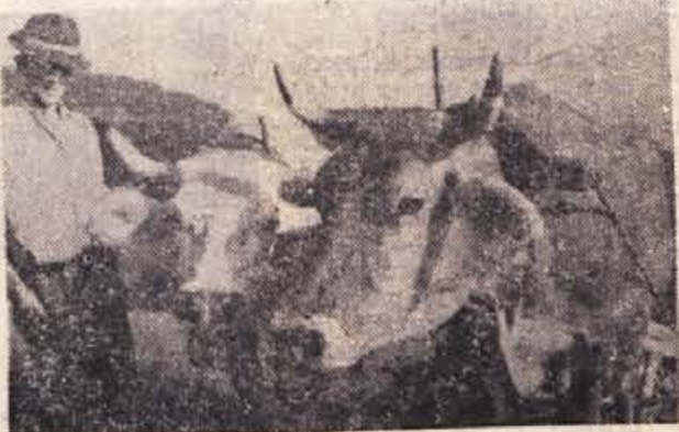
Potegnite voliči, onkraj poti je čeber hladne vode!

»Koliko pa prodate na mesec?« »Vsega skupaj za 250 tisoč dinarjev.« »Pa ste zadovoljni s svojim poslom?« »Zelo! Zelo sem zadovoljen! Lokal je lepo preurejen, ljudje radi kupujejo — lahko rečem, da res z velikim zanimanjem spremljajo vsako kolo in posel kar cvete. Prepričana sem, da bo še večji uspeh. Mislim, da vsaka srečka prinese človeku več sreče.« »Ali tudi sami igrate?« »Seveda. Vedno si kupim srečke.«